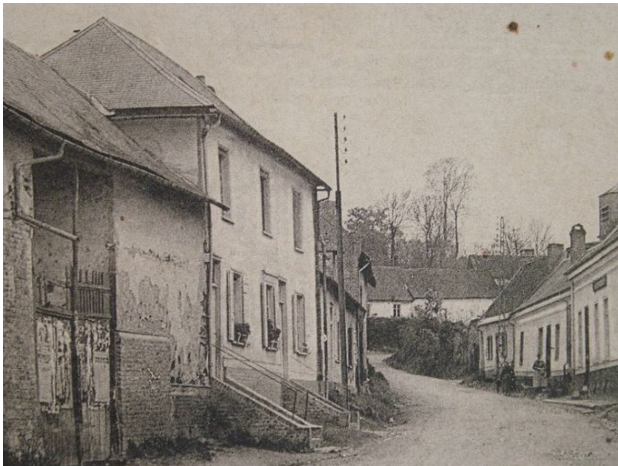
Vue de situation depuis la rue, avant 1914.