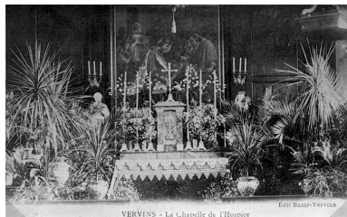
Vue du maître-autel de la chapelle avec le tableau d'autel, vers 1910.