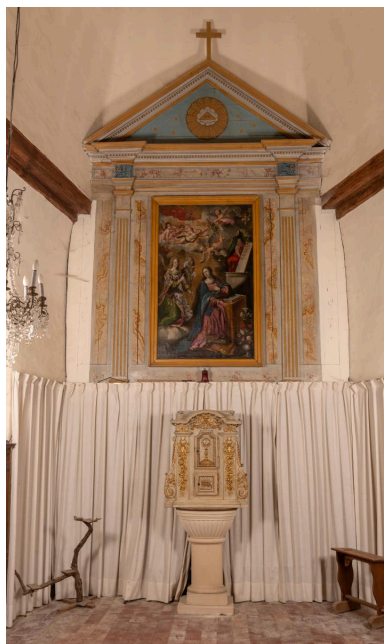
Éléments de l'ancien maître-autel. IVR32_20226000915NUCA