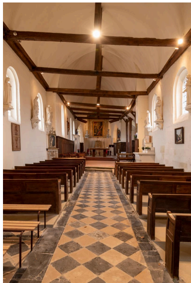
Vue générale vers le chœur.