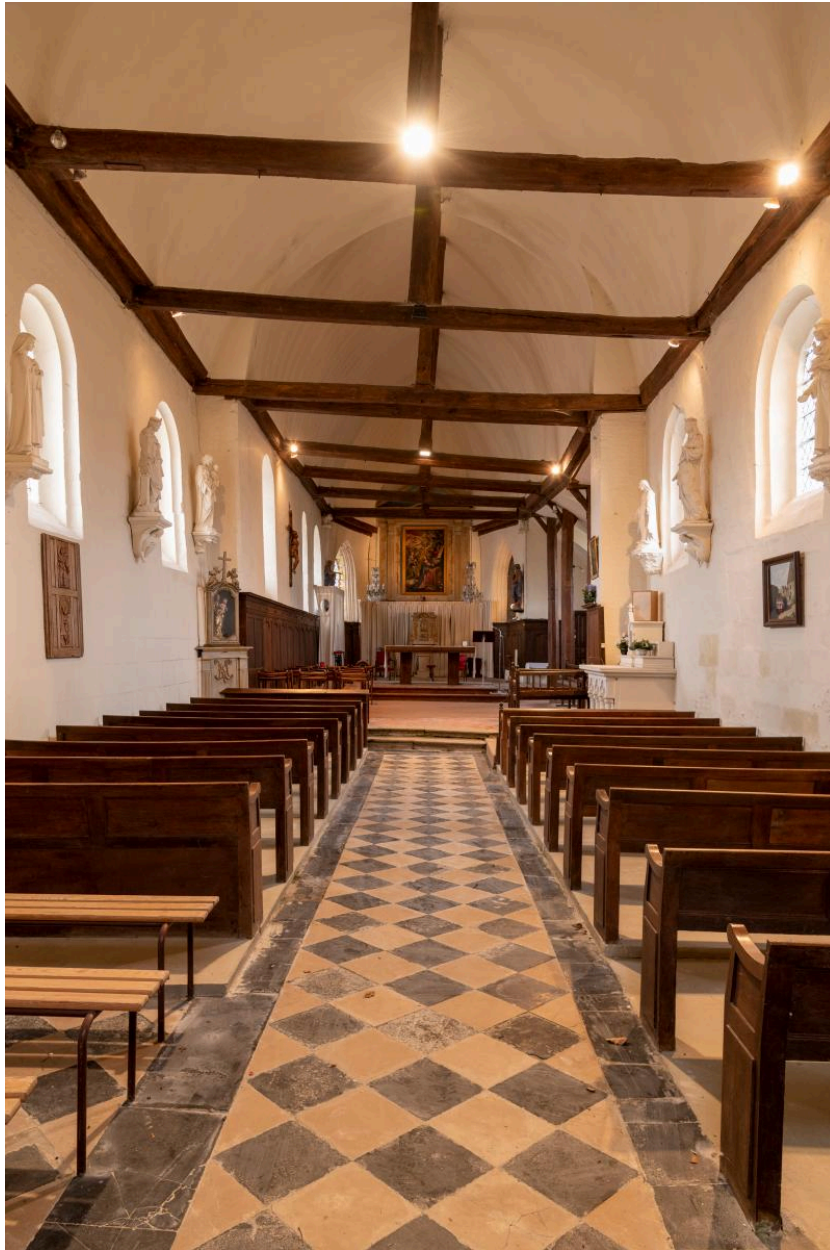
Vue générale vers le chœur.