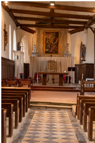
Vue générale du chœur depuis la nef. IVR32_20226000929NUCA