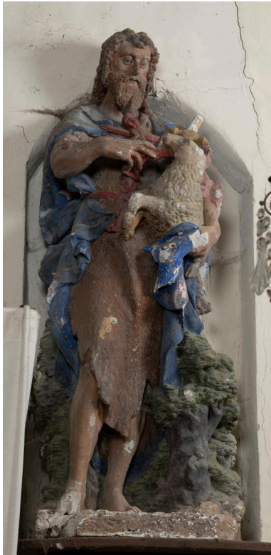
Saint Jean-Baptiste, pierre polychrome, 16e siècle.