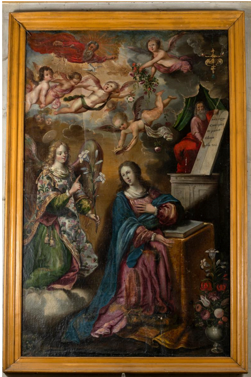
Annonciation, huile sur toile, R. Le Maire, 1636.