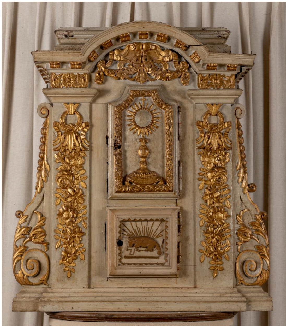
Tabernacle de l'ancien maître-autel, bois peint et doré, 2e quart 17e siècle.