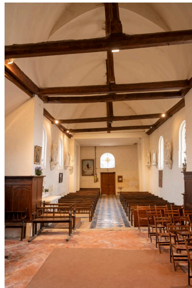
Vue générale vers la nef.