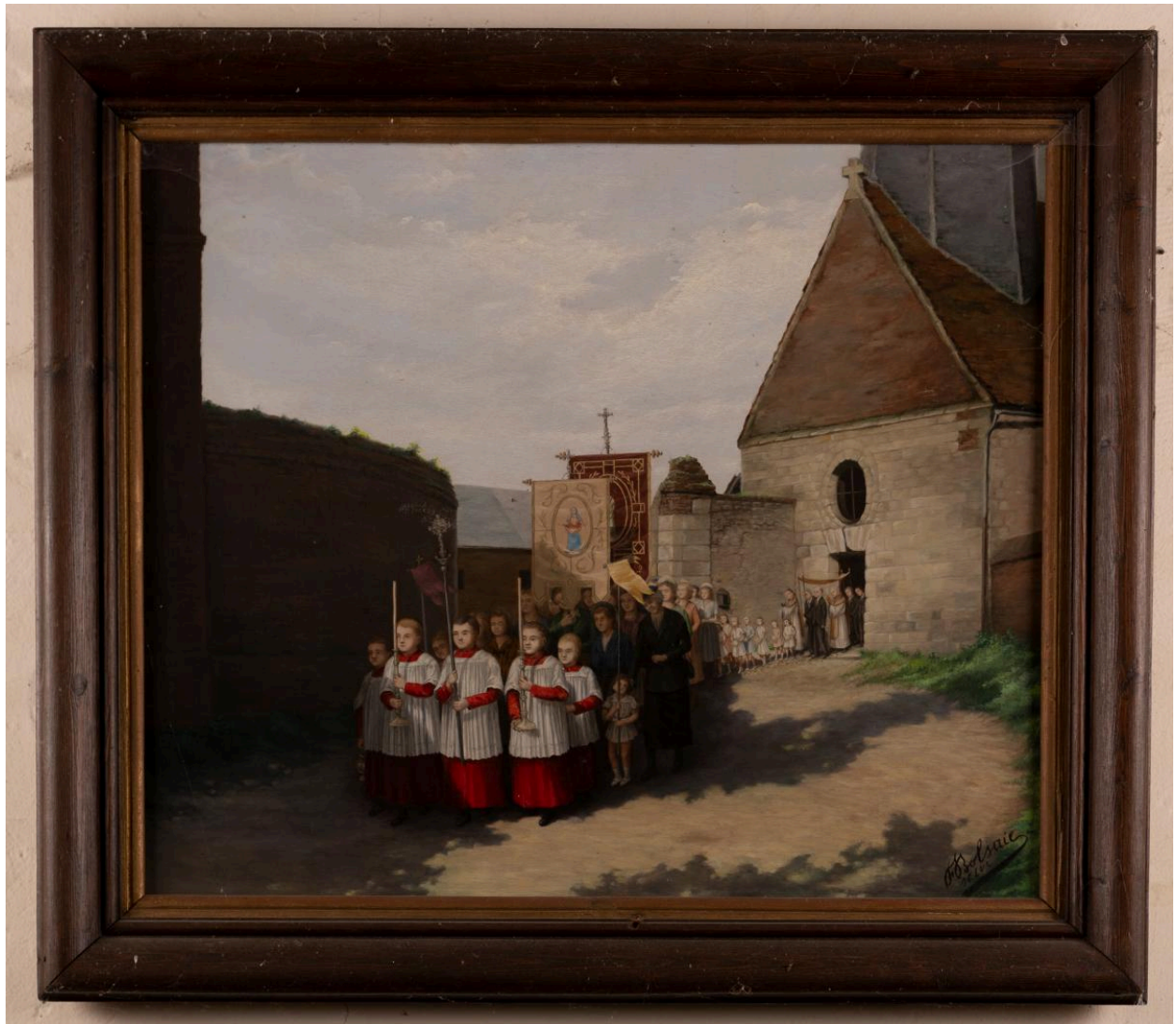
Procession devant l'église de Campremy, huile sur toile, Fernand Bolsaie, milieu du 20e siècle.