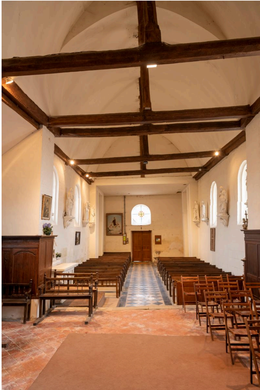
Vue générale vers la nef.