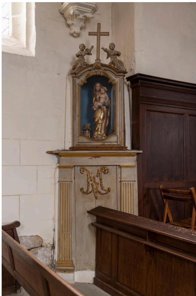
Oratoire de la Vierge, 18e et 19e siècles.