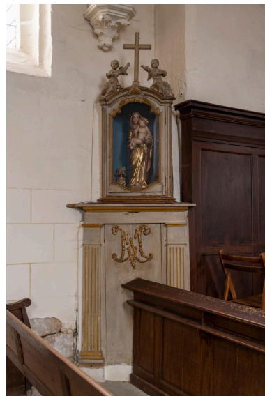
Oratoire de la Vierge, 18e et 19e siècles.