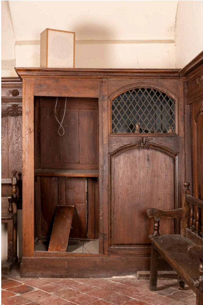
Confessionnal, bois, 19e siècle.