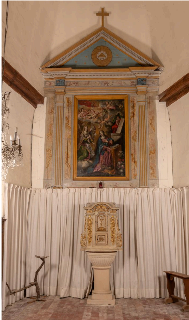
Éléments de l'ancien maître-autel.