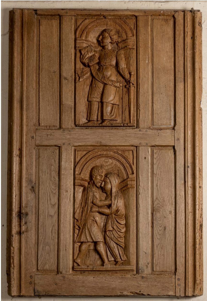
Panneau de chaire à prêcher : saint Paul et la Rencontre à la Porte dorée, 16e siècle.