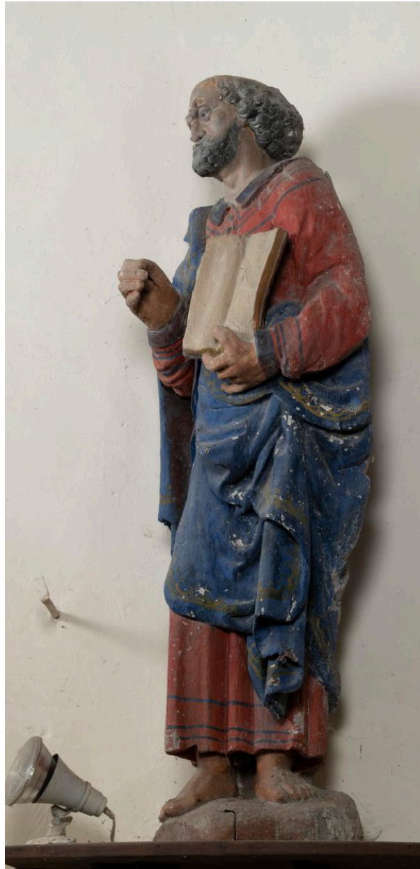
Saint Pierre, bois polychrome, 16e siècle.