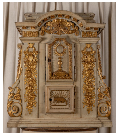
Tabernacle de l'ancien maître-autel, bois peint et doré, 2e quart 17e siècle. IVR32_20226000916NUCA