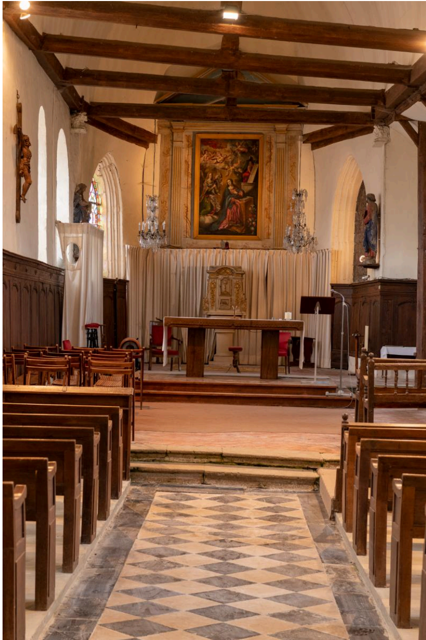
Vue générale du chœur depuis la nef.