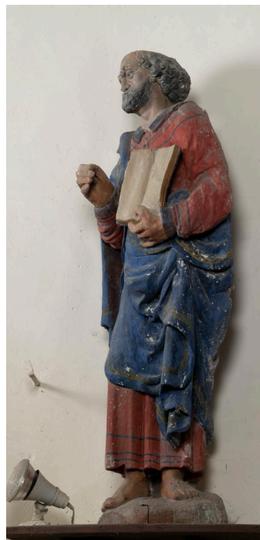
Saint Pierre, bois polychrome, 16e siècle. IVR32_20226000920NUCA