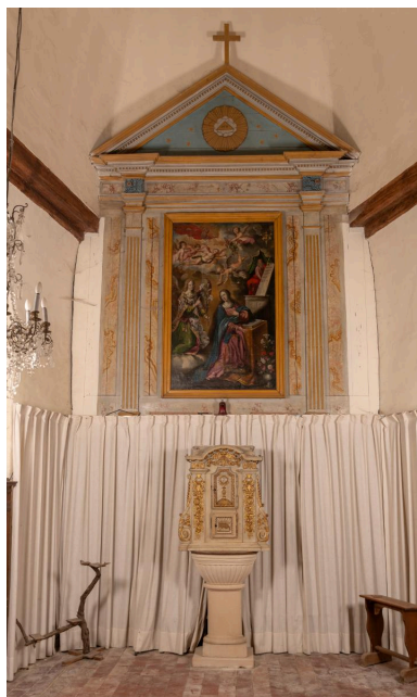
Éléments de l'ancien maître-autel.