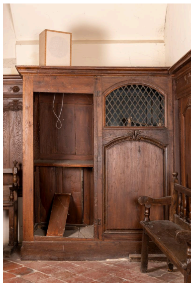
Confessionnal, bois, 19e siècle. IVR32_20226000925NUCA