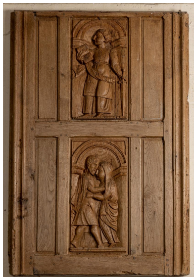
Panneau de chaire à prêcher : saint Paul et la Rencontre à la Porte dorée, 16e siècle. IVR32_20226000928NUCA