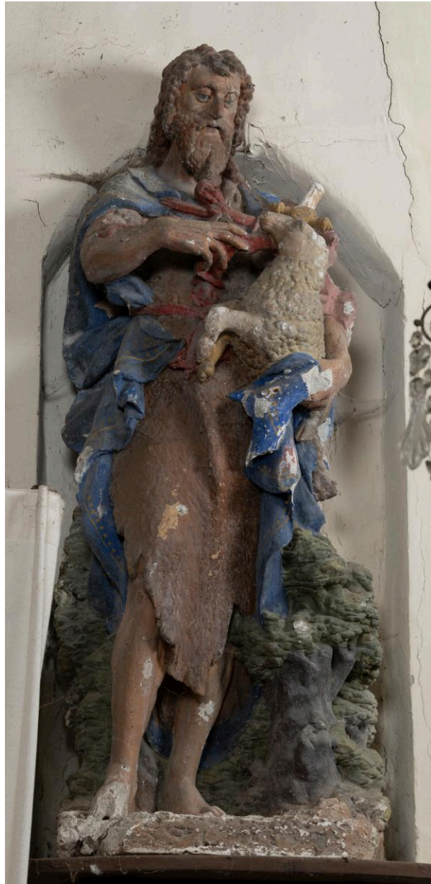
Saint Jean-Baptiste, pierre polychrome, 16e siècle.