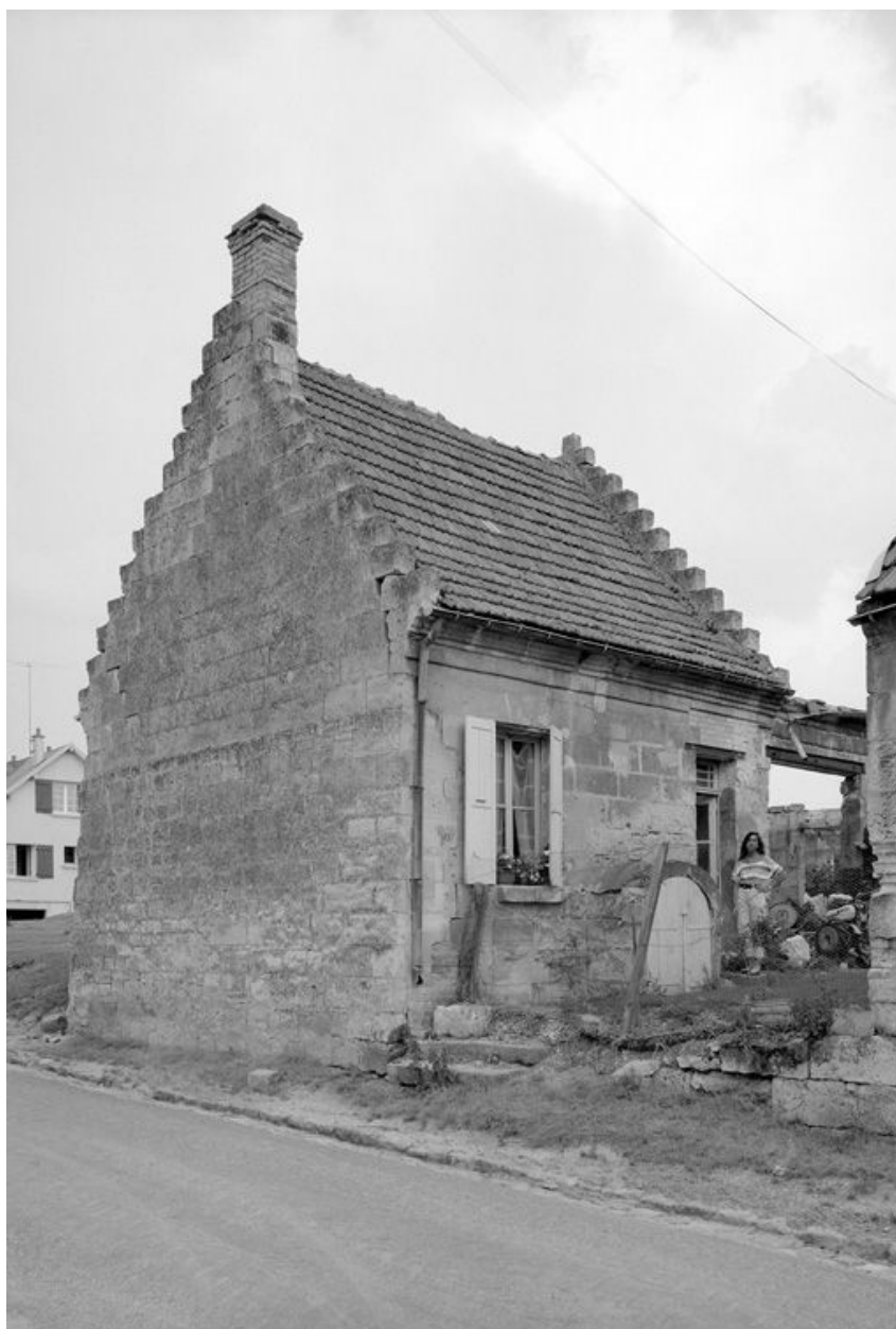
Ancienne grange transformée en logement.