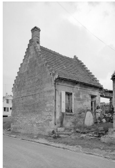
Ancienne grange transformée en logement.