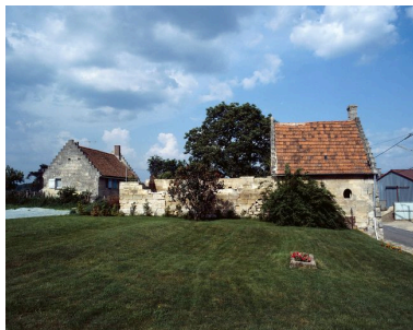
Vue générale. IVR22_19856000716XA