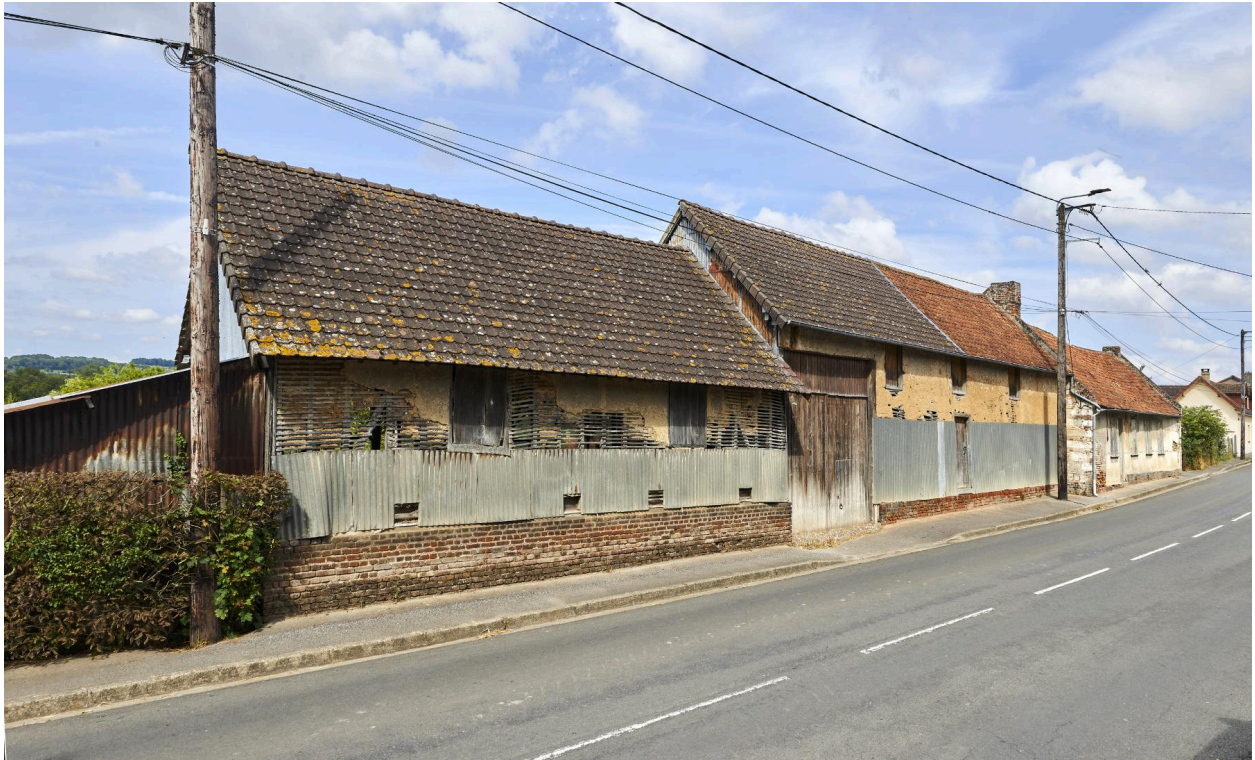
Vue sud des bâtiments agricoles, depuis la rue.