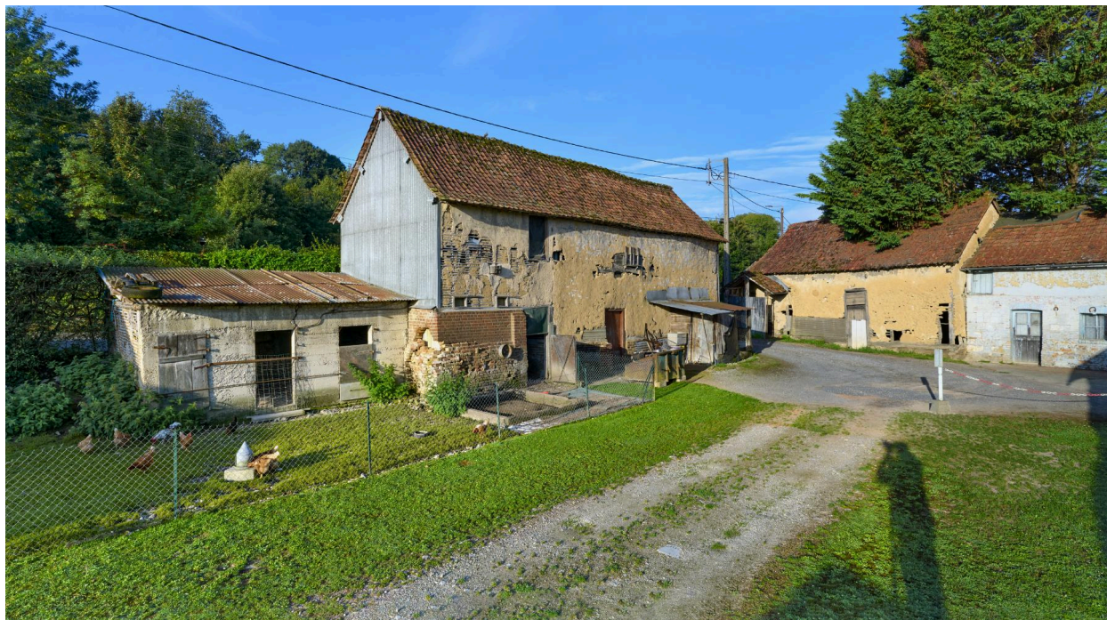
Vue sud-est des bâtiments agricoles, depuis la cour.