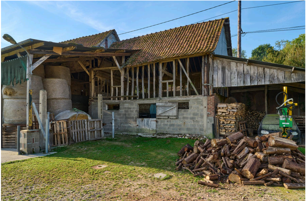
Vue nord des bâtiments agricoles, depuis la cour.