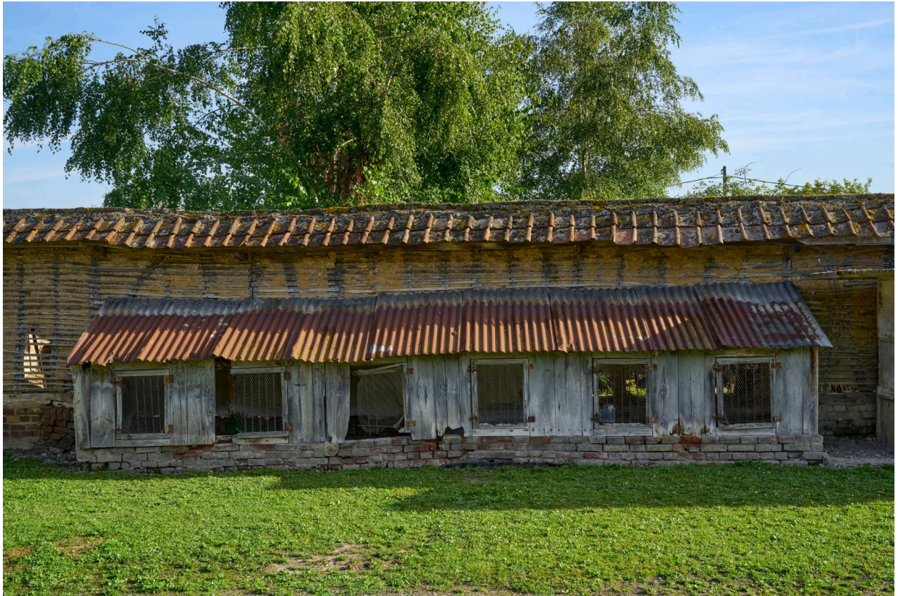
Rangée de poulaillers, depuis le sud.