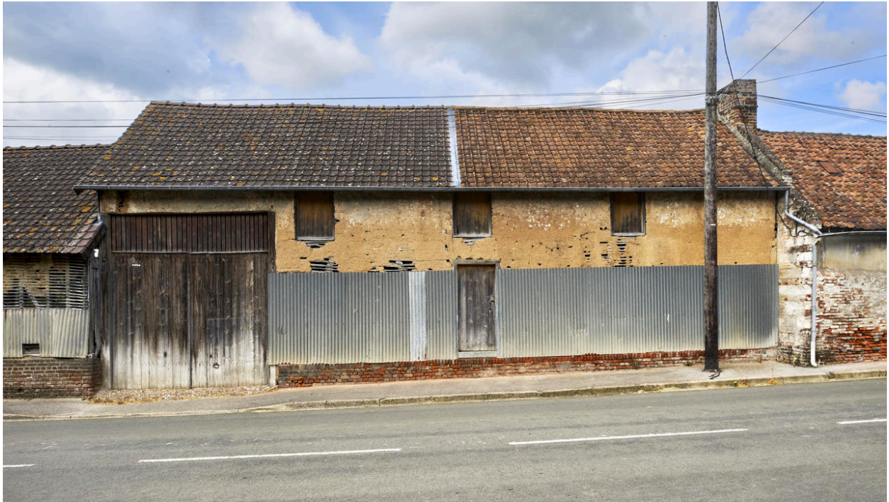
Façade sur rue de la grange et de l'entrée charretière de la seconde ferme.