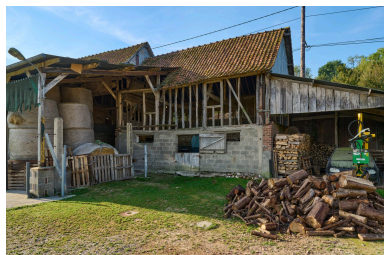
Vue nord des bâtiments agricoles, depuis la cour. IVR32_20238000629NUCA