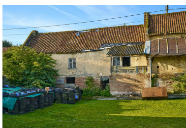
Vue nord de la deuxième maison, depuis la cour. IVR32_20238000624NUCA