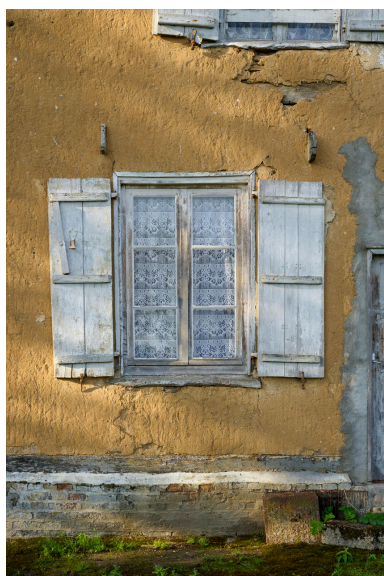
Fenêtre et son chambranle de la maison d'habitation. IVR32_20238000615NUC