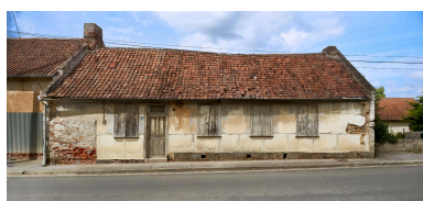
Vue sud de la deuxième maison, depuis la rue. IVR32_20238000620NUCA