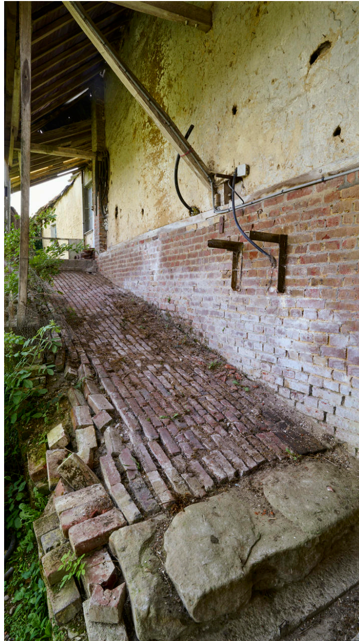
Détail de la rampe d'accès en brique.