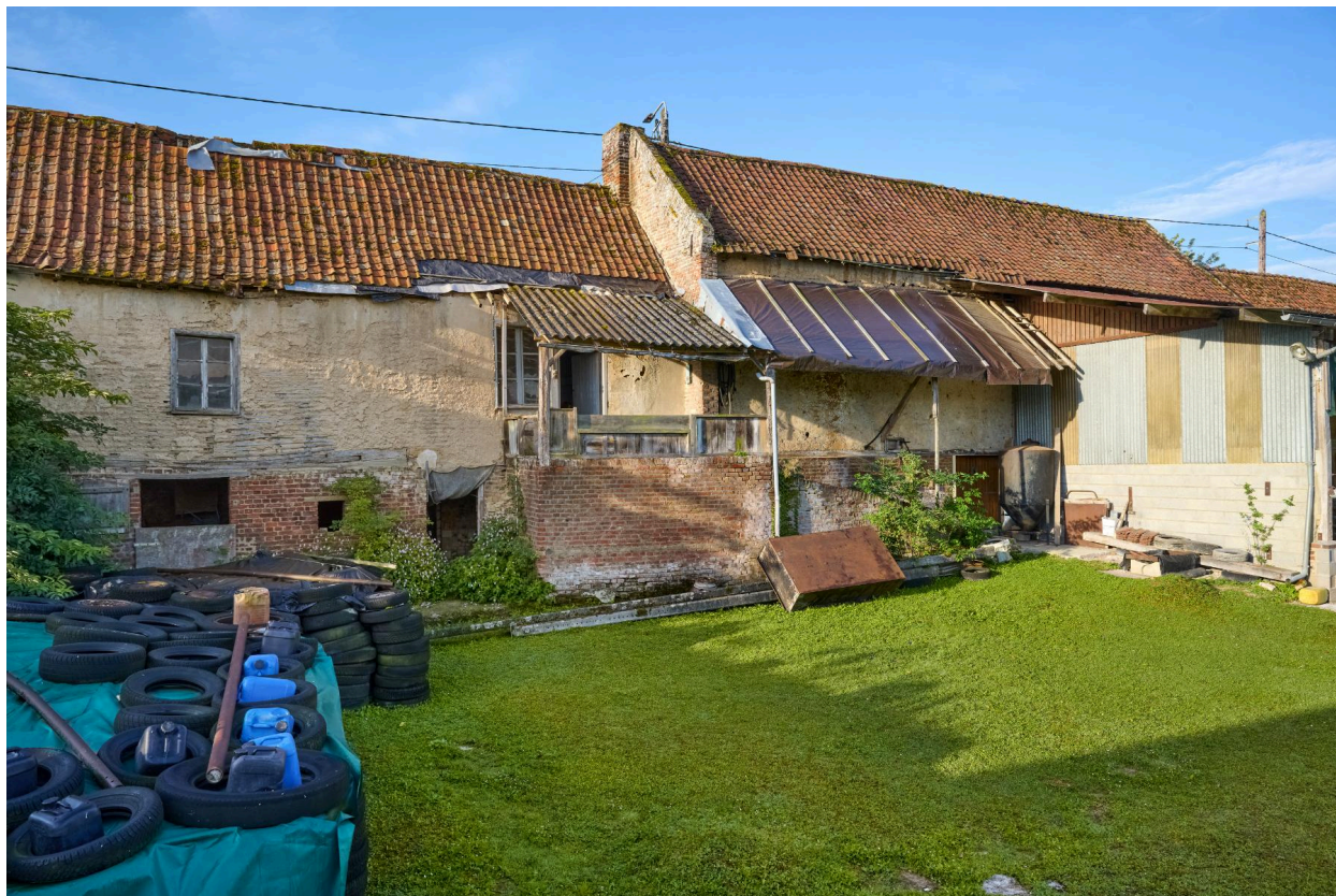
Vue nord de la deuxième maison et d'un bâtiment agricole, depuis la cour.