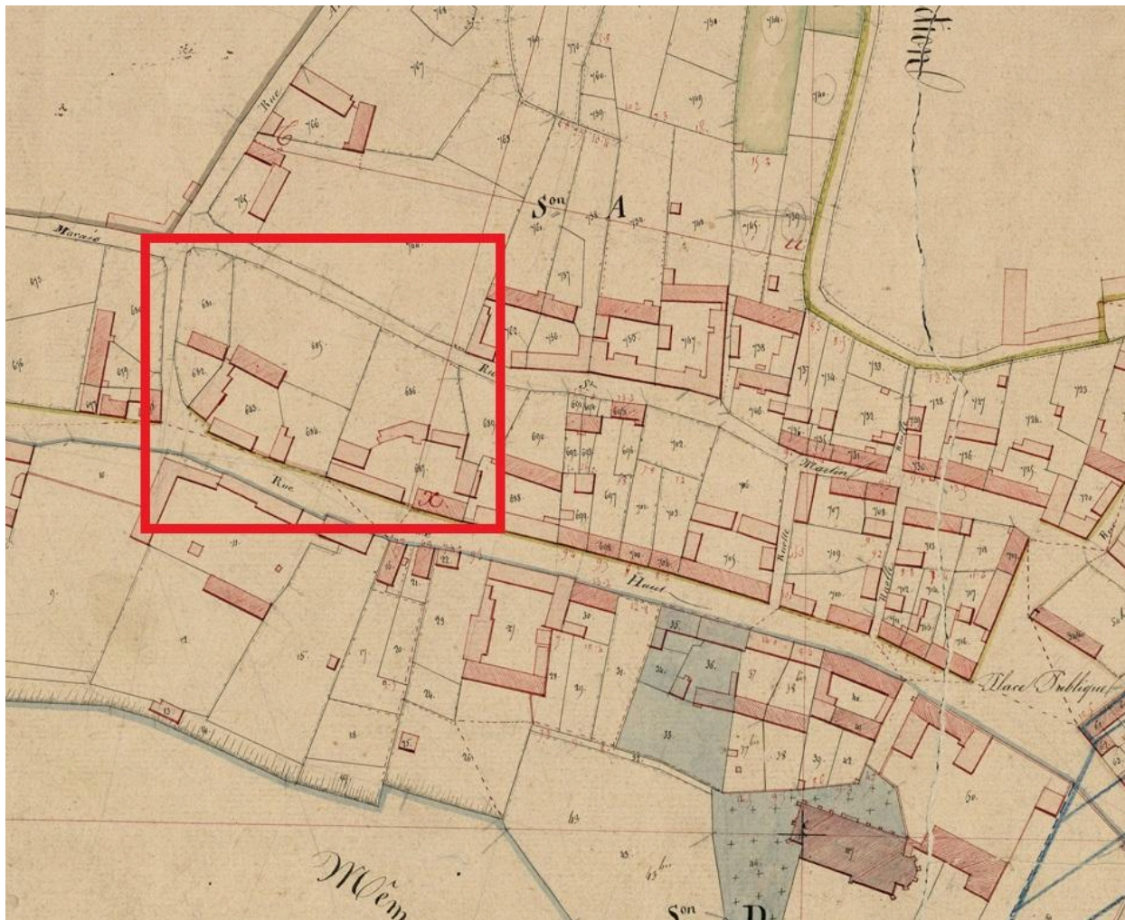
Plan masse des fermes 20-22 rue de Haut. Extrait du plan parcellaire de la commune de Fontaine-sur-Somme dit cadastre napoléonien, section ABD, 1833 (AD Somme ; 3 P 13539).