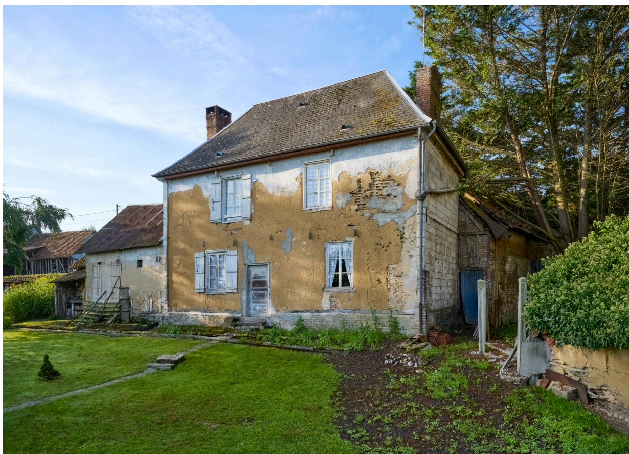
Vue nord de la première maison, depuis le jardin.