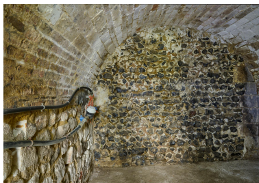
Cave voûtée.