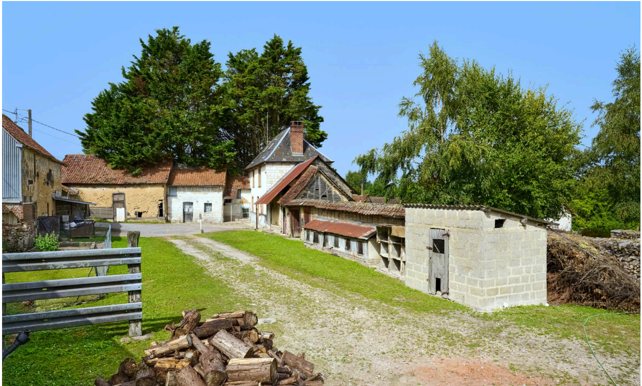
Vue de la cour depuis l'est.