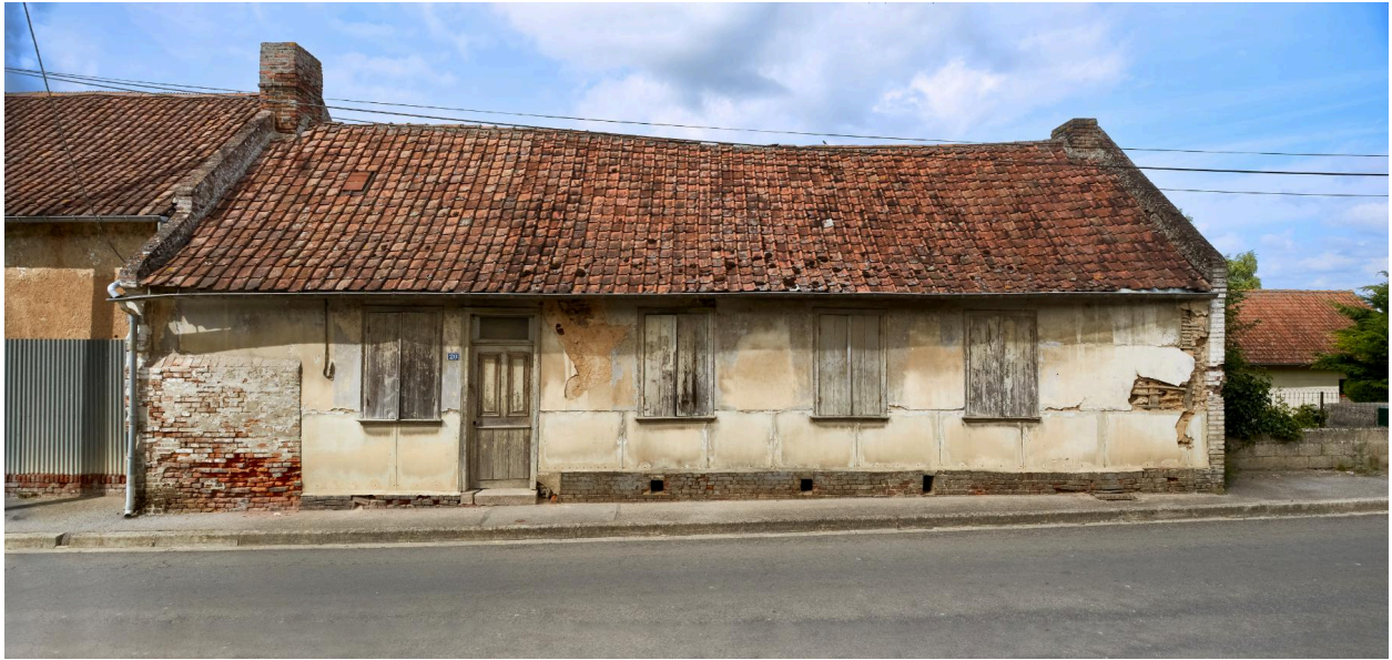
Vue sud de la deuxième maison, depuis la rue.