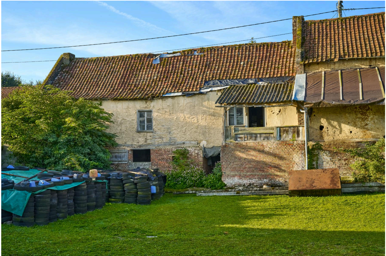
Vue nord de la deuxième maison, depuis la cour.