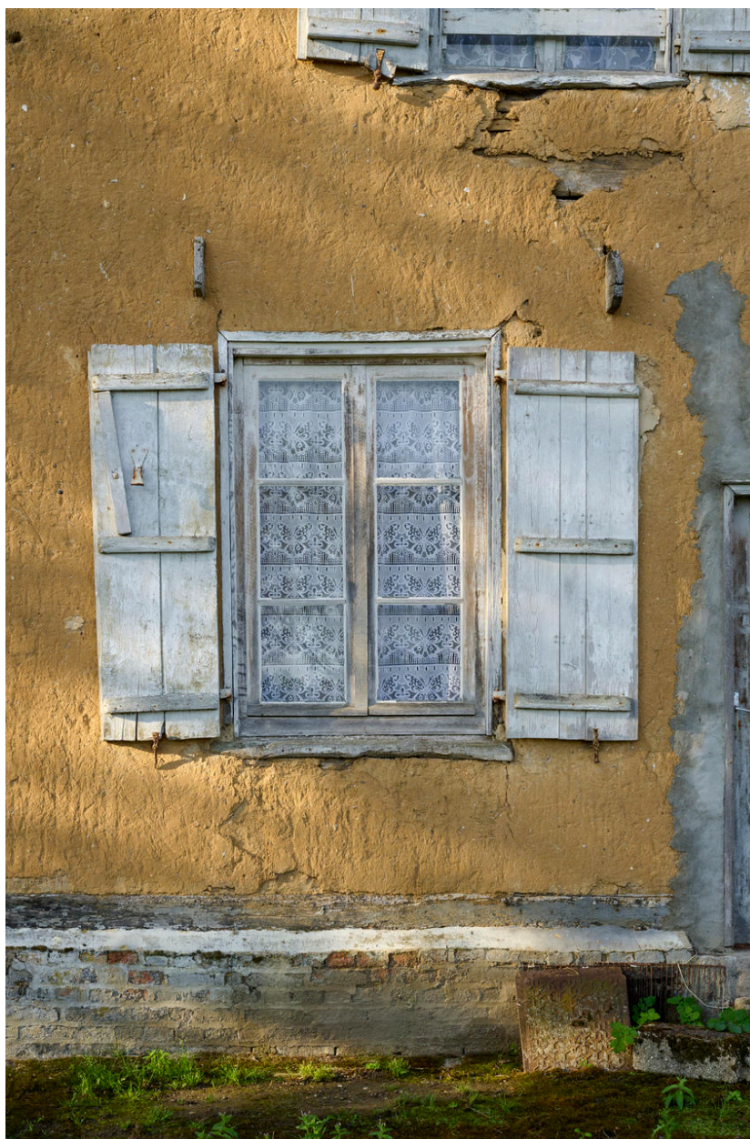
Fenêtre et son chambranle de la maison d'habitation.