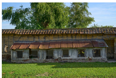
Rangée de poulaillers, depuis le sud. IVR32_20238000610NUCA