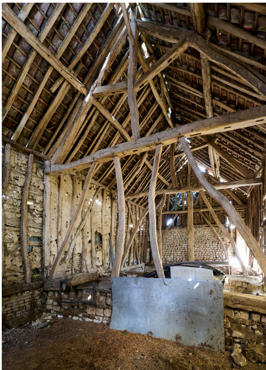
Intérieur d'une grange.