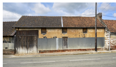
Façade sur rue de la grange et de l'entrée charretière de la seconde ferme.