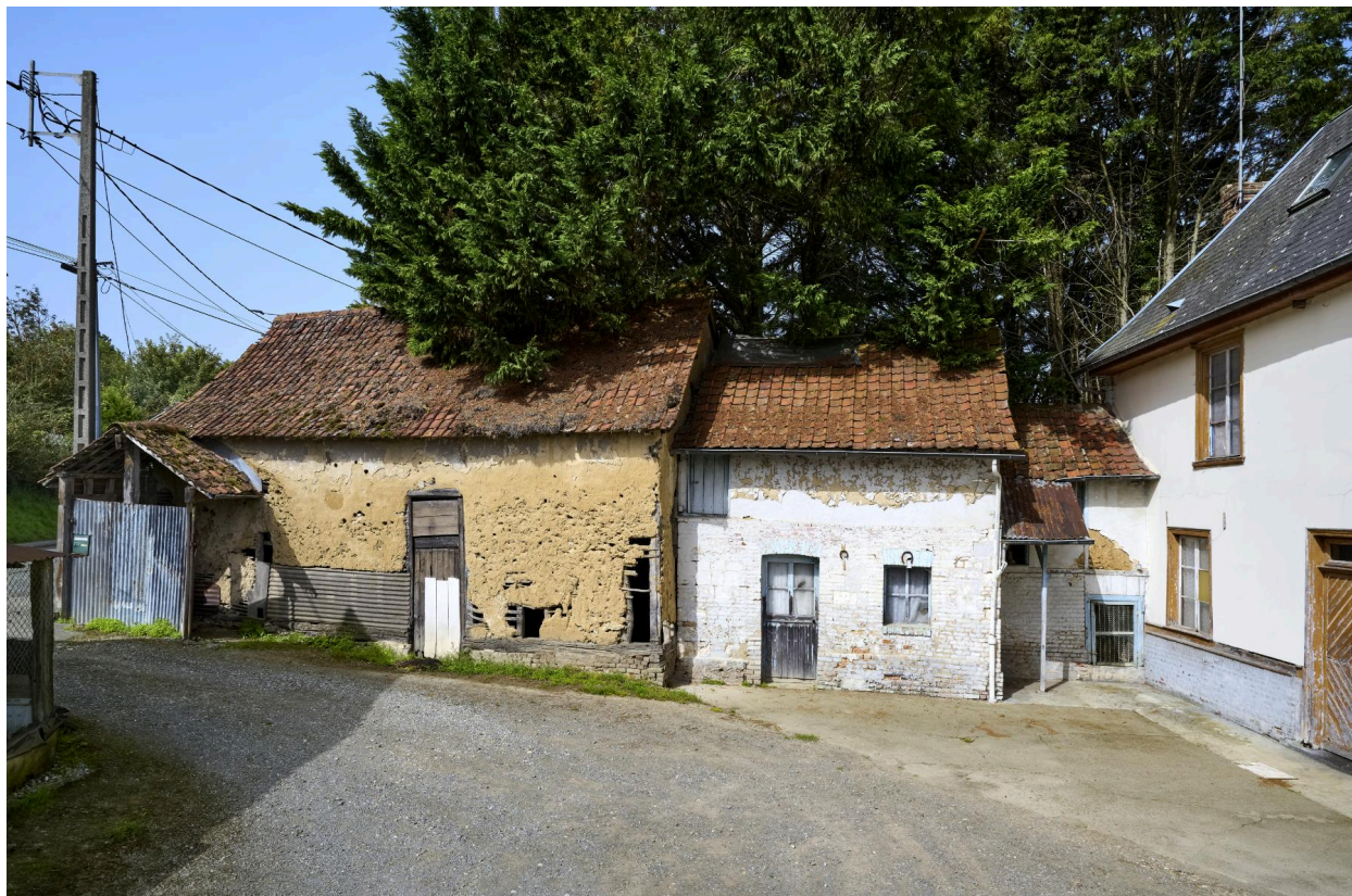
Vue est d'un bâtiment agricole dans le cour, depuis la cour.