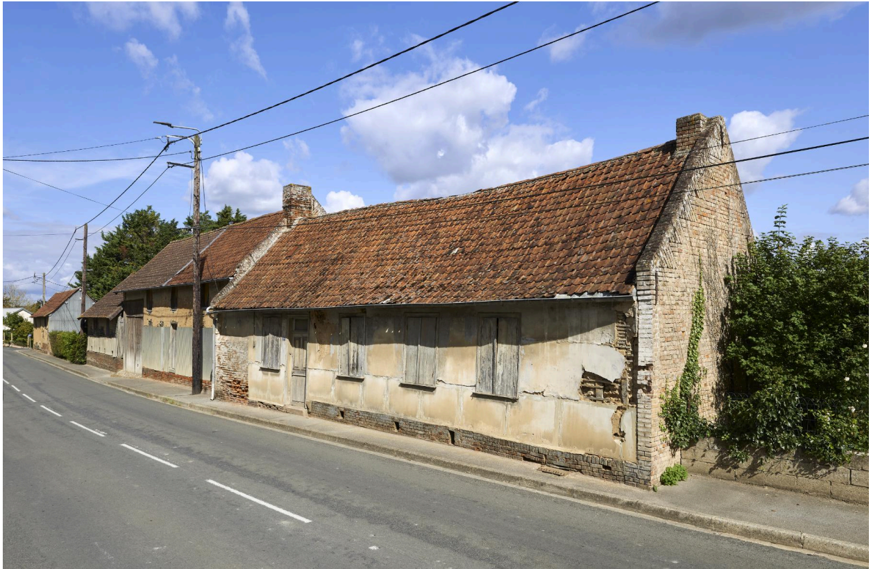
Vue sud-est de la deuxième maison et de son mur pignon, depuis la rue.