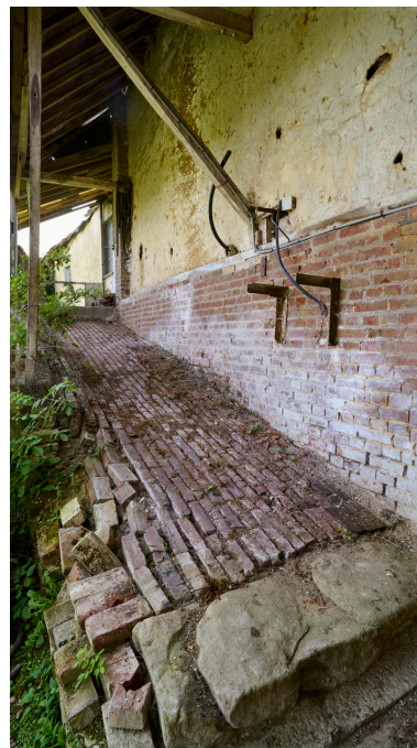
Détail de la rampe d'accès en brique.