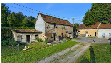
Vue sud-est des bâtiments agricoles, depuis la cour. IVR32_20238000606NUCA