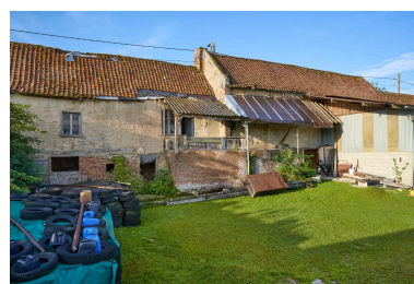
Vue nord de la deuxième maison et d'un bâtiment agricole, depuis la cour.