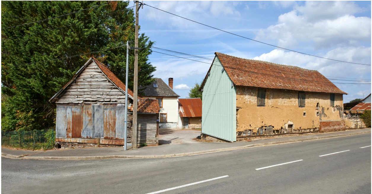
Entrée de la ferme, depuis le sud.