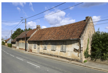
Vue sud-est de la deuxième maison et de son mur pignon, depuis la rue. IVR32_20238000621NUCA