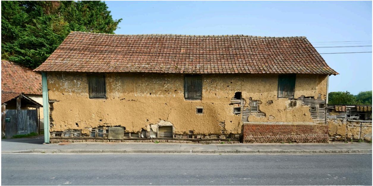
Vue sud d'un bâtiment agricole, depuis la rue.