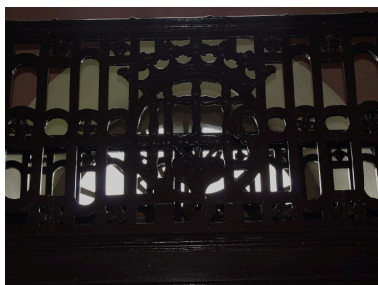
Vue de détail IVR31_20106204477NUCA