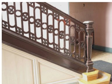
Vue de détail IVR31_20106204475NUCA