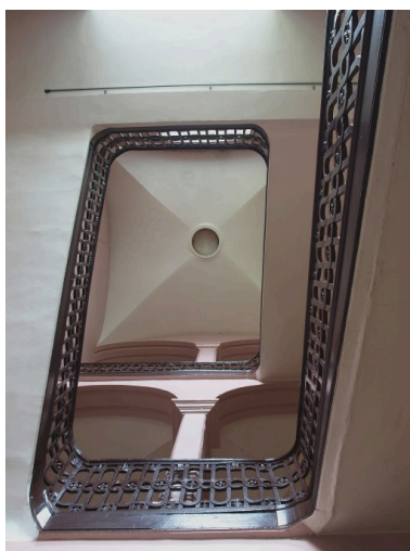
Vue générale IVR31_20106204473NUCA