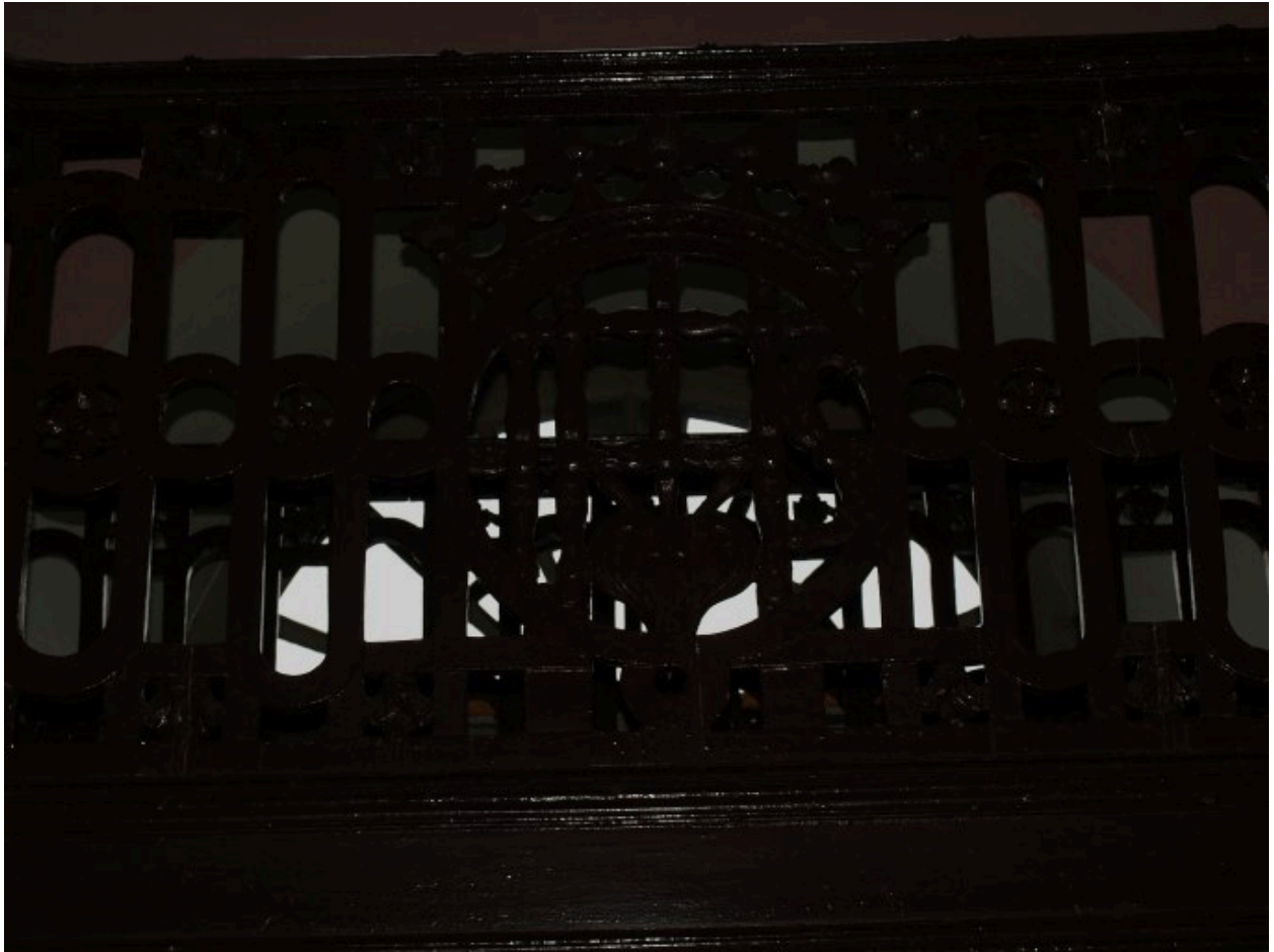
Vue de détail : IHS