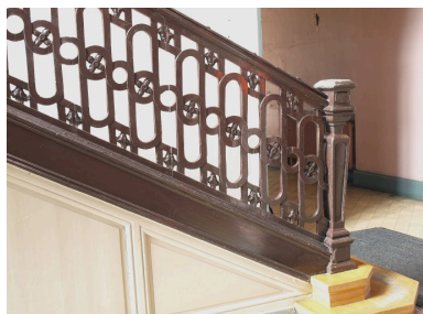
Vue de détail IVR31_20106204475NUCA