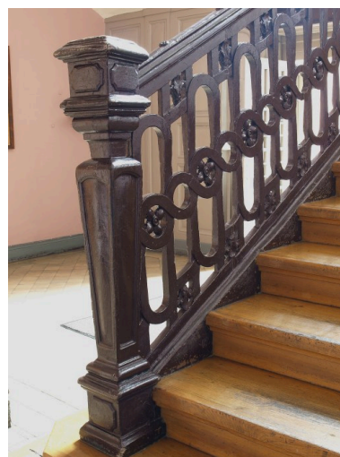
Vue de détail IVR31_20106204474NUCA