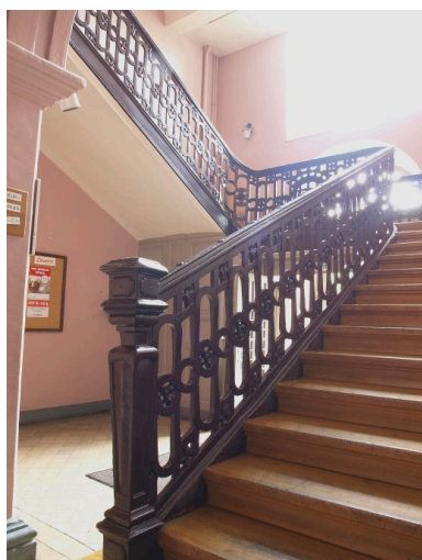
Vue générale IVR31_20106204472NUCA