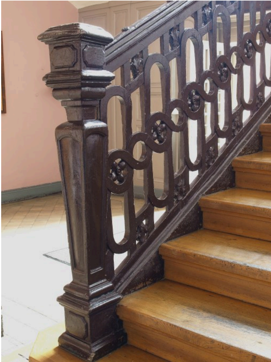
Vue de détail