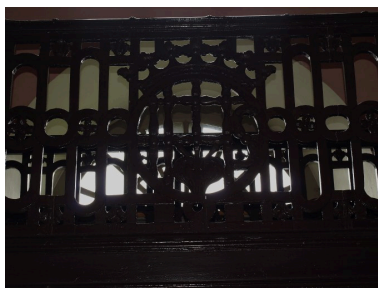
Vue de détail IVR31_20106204477NUCA