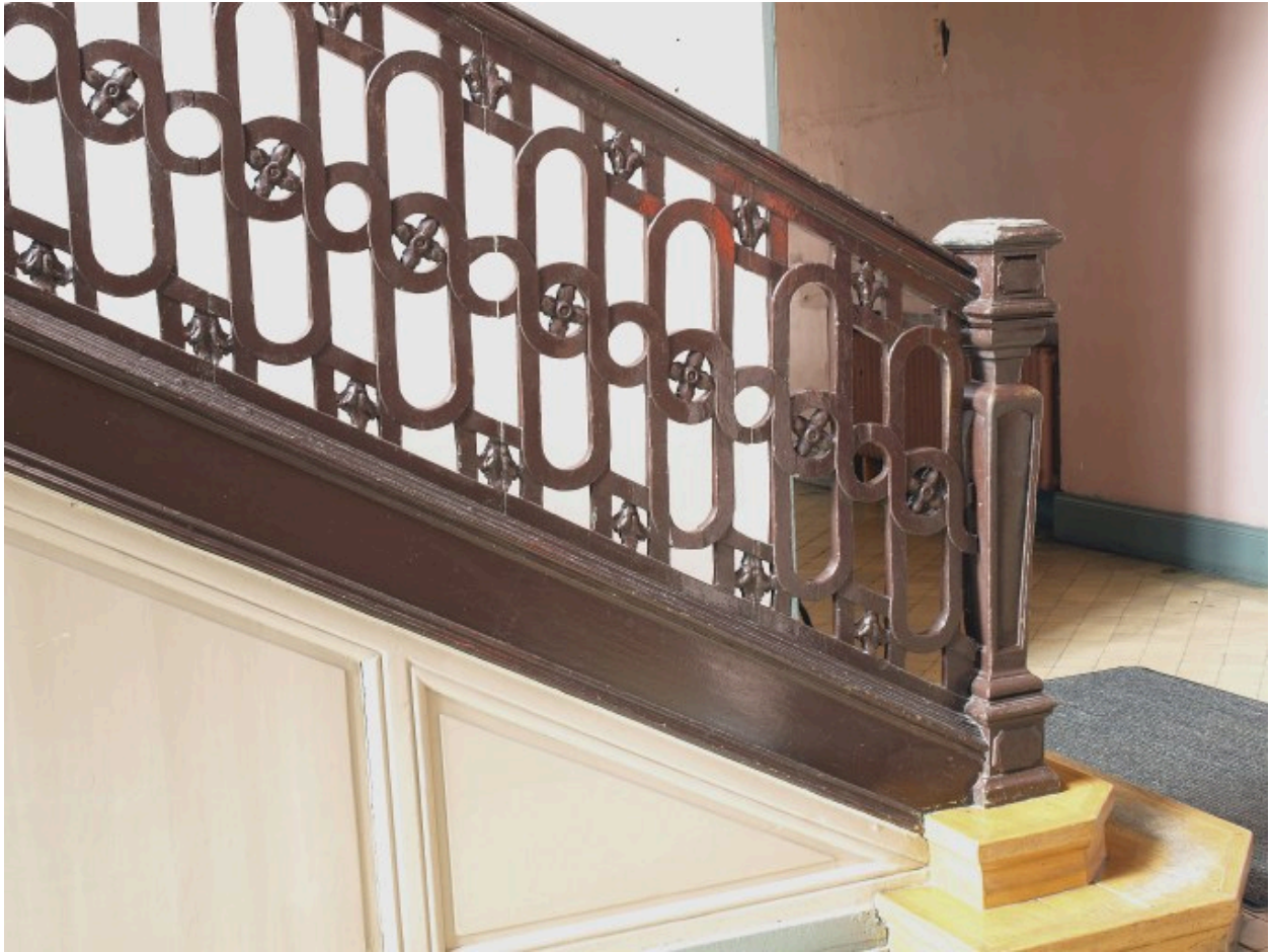
Vue de détail