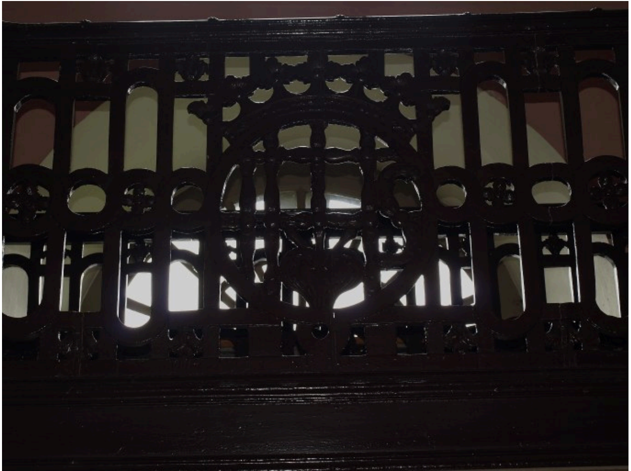
Vue de détail