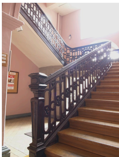
Vue générale IVR31_20106204472NUCA