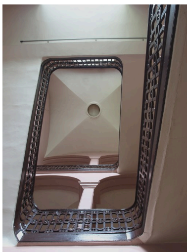
Vue générale IVR31_20106204473NUCA