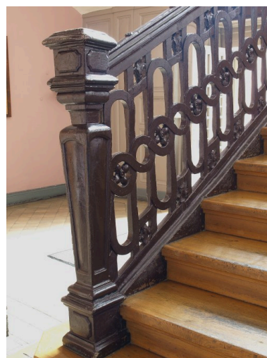
Vue de détail IVR31_20106204474NUCA