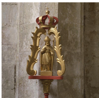
Vue de la partie supérieure du bâton de procession de saint Aubin. IVR22_20020200318XA