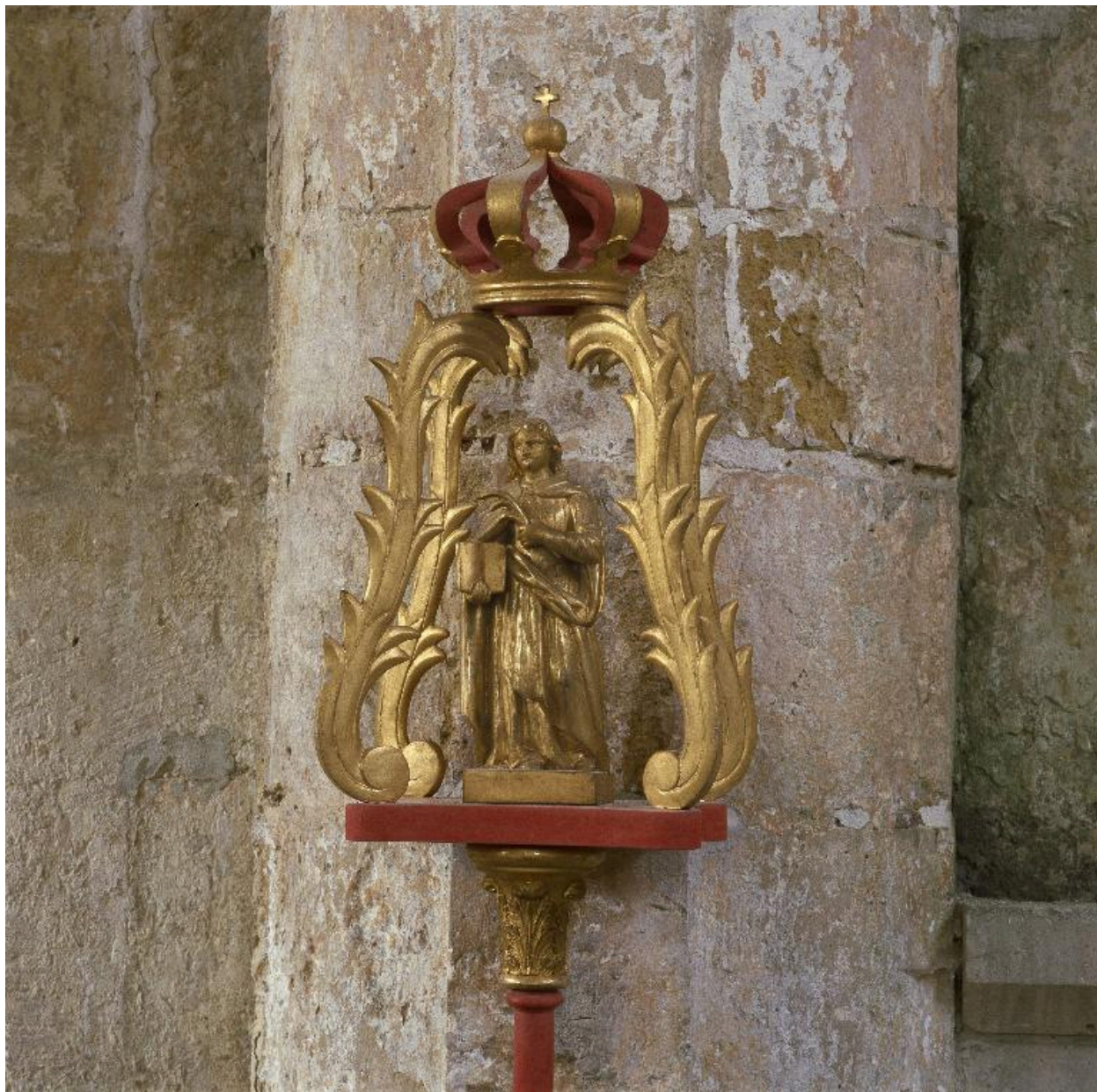
Vue de la partie supérieure du bâton de procession de sainte Catherine.