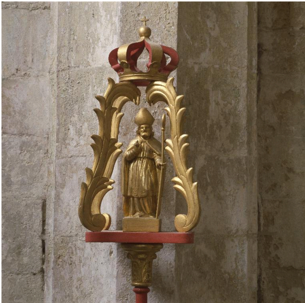
Vue de la partie supérieure du bâton de procession de saint Aubin.