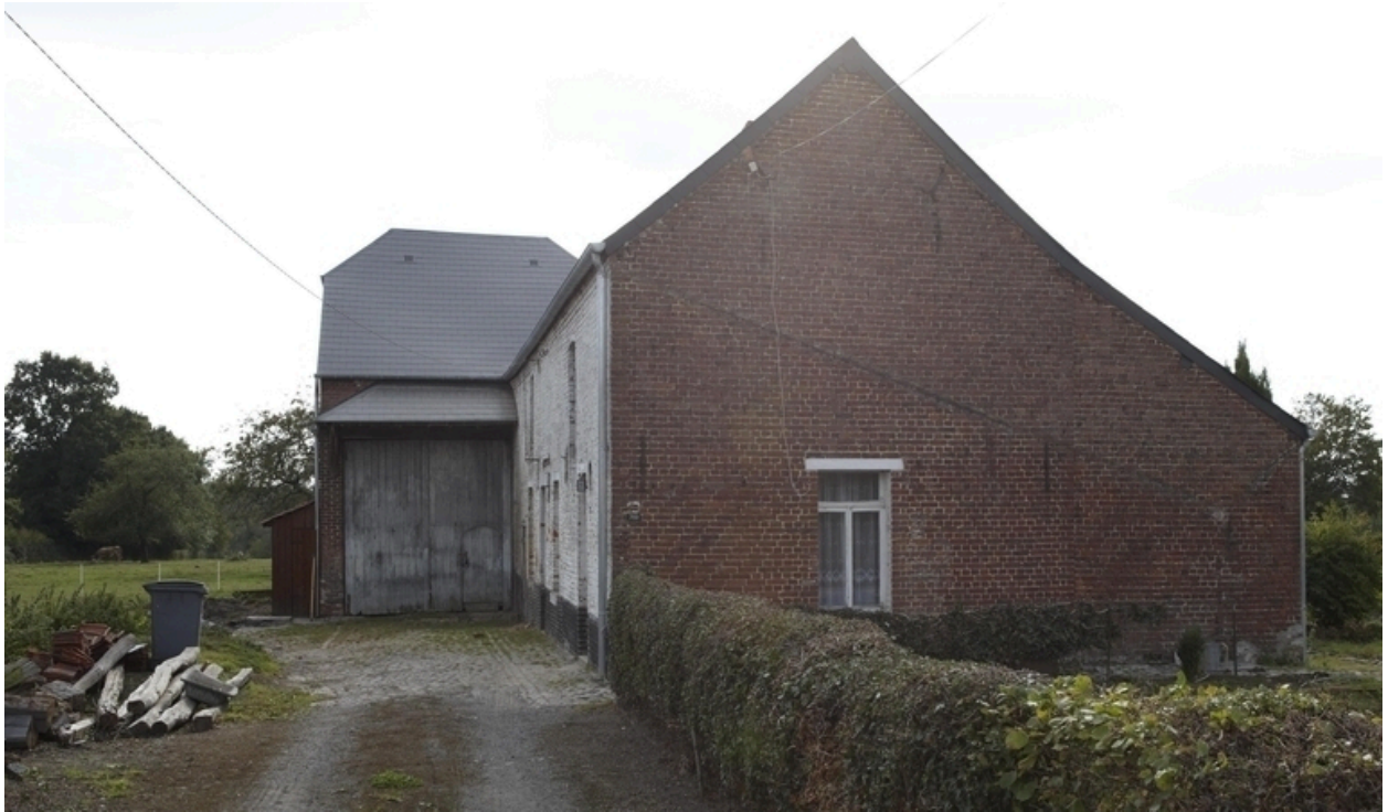
Vue de l'élévation est et de la grange située au sud.