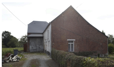
Vue de l'élévation est et de la grange située au sud.