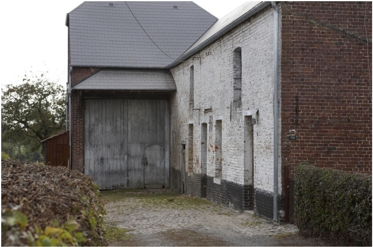
Détail de l'élévation est (le logis et les étables) et de la grange située au sud.