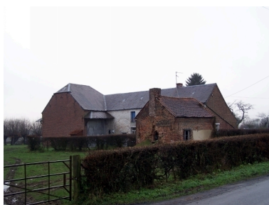
Vue générale en 2008. IVR31_20085900667NUCA