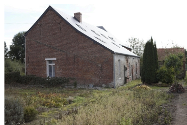
Vue du pignon et du revers du logis.