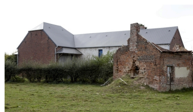
Vue générale en 2009.