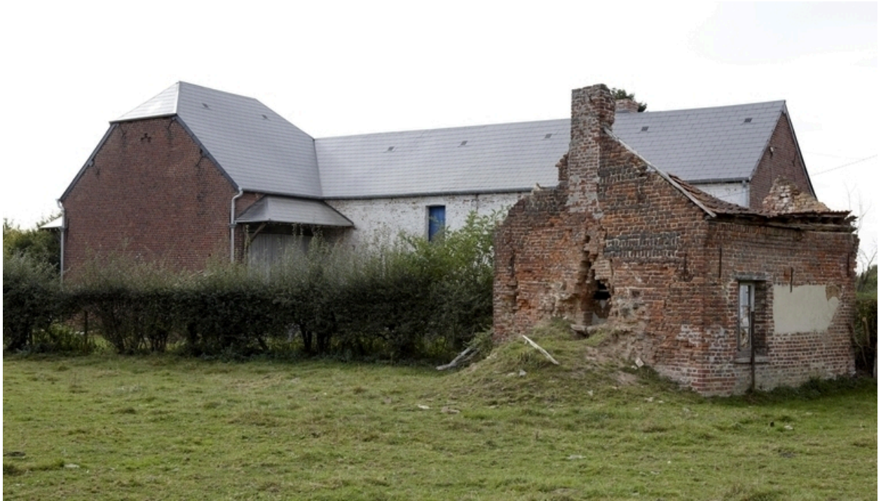
Vue générale en 2009.