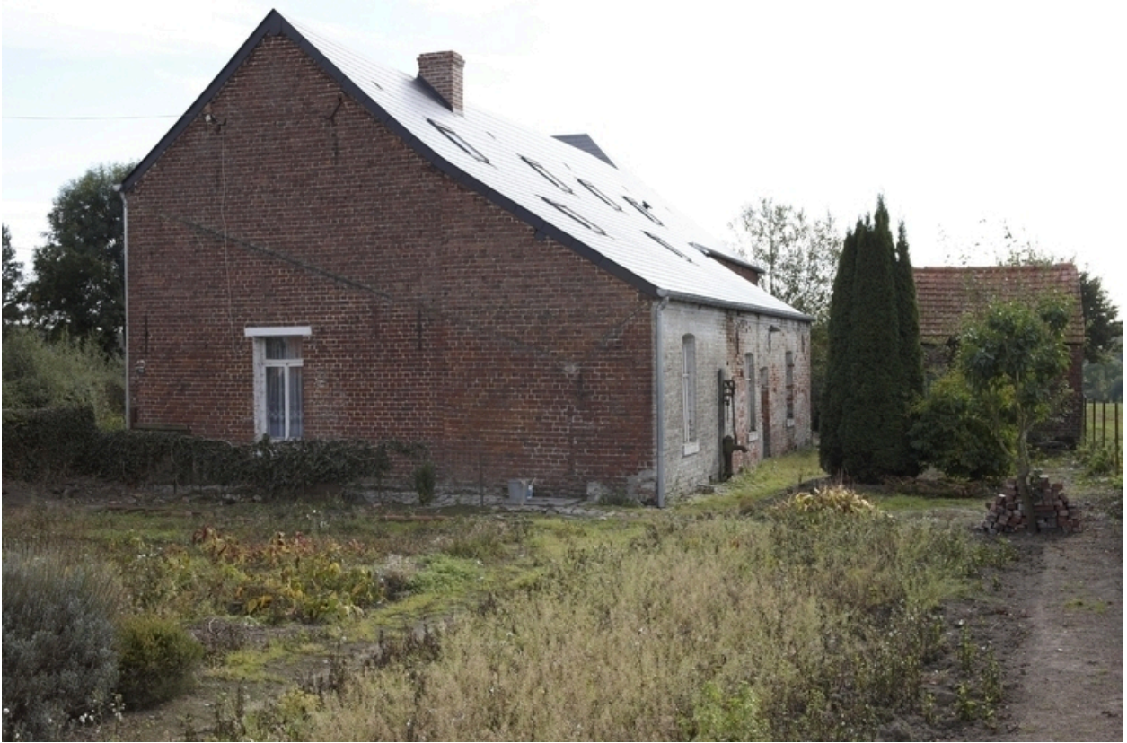
Vue du pignon et du revers du logis.