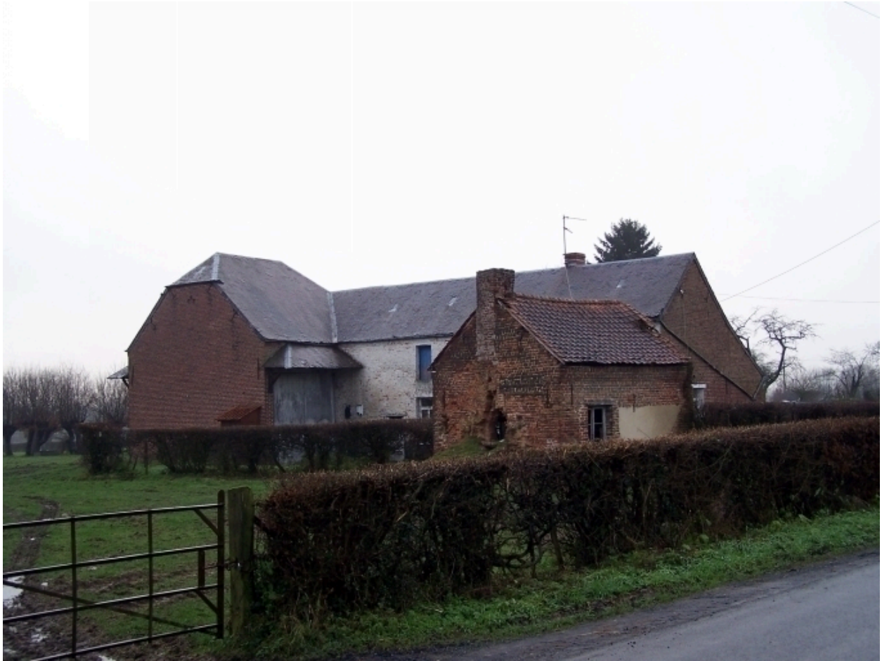
Vue générale en 2008.