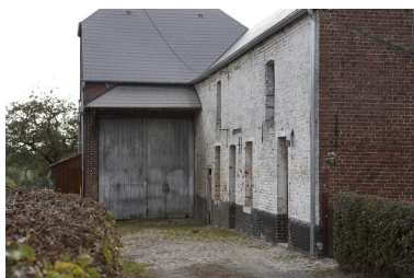
Détail de l'élévation est (le logis et les étables) et de la grange située au sud. IVR31_20095903243NUCA