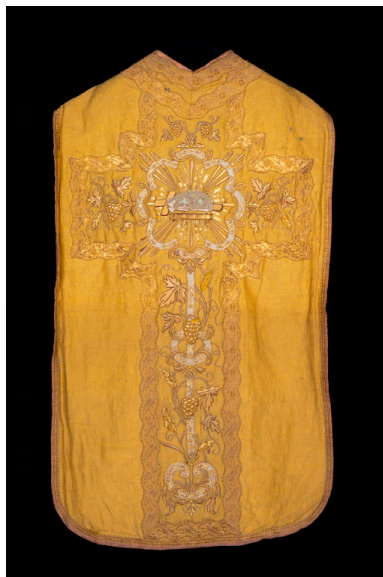
Dos d'une chasuble en drap d'or avec broderies en fils d'or et d'argent (19e siècle).

IVR22_19988001683XA