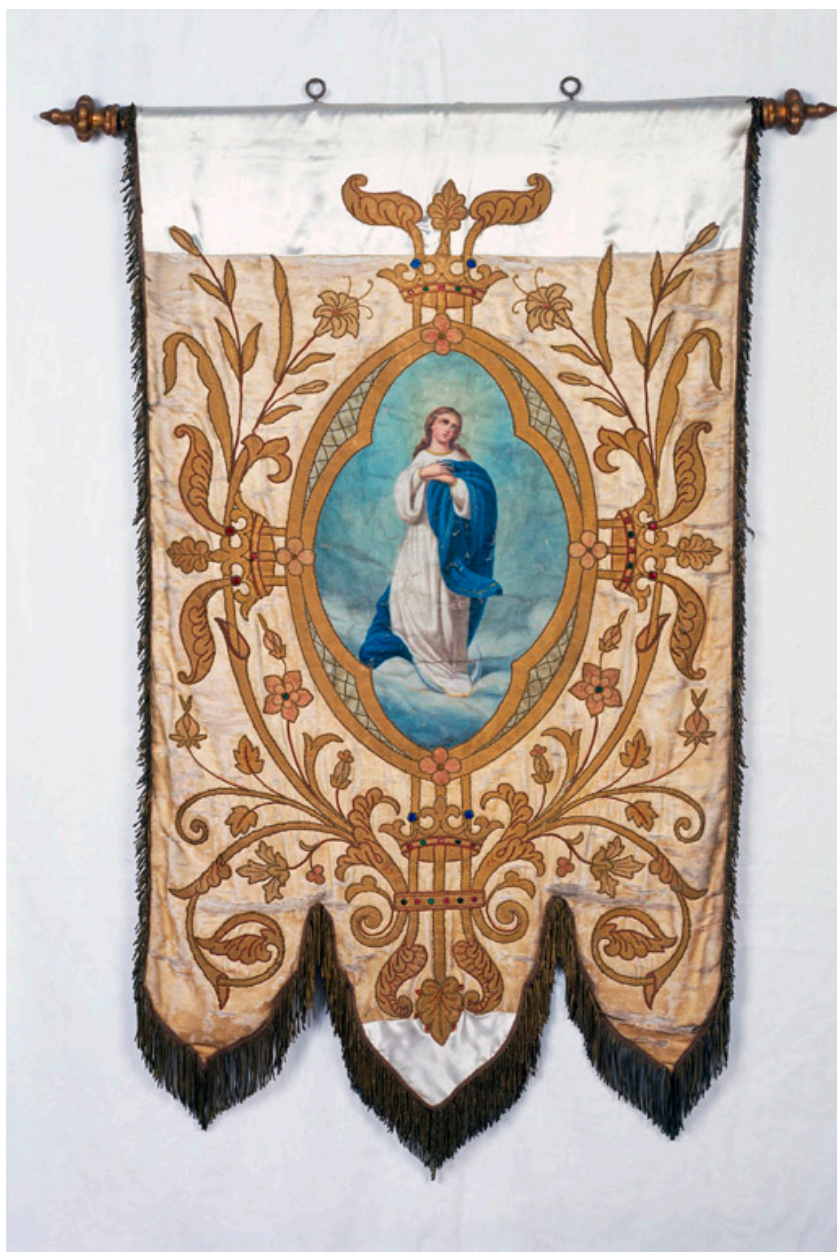
Bannière de procession : Immaculée Conception.