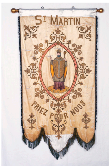
Bannière de procession : saint Martin, patron de la paroisse.