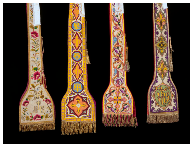
Ensemble de quatre étoles pastorales.

IVR22_19988001683XA