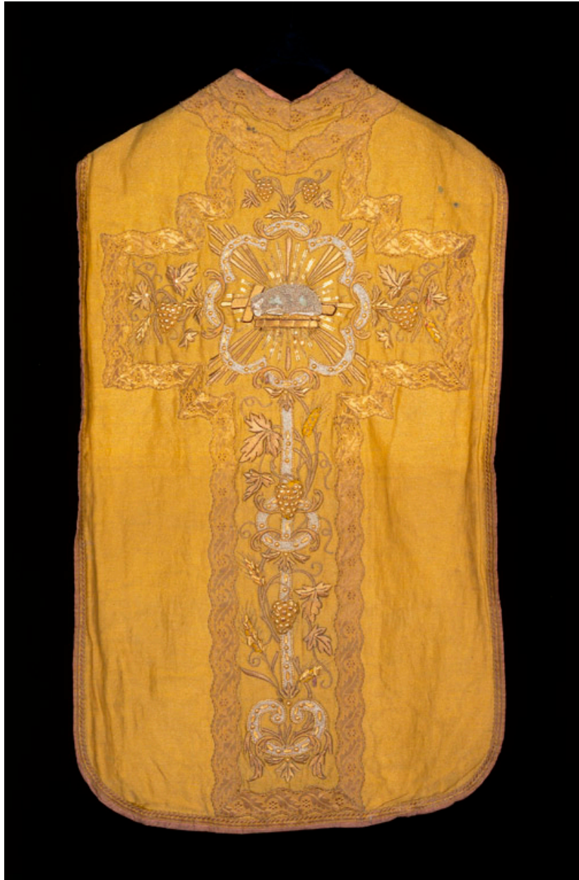
Dos d'une chasuble en drap d'or avec broderies en fils d'or et d'argent (19e siècle).