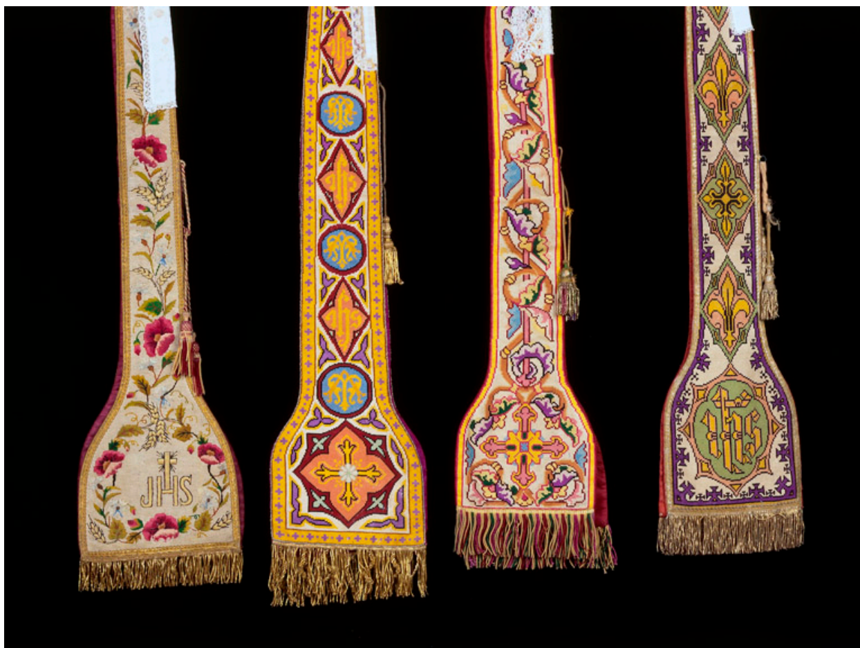
Ensemble de quatre étoles pastorales.