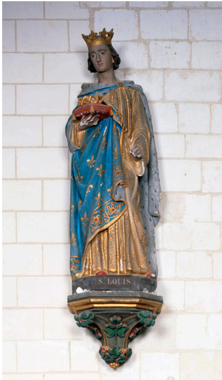
Statue en plâtre polychrome : saint Louis.