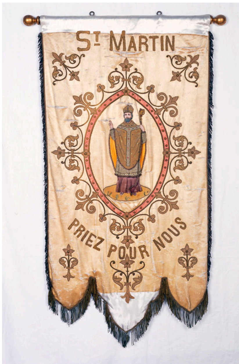
Bannière de procession : saint Martin, patron de la paroisse.