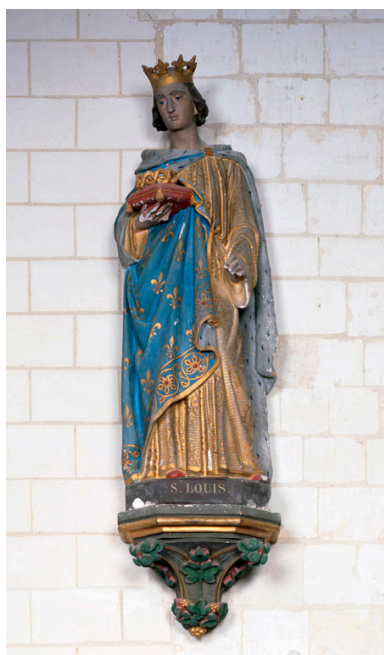
Statue en plâtre polychrome : saint Louis. IVR22_19988001678XA