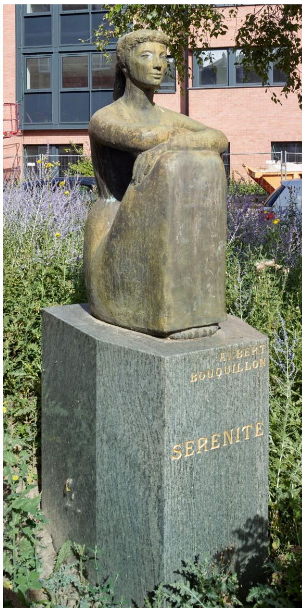
Sérénité, bronze d'Albert Bouquillon. Vue du profil droit, avec le bâtiment du lycée à l'arrière plan.