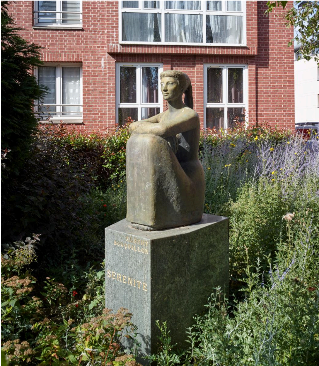
Sérénité, bronze d'Albert Bouquillon. Vue du profil gauche.