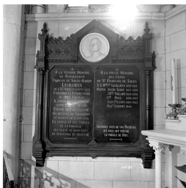
Vue d'ensemble. IVR31_19956200147X