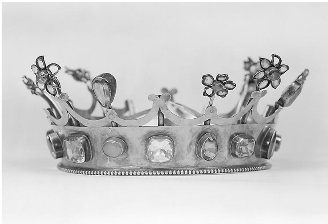
Couronne de l'Enfant Jésus, vue générale.