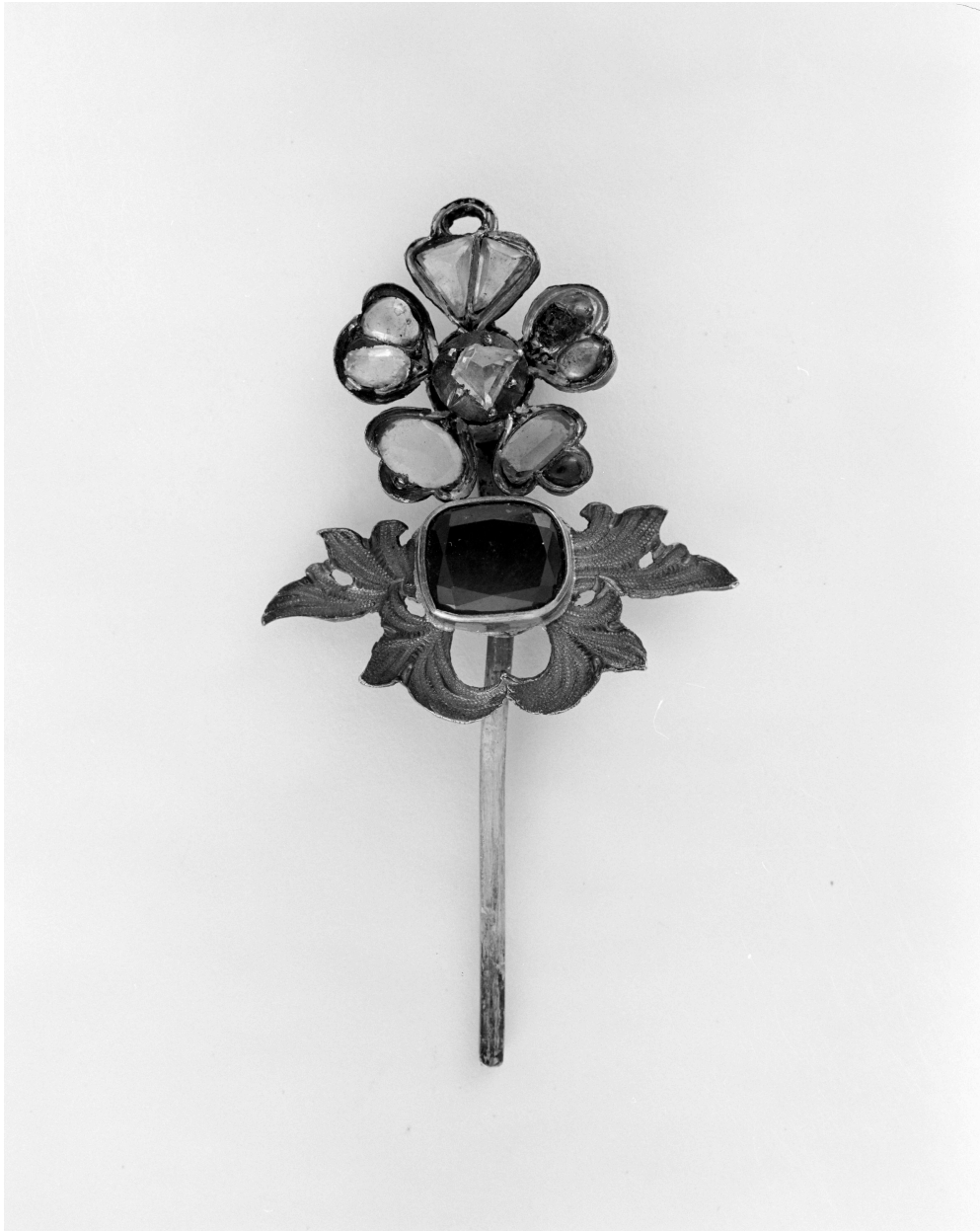
Couronne de Notre Dame de Boulogne, fleuron.