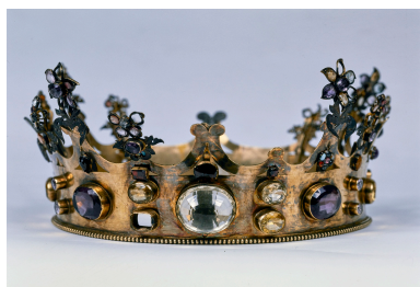
Couronne de Notre Dame de Boulogne, vue générale. IVR31_19876202240XA