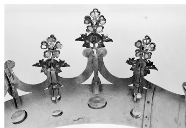
Couronne de Notre Dame de Boulogne, vue intérieure. IVR31_19876202159X