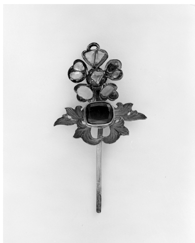
Couronne de Notre Dame de Boulogne, fleuron. IVR31_19876202154X