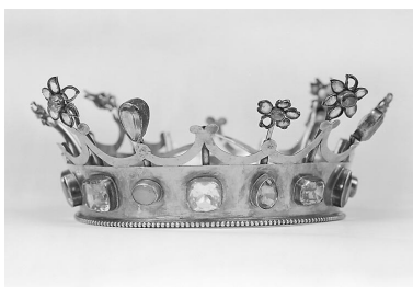
Couronne de l'Enfant Jésus, vue générale.