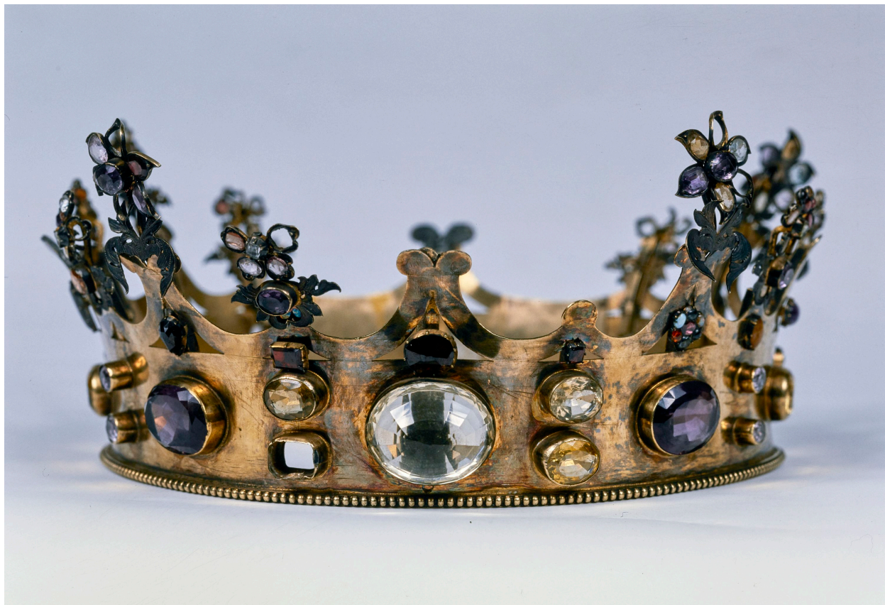
Couronne de Notre Dame de Boulogne, vue générale.