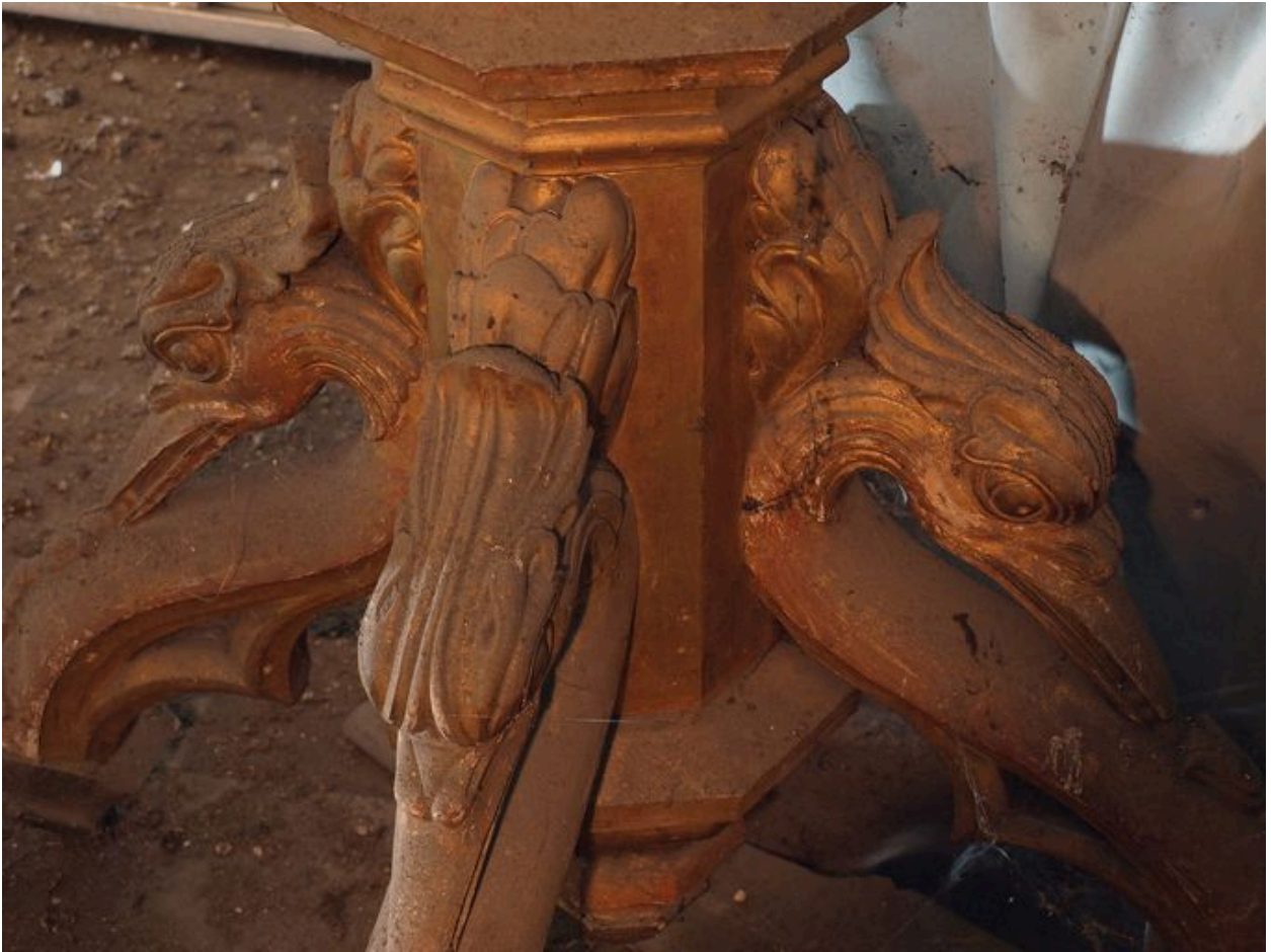
Vue de détail, pied