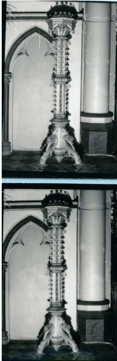
Vue générale (phot. Wintrebert, 1978, fonds AOA62)