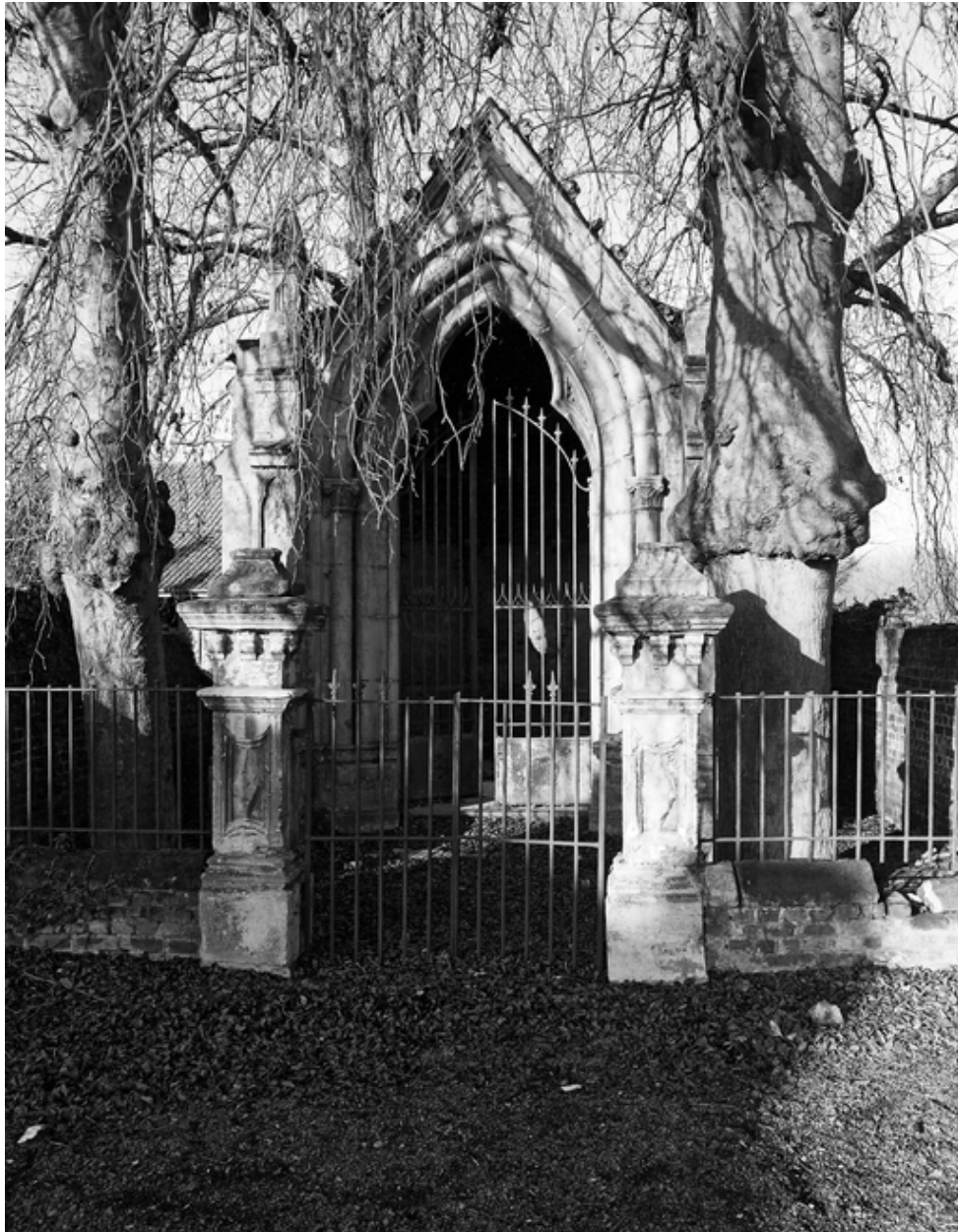
Chapelle Saint-Roch, rue des Censes.