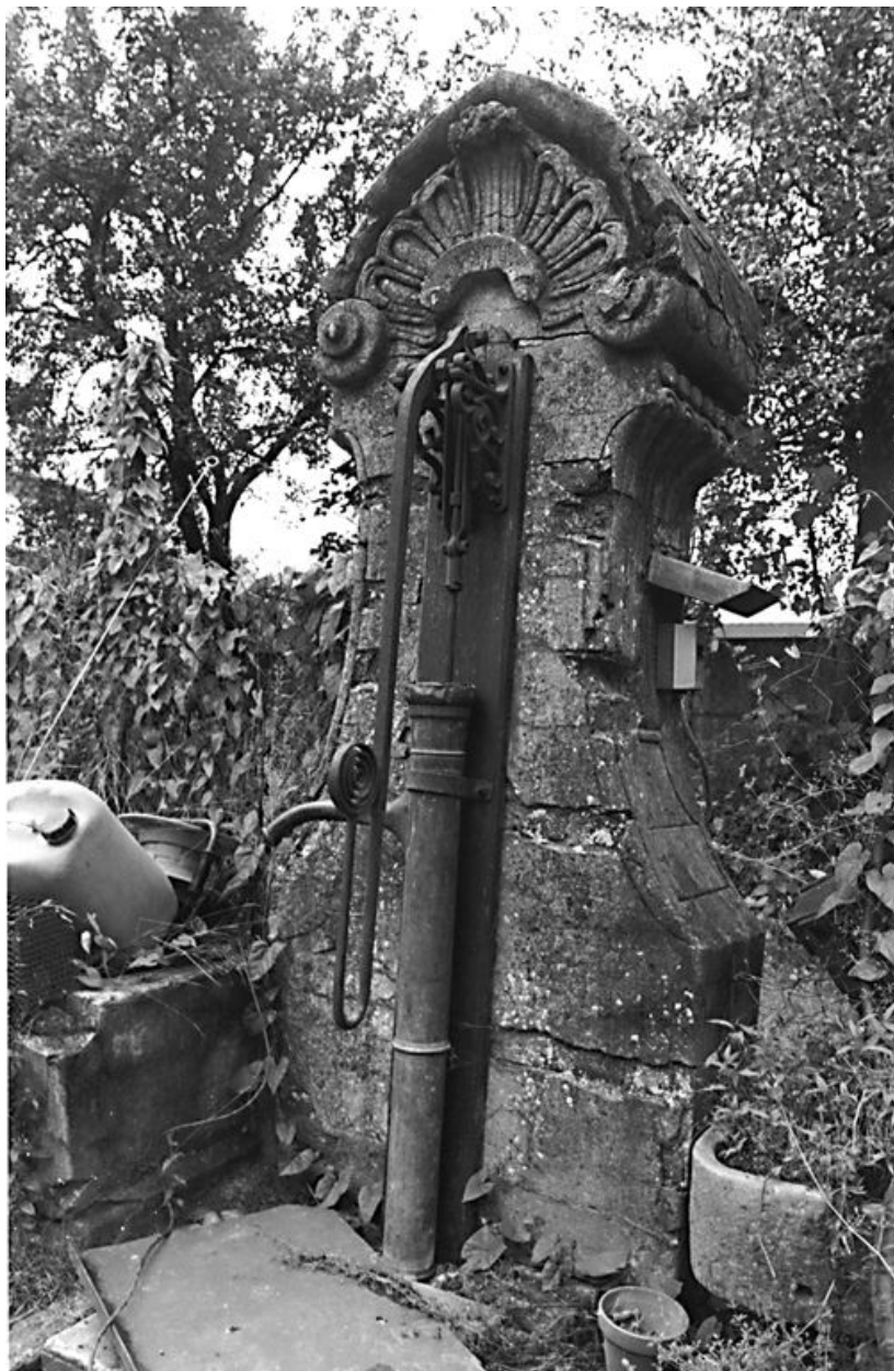
Vue du puits de style Art Nouveau.