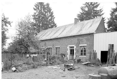
Vue du logis en brique. IVR22_19980202464Z