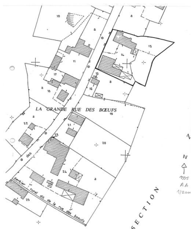
Plan de situation. Extrait du plan cadastral de 1995, section AA. IVR22_20080290097NUCA