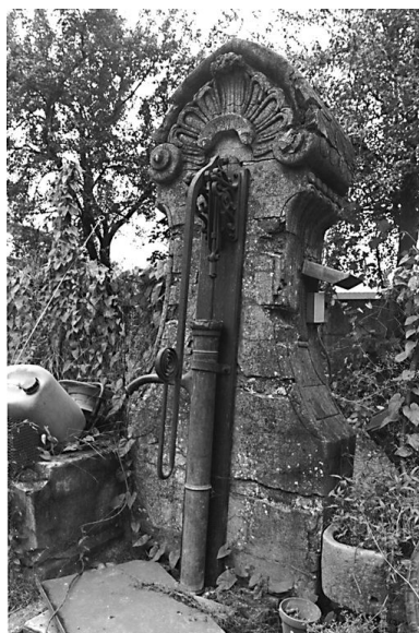
Vue du puits de style Art Nouveau. IVR22_19980202534Z