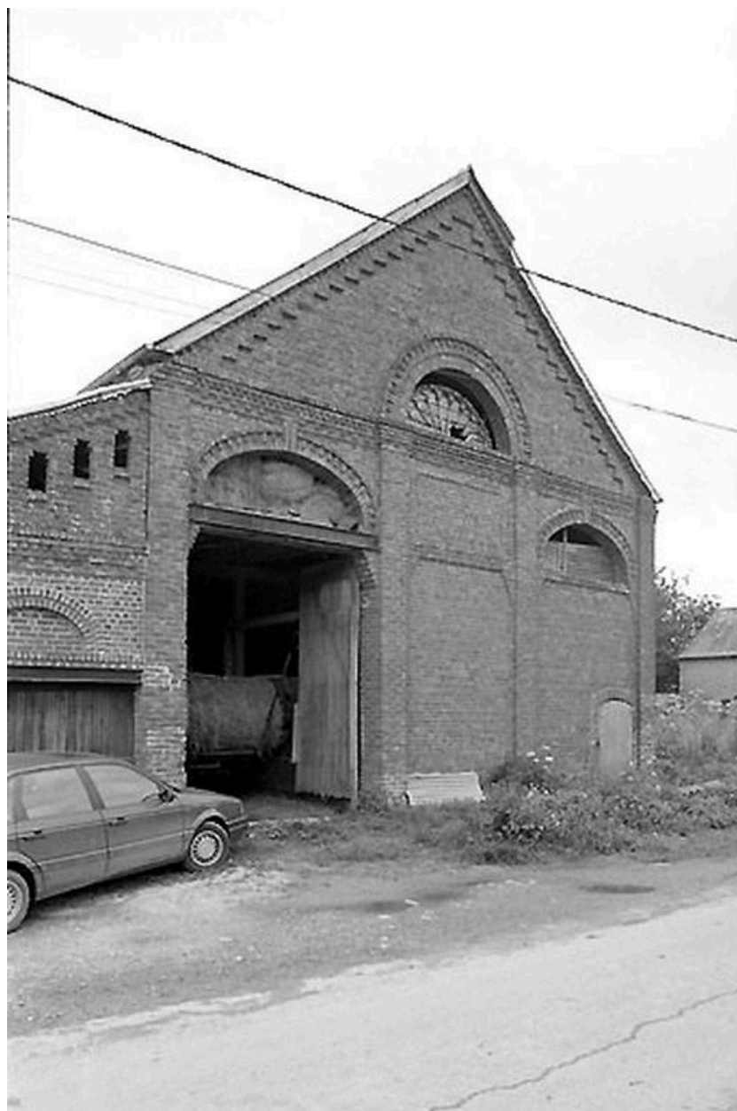
Façade occidentale de la grange.