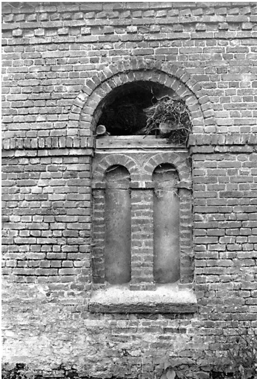
Elévation nord de la grange : détail d'un motif architectural antiquisant.