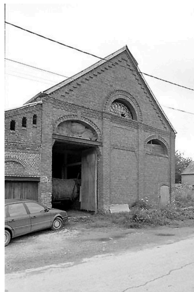
Façade occidentale de la grange.