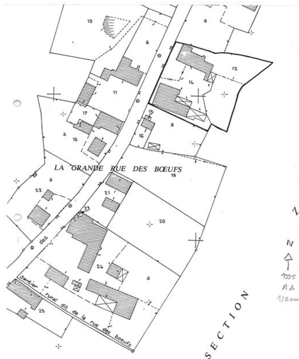
Plan de situation. Extrait du plan cadastral de 1995, section AA.