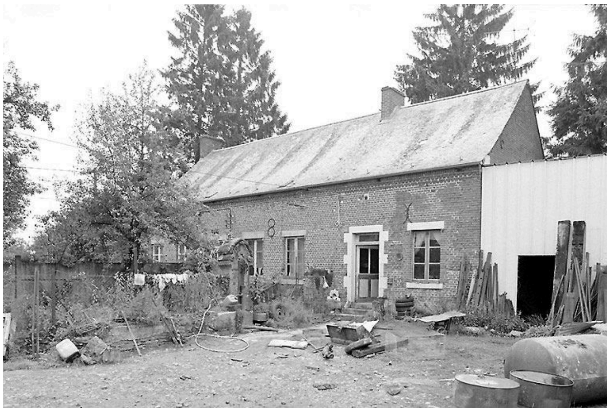
Vue du logis en brique.