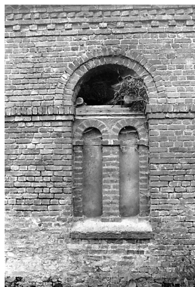
Elévation nord de la grange : détail d'un motif architectural antiquisant. IVR22_19980202465Z