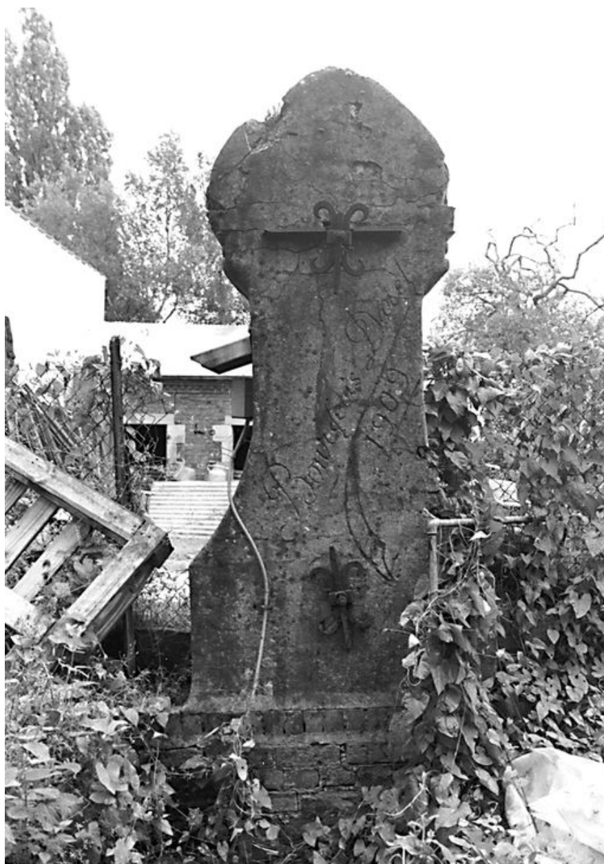
Puits de style Art Nouveau : élévation postérieure avec la signature 'Daret-Bourgeois 1909'.