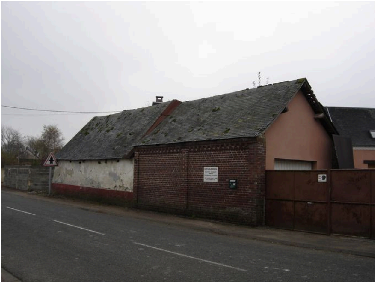
Vue des bâtiments sur rue (grange, étables).