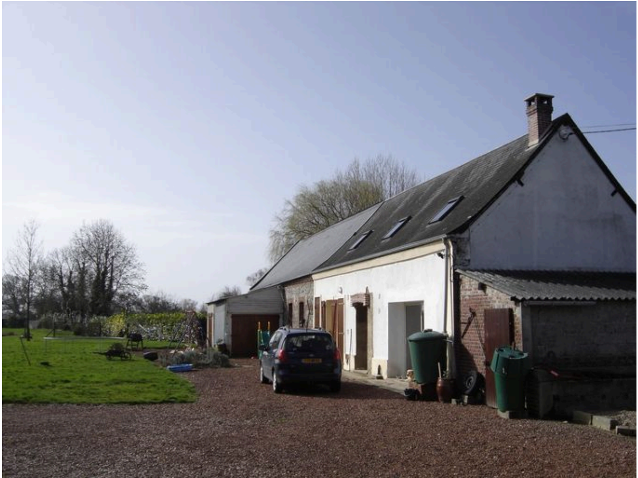
Vue postérieure du logis.