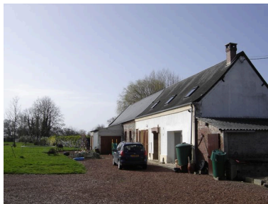
Vue postérieure du logis.