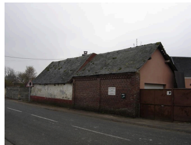
Vue des bâtiments sur rue (grange, étables). IVR22_20068005856NUCA