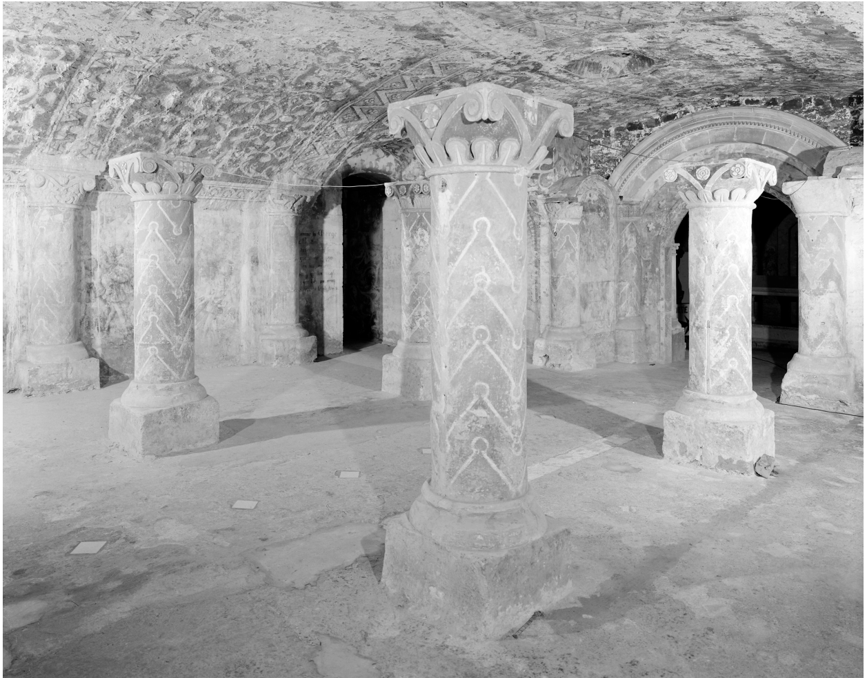
Vue d'ensemble prise vers le sud ouest.