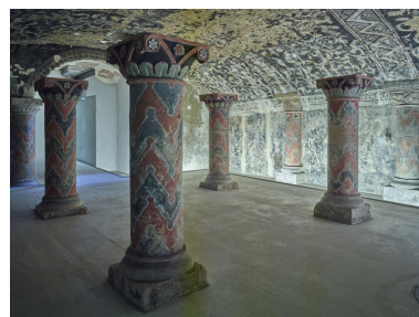
Vue générale de la crypte après restauration.