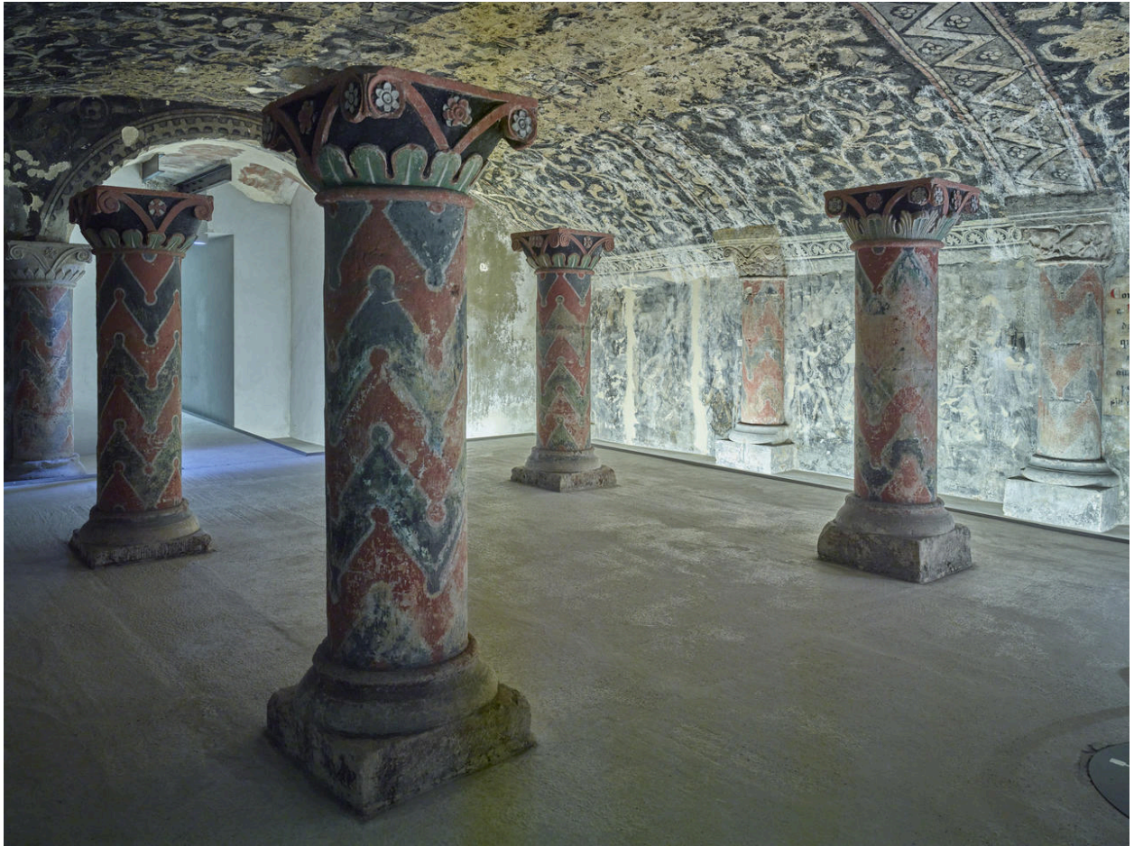
Vue générale de la crypte après restauration.