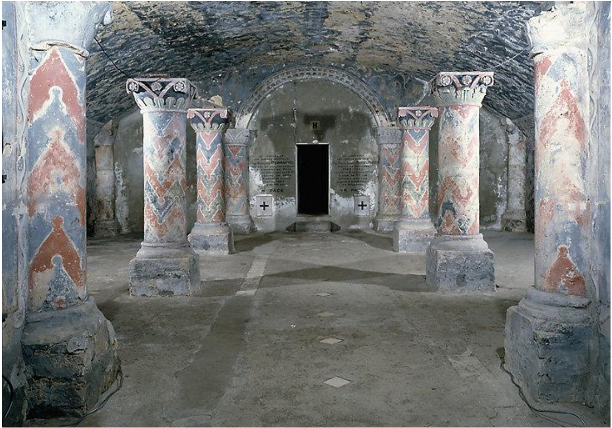
Vue générale n° 1, vers l'est.