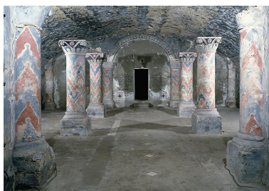
Vue générale n° 1, vers l'est. IVR31_19876202077XA