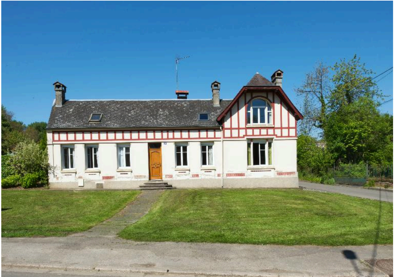
Vue d'ensemble de face.