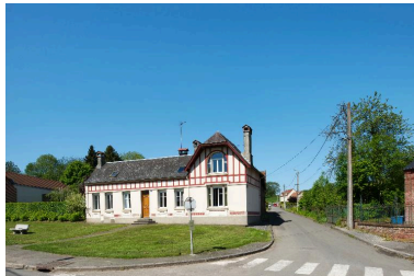
Vue d'ensemble de situation. IVR22_20138000184NUC2A