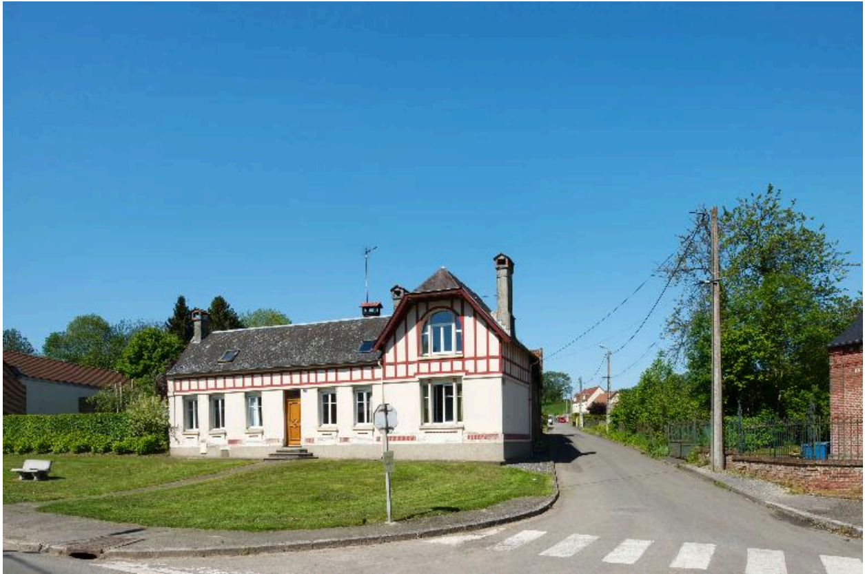
Vue d'ensemble de situation.