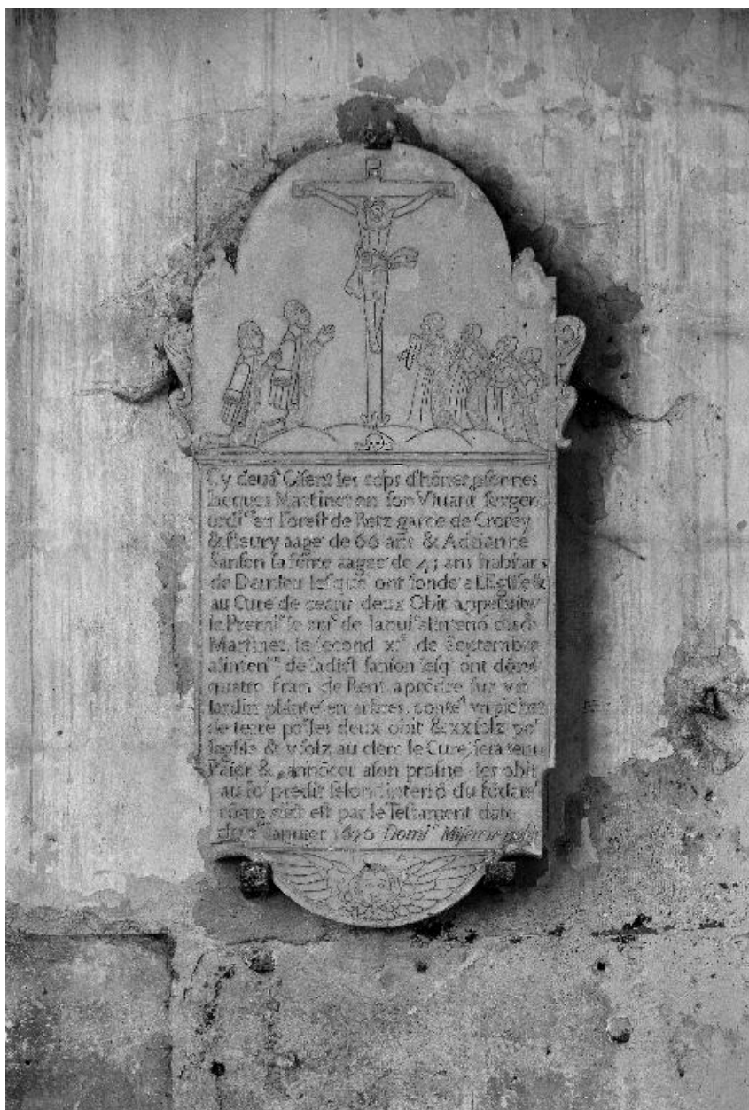
Vue générale de la plaque funéraire.