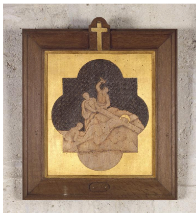
Vue de la 11e station.