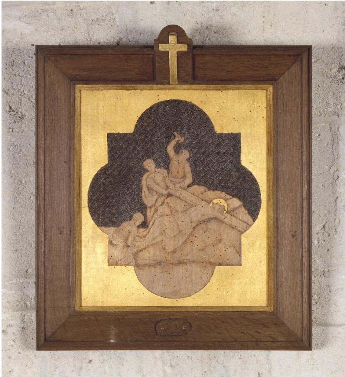
Vue de la 11e station.