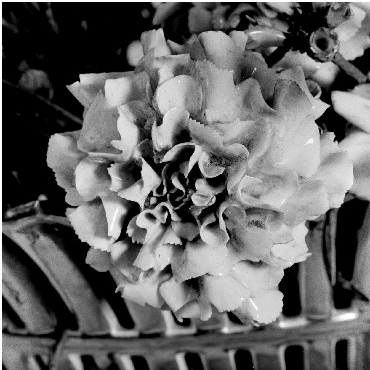
Détail d'une des fleurs du bouquet.