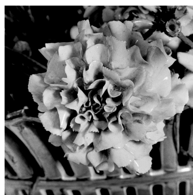
Détail d'une des fleurs du bouquet. IVR22_19966003491X