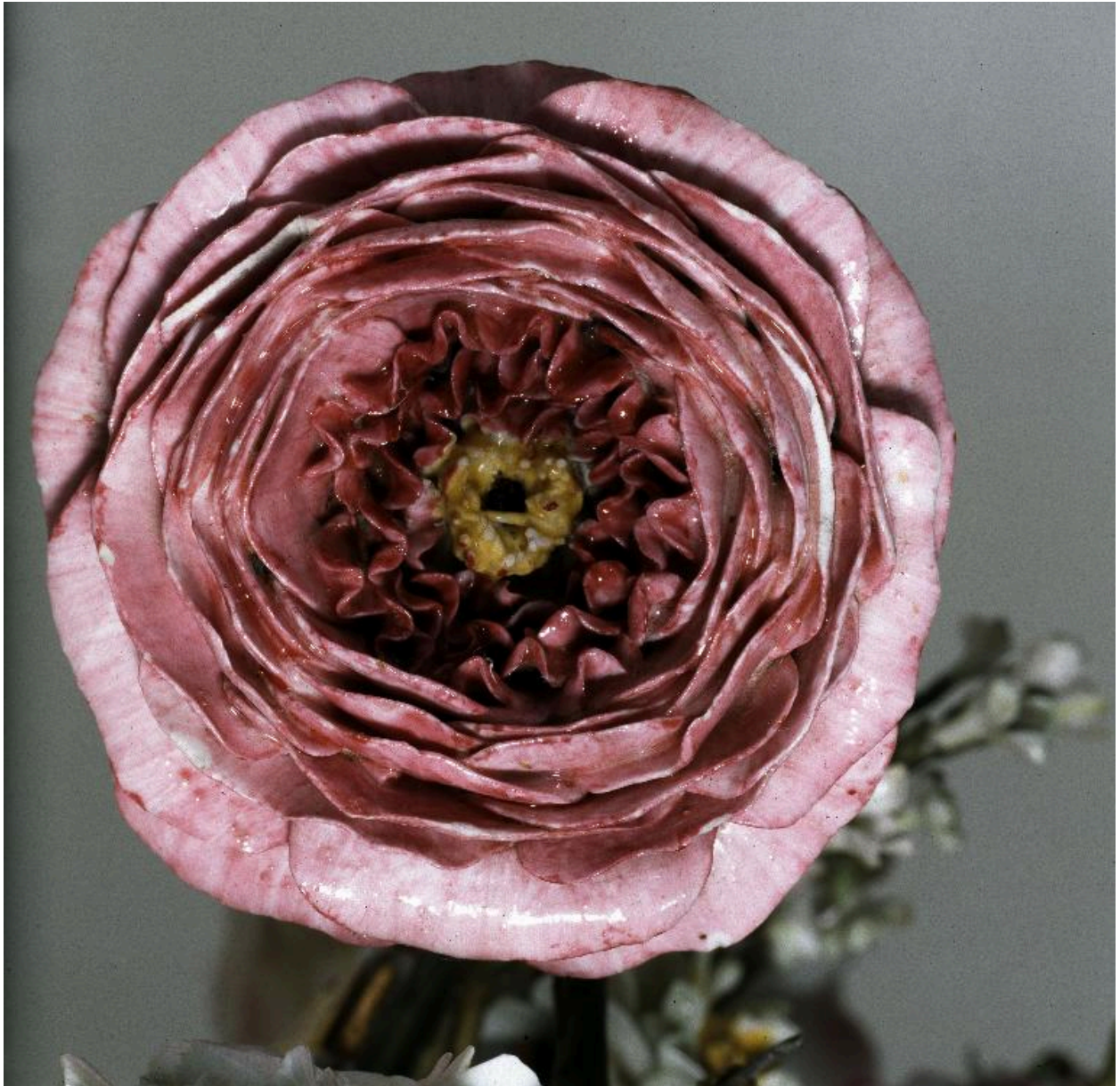
Détail d'une des fleurs du bouquet.