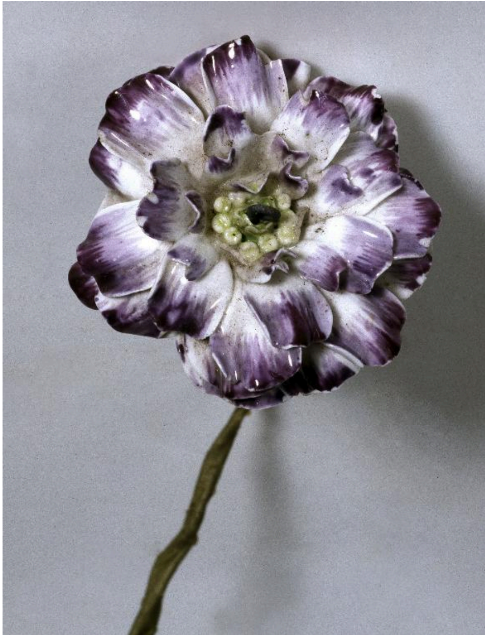
Détail d'une des fleurs du bouquet: un oeillet (?).