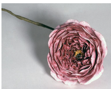
Détail d'une des fleurs du bouquet. IVR22_19966003522XA