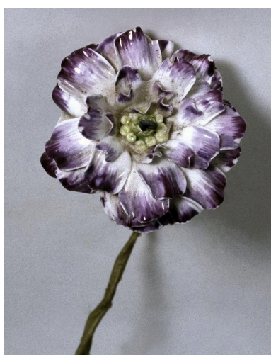
Détail d'une des fleurs du bouquet: un oeillet (?).