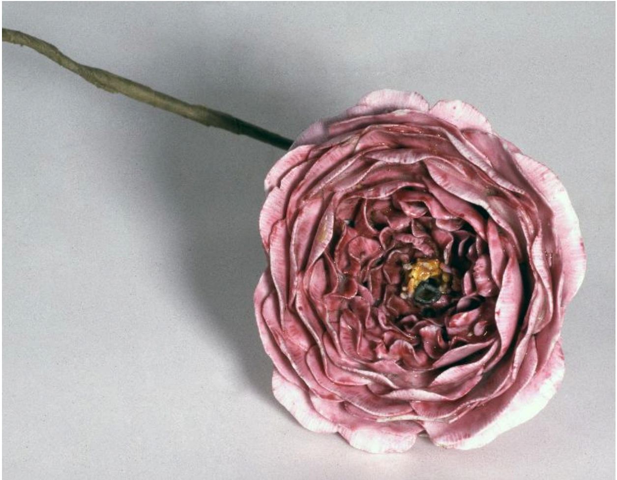
Détail d'une des fleurs du bouquet.