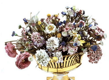
Vue rapprochée. IVR22_19966003460XA