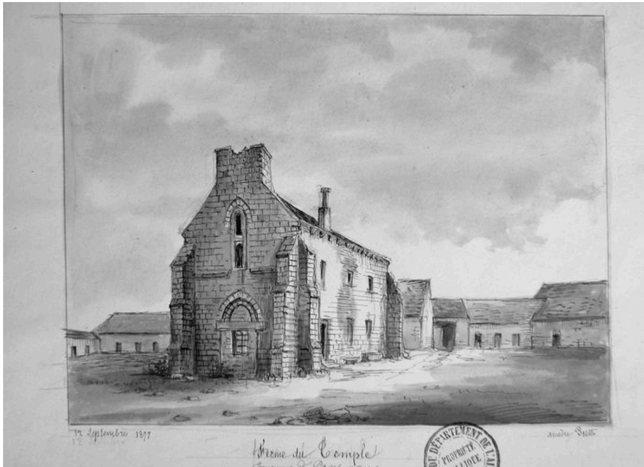
Dessin de la chapelle médiévale de la commanderie en 1877, par Amédée Piette (AD Aisne : 8 Fi Pontavert 3).