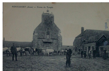
Vue de la ferme avant la guerre (coll. part).