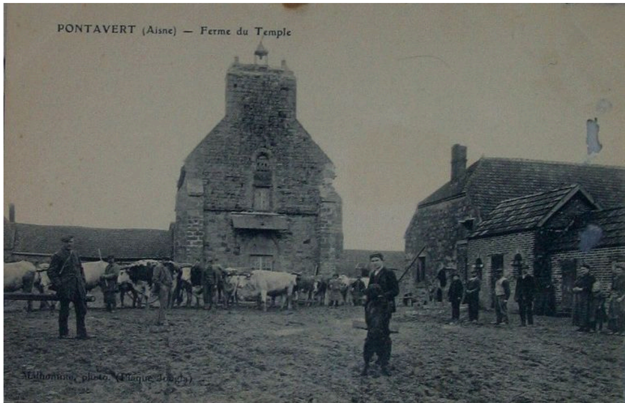
Vue de la ferme avant la guerre (coll. part).