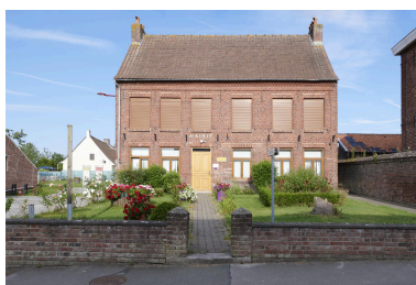
Façade principale de la mairie. IVR32_20245902851NUCA