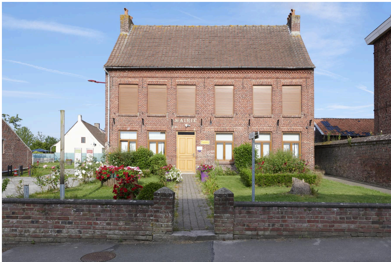
Façade principale de la mairie.