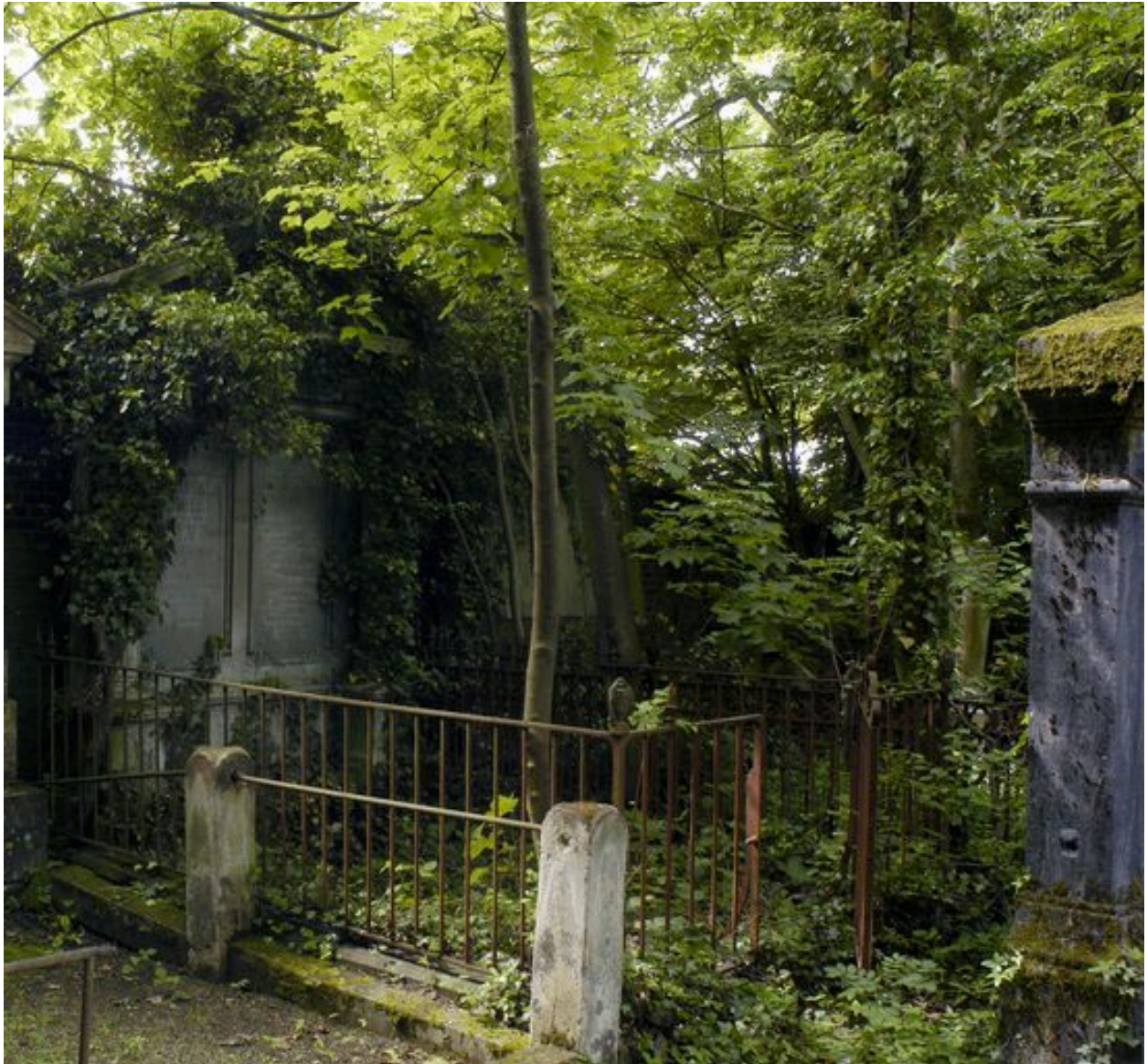
Vue du tombeau de la famille Gallet-Beldame.