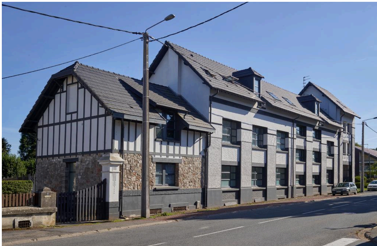
Vue de l'extrémité de la scierie vers la maison de maître depuis la rue de Douai. Vue orientée Sud-Ouest - Nord-Est.