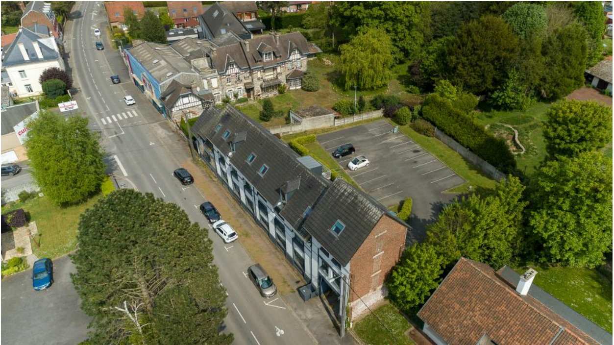
Vue aérienne de situation depuis la rue de Douai, orientée nord-est - sud-ouest.