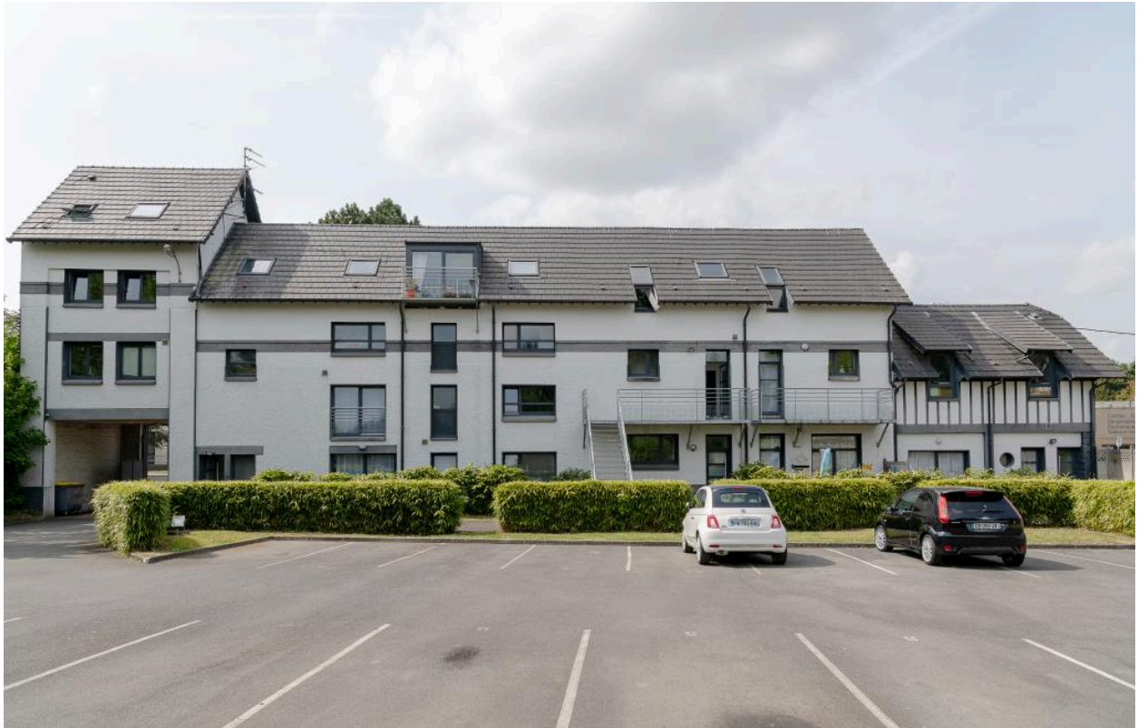
Vue de la façade sur cour de l'ancien immeuble de bureaux.