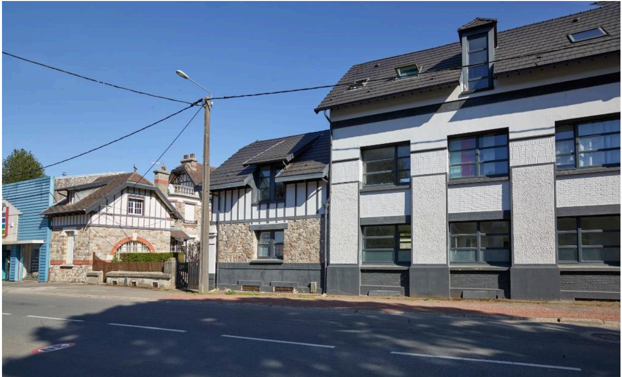
Articulation entre la scierie et la maison de maître vue depuis la rue de Douai.