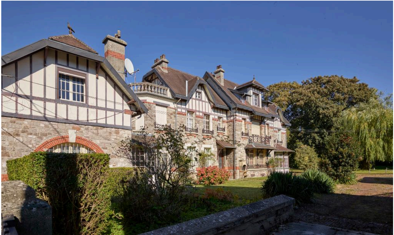
Vue de la façade sur cour de la maison de maitre depuis la rue de Douai.