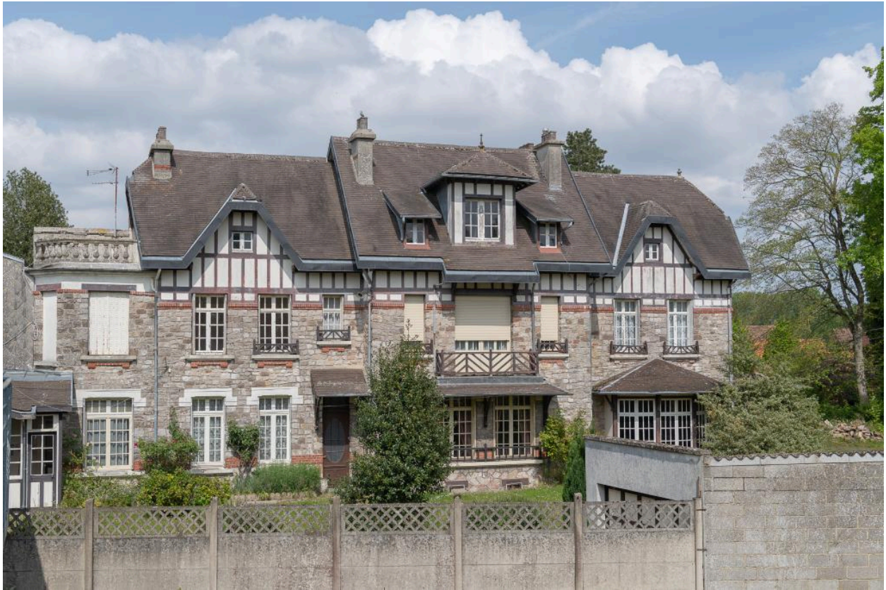
Vue de face de la maison de maître, depuis la cour de l'ancien immeuble de bureaux.