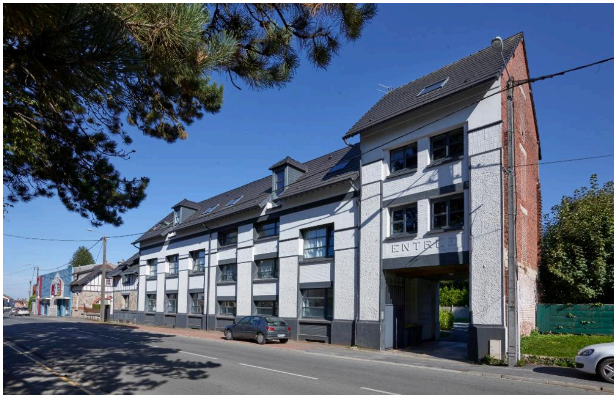
Vue de la façade sur rue de l'ancien immeuble de bureaux depuis la rue de Douai. Vue orientée nord-est - sud-ouest.