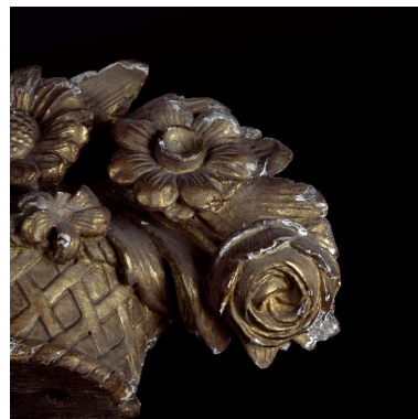
Vue du dessous de la corbeille et de quelques fleurs. IVR22_19956000407XA