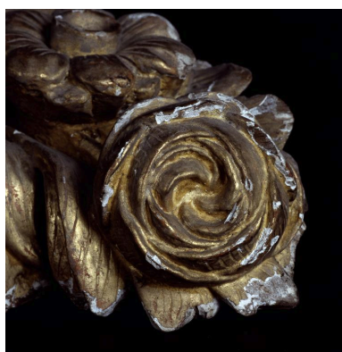
Vue de détail de l'une des fleurs IVR22_19956000408XA