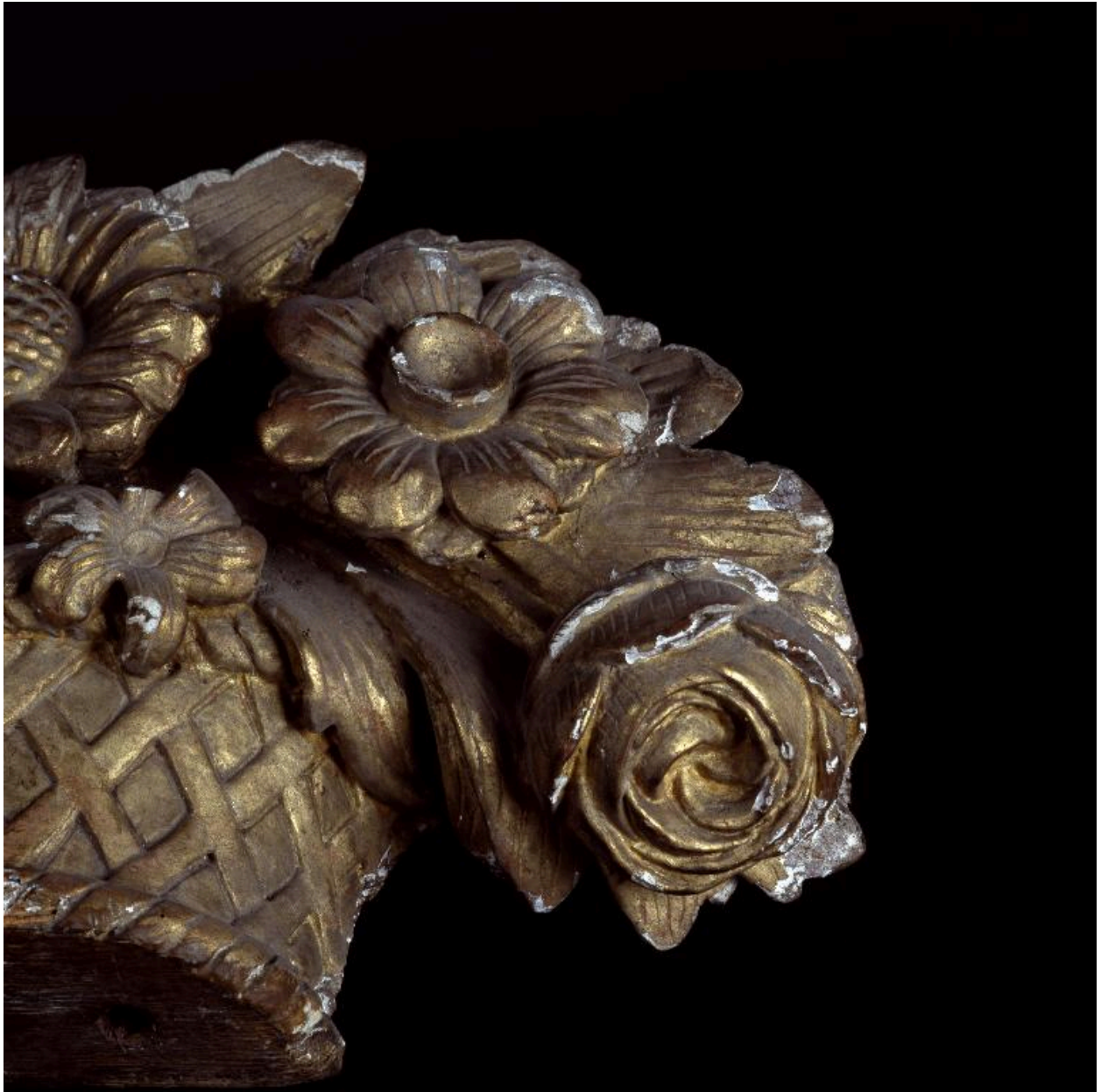
Vue du dessous de la corbeille et de quelques fleurs.