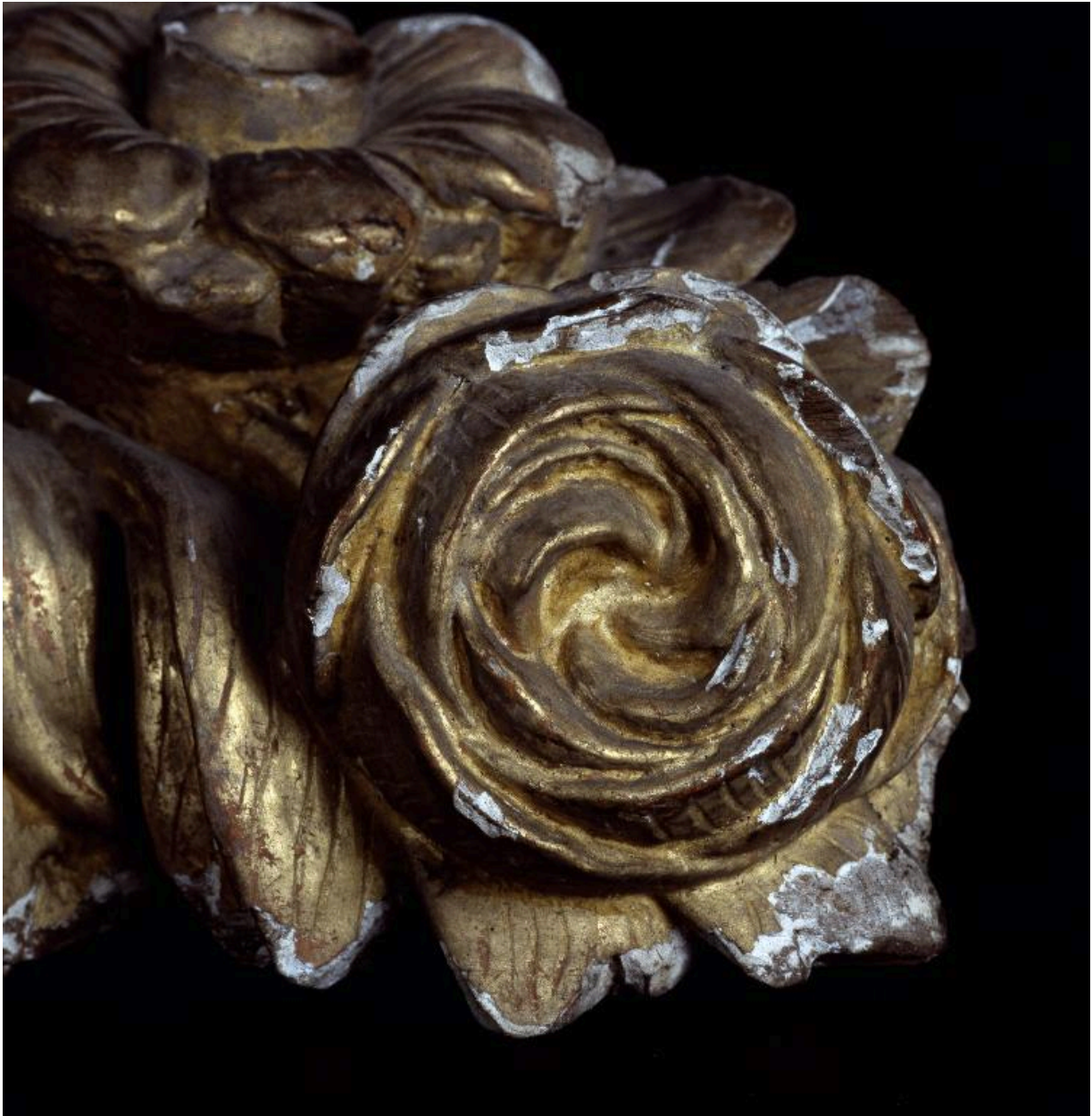
Vue de détail de l'une des fleurs