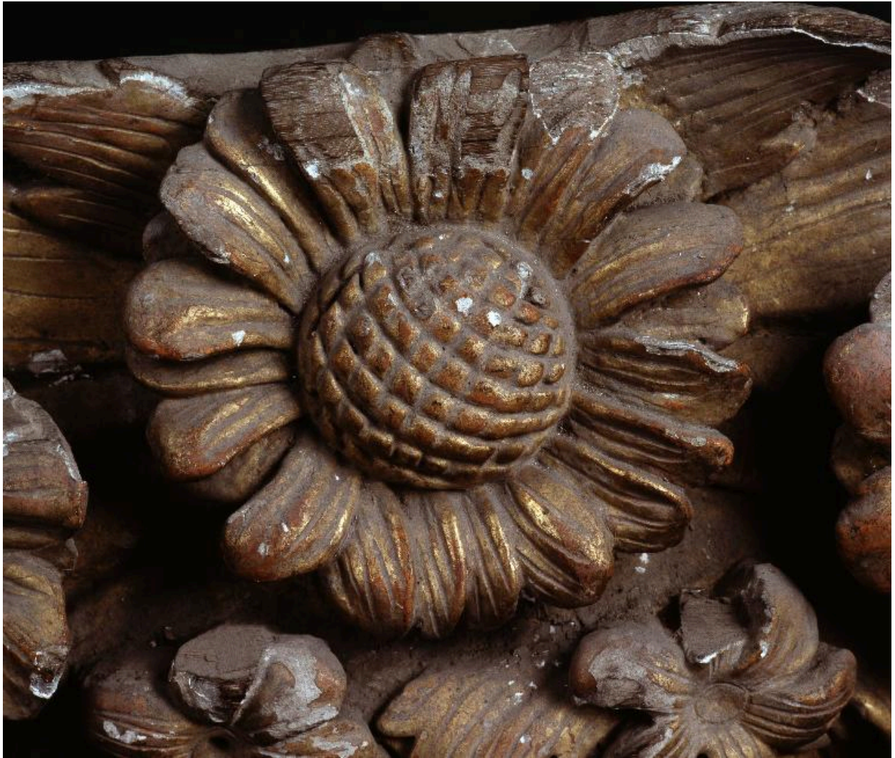
Vue de détail de l'une des fleurs.