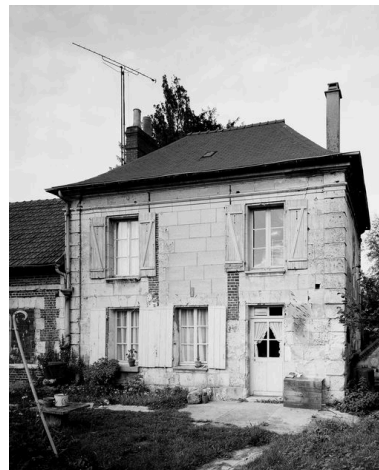
Elévation postérieure.