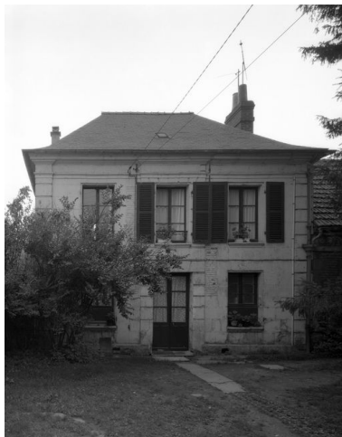
Elévation antérieure. IVR22_19856001407V