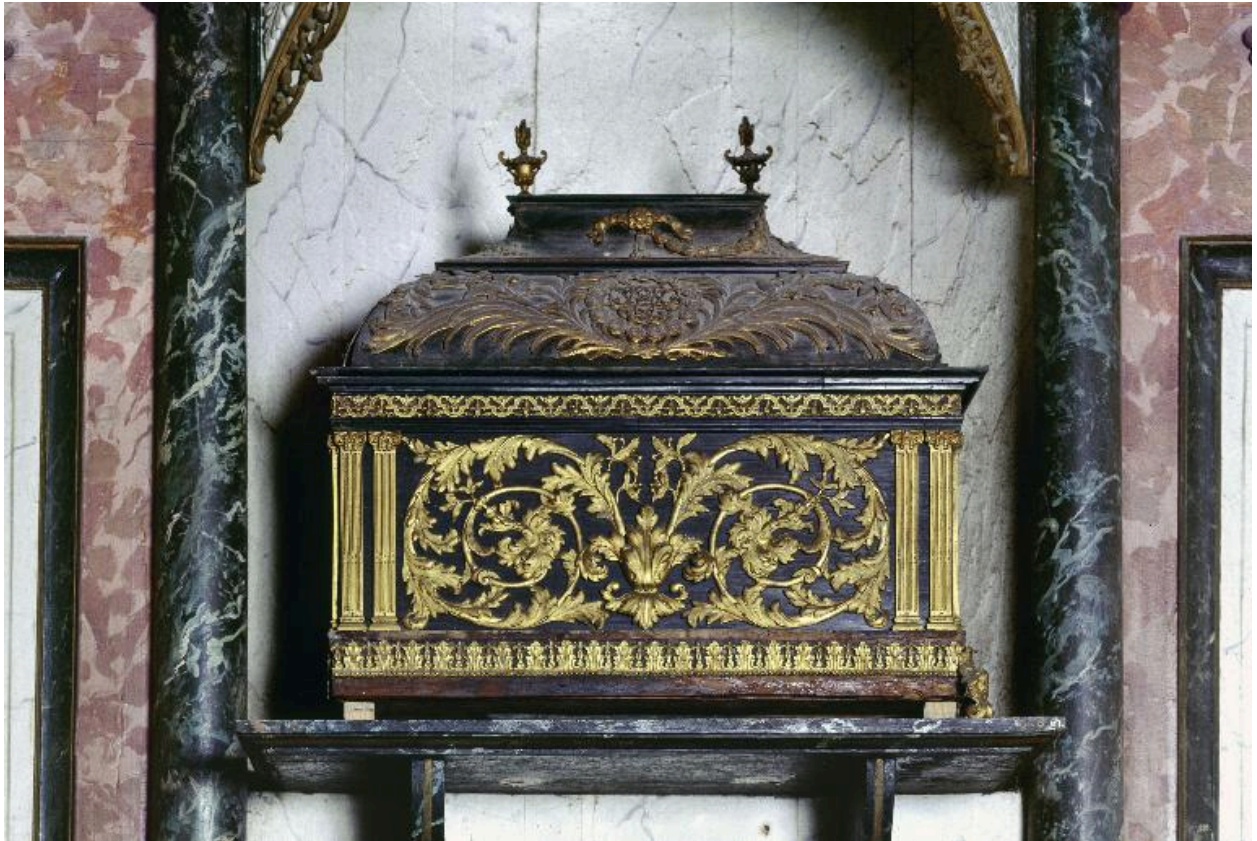
Vue générale de la châsse.