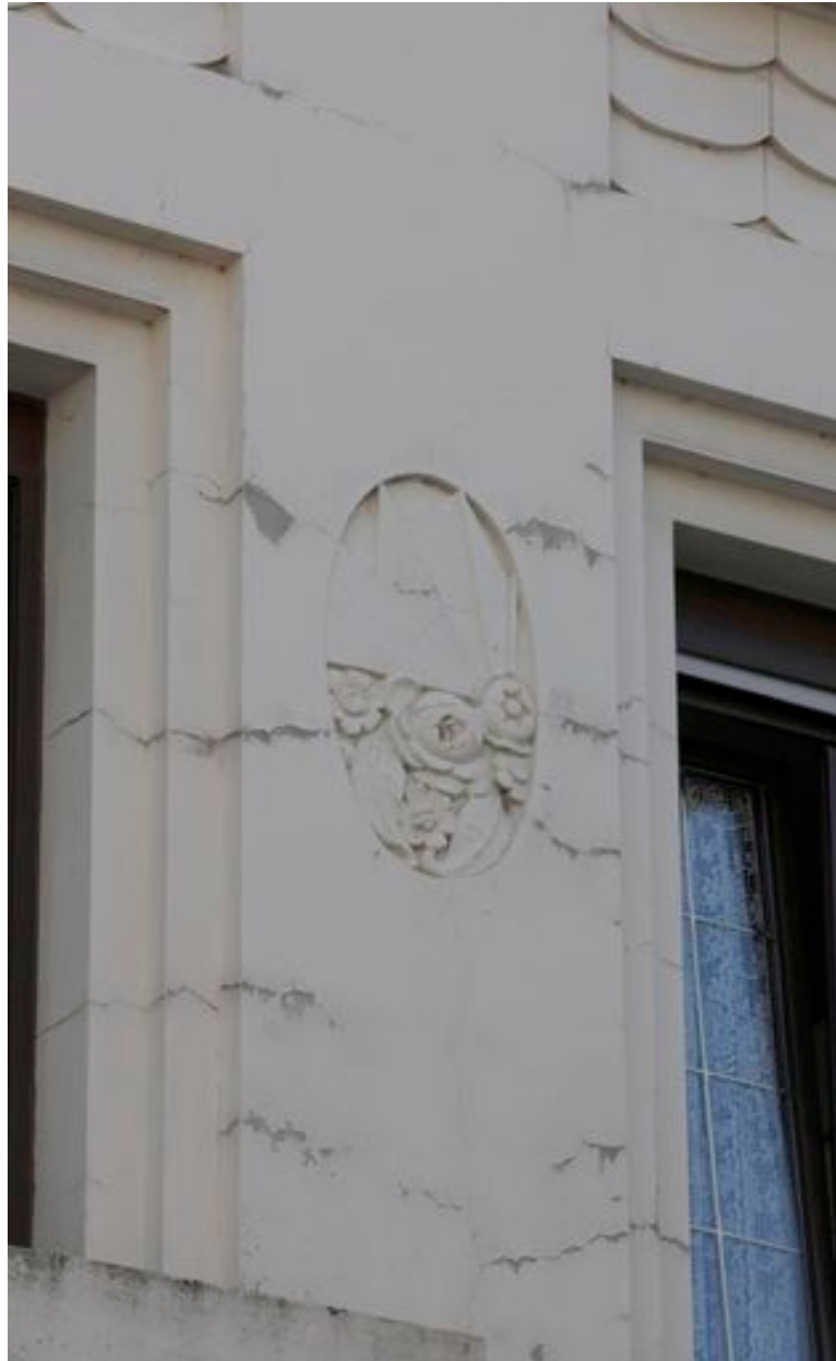
Médaille ornée de motifs floraux et géométriques.