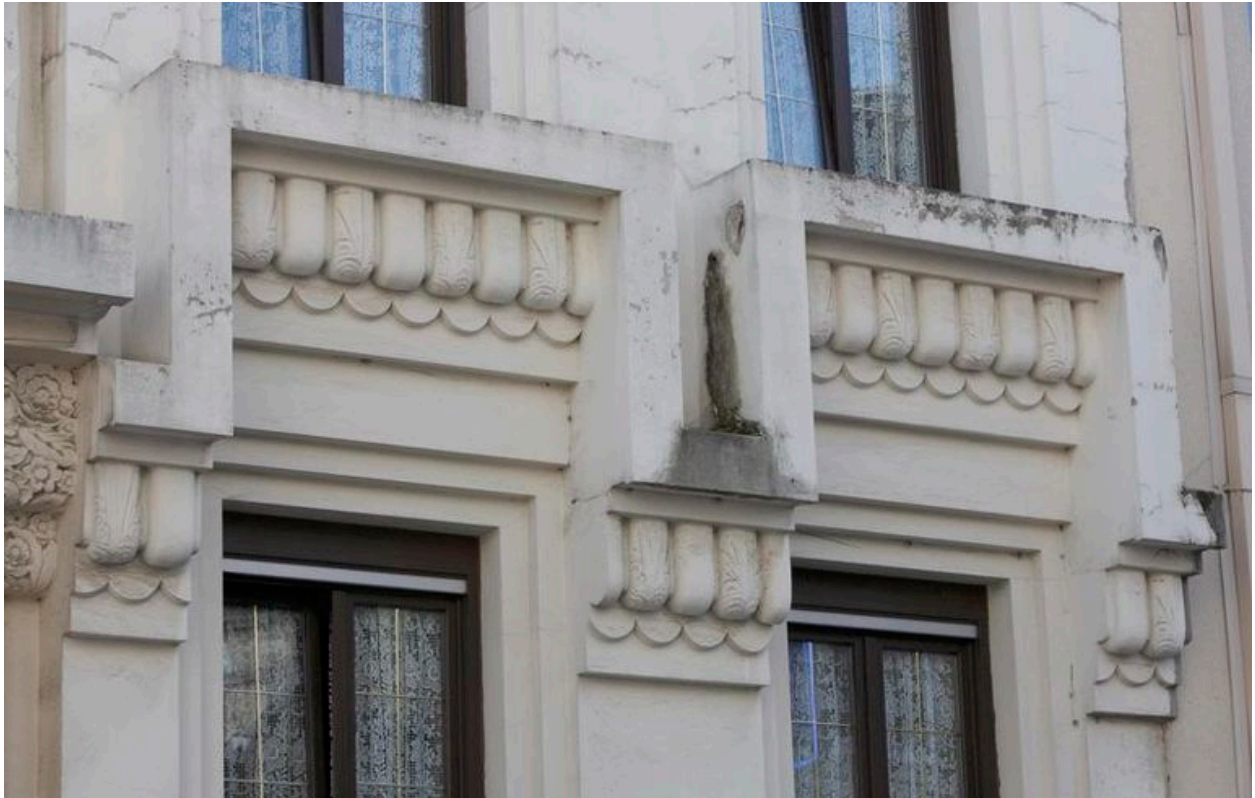
Balcons aux motifs tubulaires.