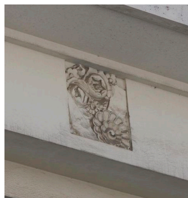
Cartouche sculpté de motifs floraux. IVR31_20096200231NUCA