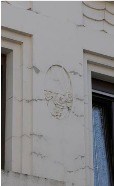
Médailon orné de motifs floraux et géométriques. IVR31_20096200233NUCA