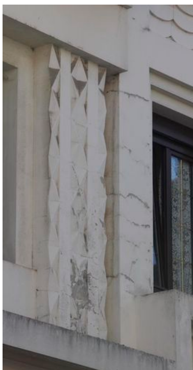
Motifs géométriques. IVR31_20096200232NUCA