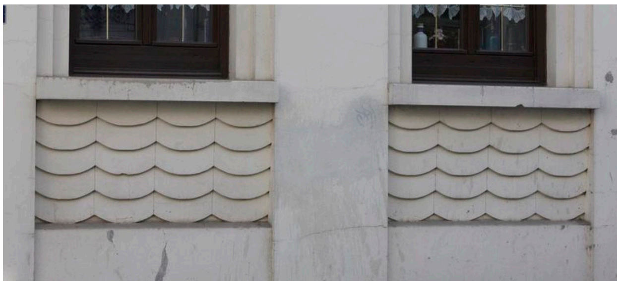
Motifs de vague sur allège.