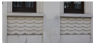
Motifs de vague sur allège. IVR31_20096200235NUCA