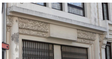
Détail de la frise aux motifs floraux.