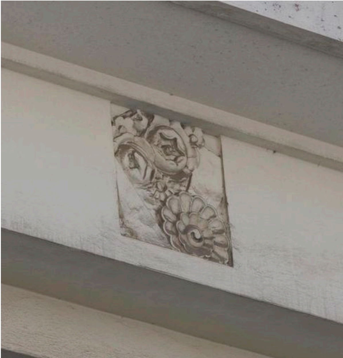
Cartouche sculpté de motifs floraux.