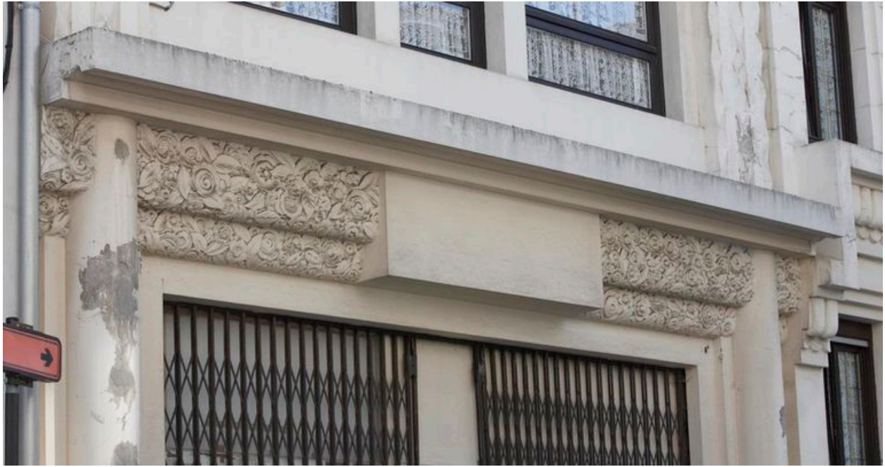
Détail de la frise aux motifs floraux.