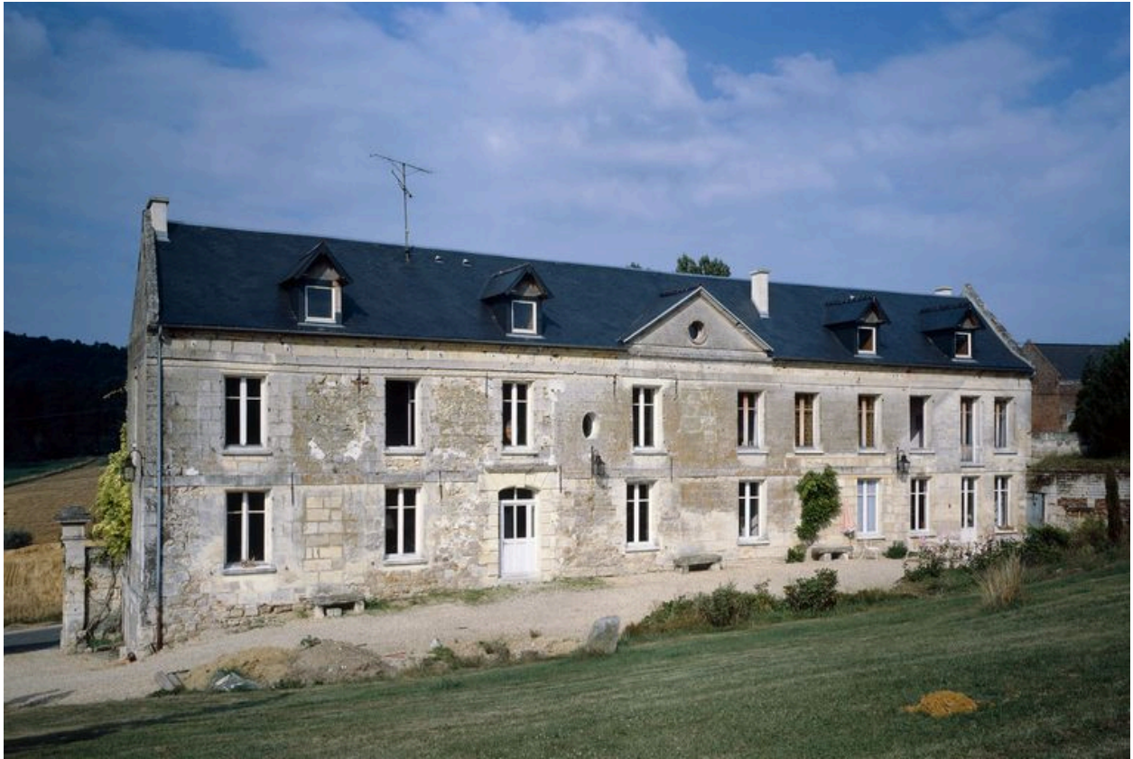
Logis. Elévation postérieure.