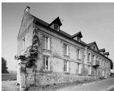
Logis. Elévation antérieure. IVR22_19846001224V