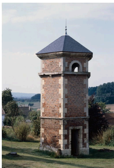
Colombier.