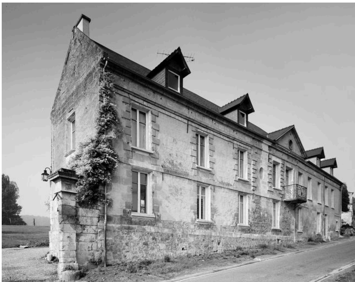
Logis. Elévation antérieure.