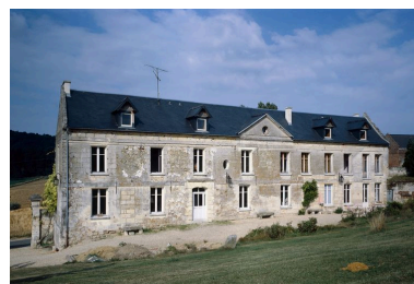
Logis. Elévation postérieure. IVR22_19846001131XA