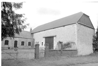
Grange et logis attenant.