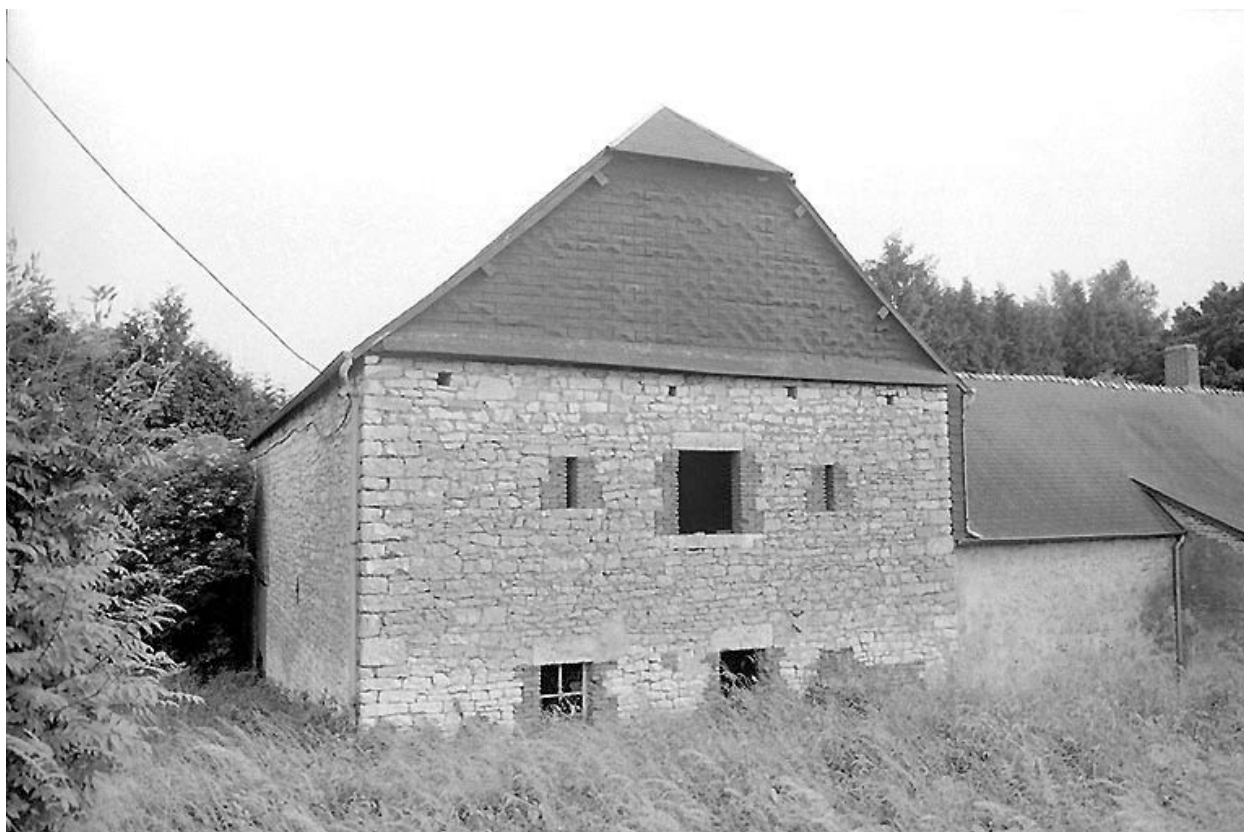
Elévation postérieure de la grange.