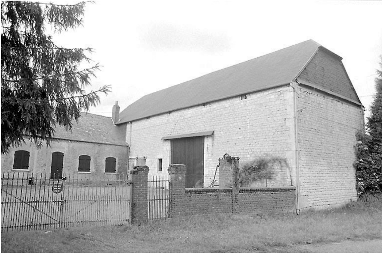
Grange et logis attenant.