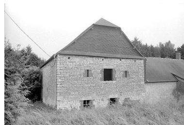
Elévation postérieure de la grange.