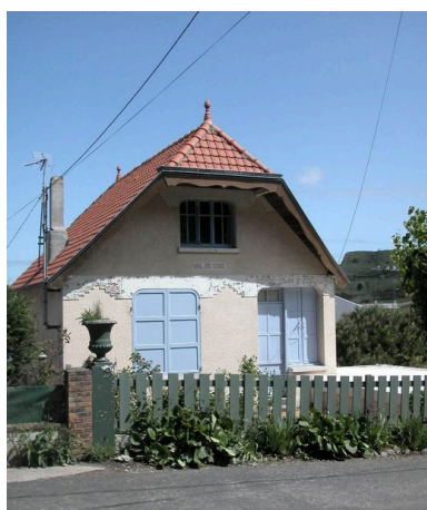
Vue d'ensemble depuis la route de la Falaise. IVR22_20058003033NUCA