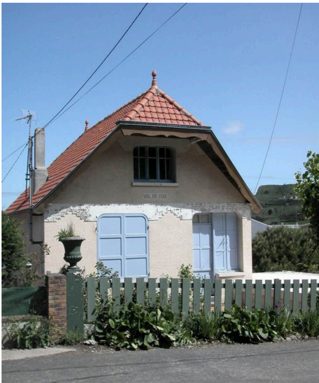
Vue d'ensemble depuis la route de la Falaise.