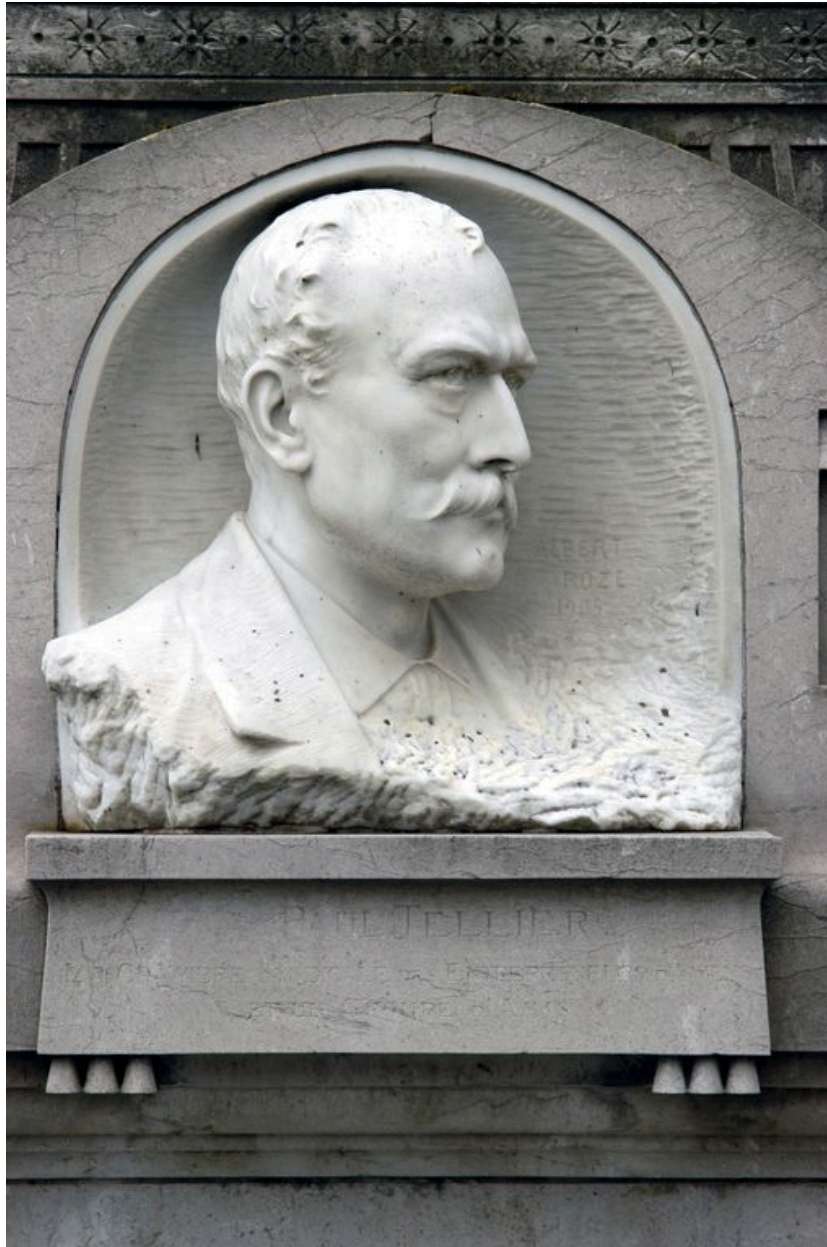
Vue de détail sur le portrait de Paul Tellier.