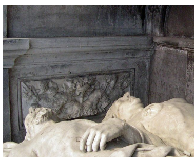
Vue de détail : bas-relief intérieur gauche.