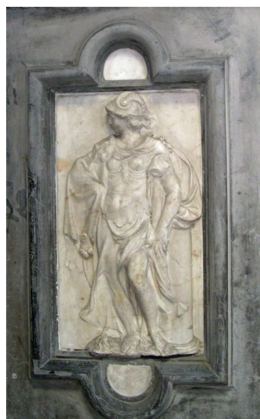
Vue de détail : bas-relief du pilastre gauche.