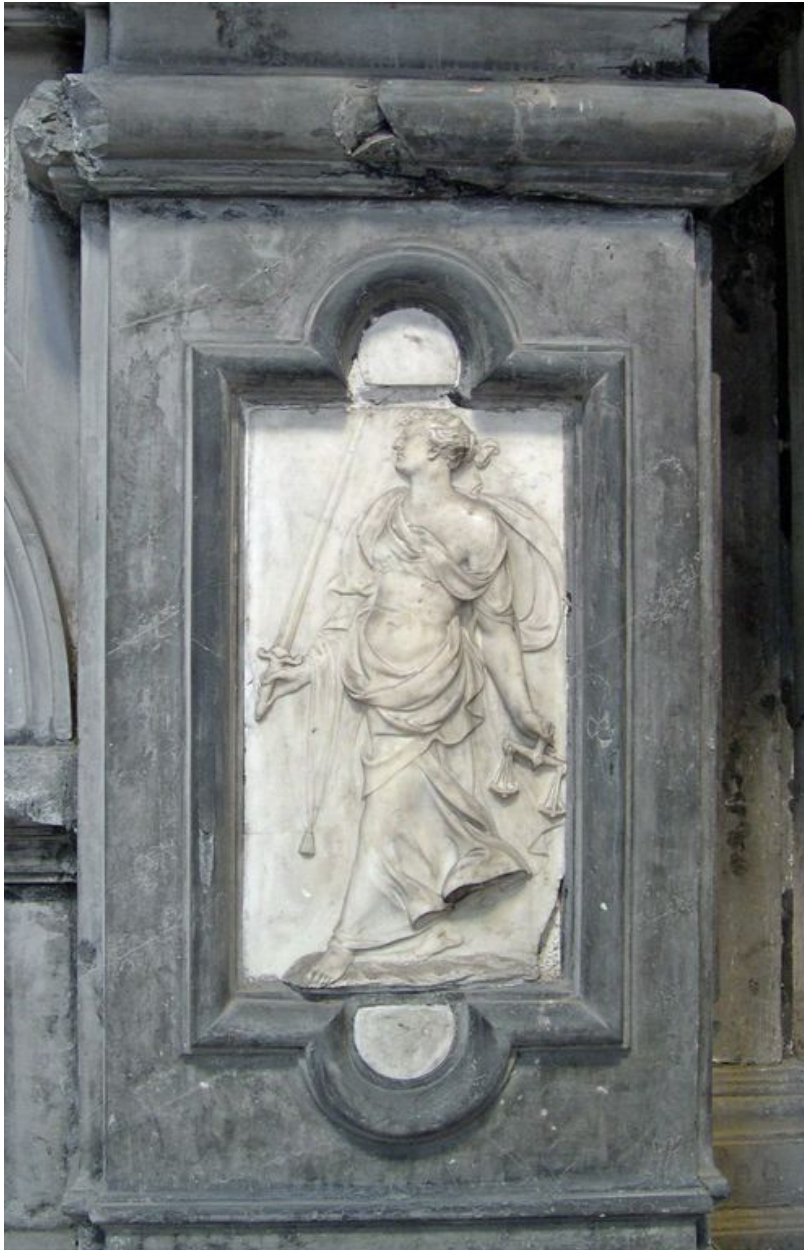
Vue de détail : bas-relief du pilastre droit.