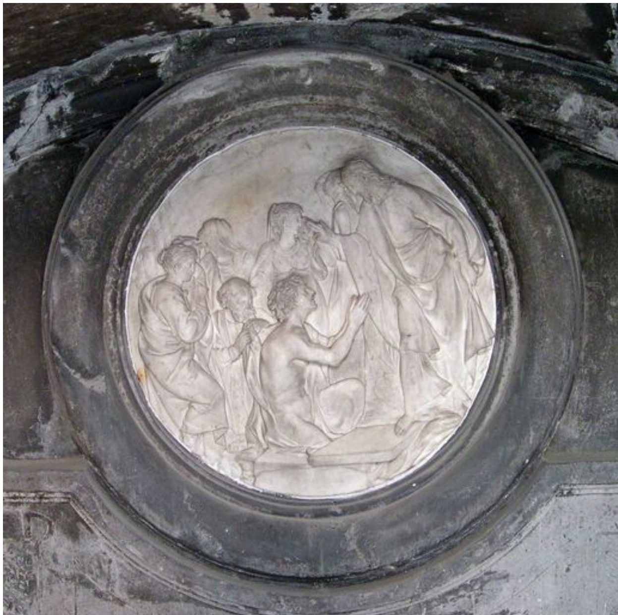
Vue du médaillon circulaire.