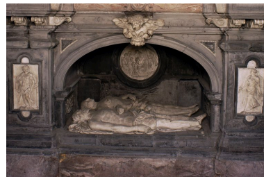
Partie inférieure. IVR22_20068000293NUCA