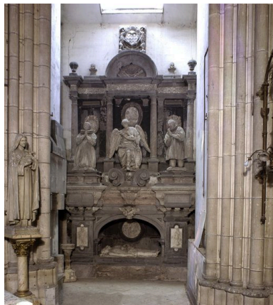
Vue générale. IVR22_20068000292NUCA