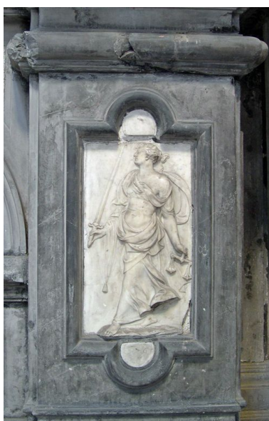
Vue de détail : bas-relief du pilastre droit.