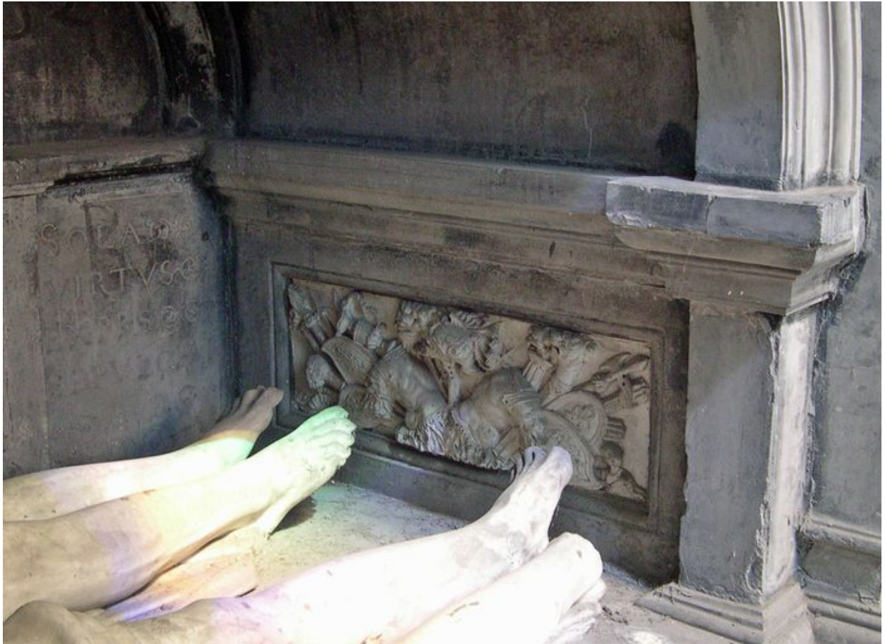
Vue de détail : bas-relief intérieur droit.