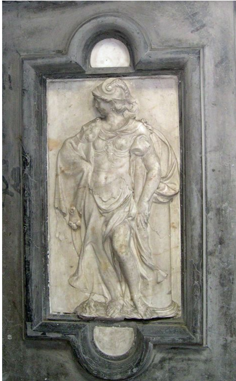
Vue de détail : bas-relief du pilastre gauche.