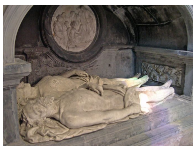
Vue de détail : gisants. IVR22_20068010067NUCA