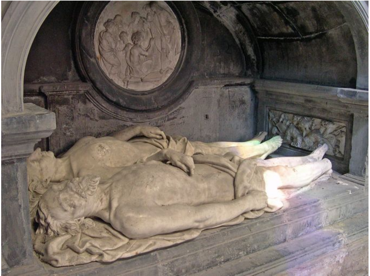
Vue de détail : gisants.