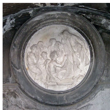
Vue du médaillon circulaire.