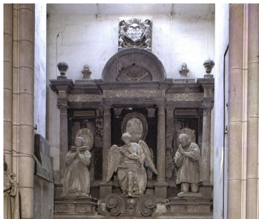
Partie supérieure. IVR22_20068000304NUCA