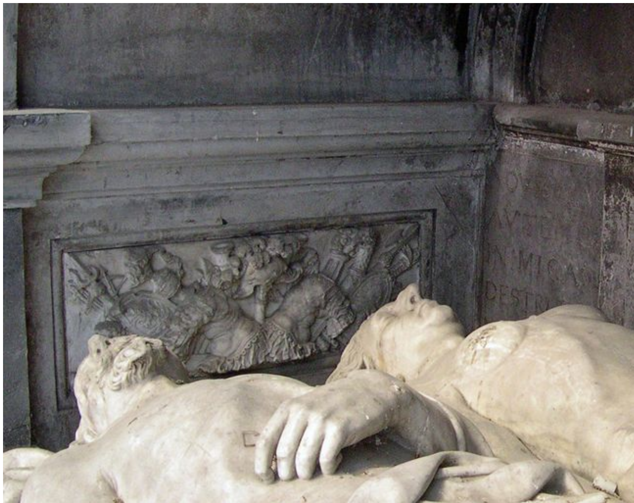
Vue de détail : bas-relief intérieur gauche.