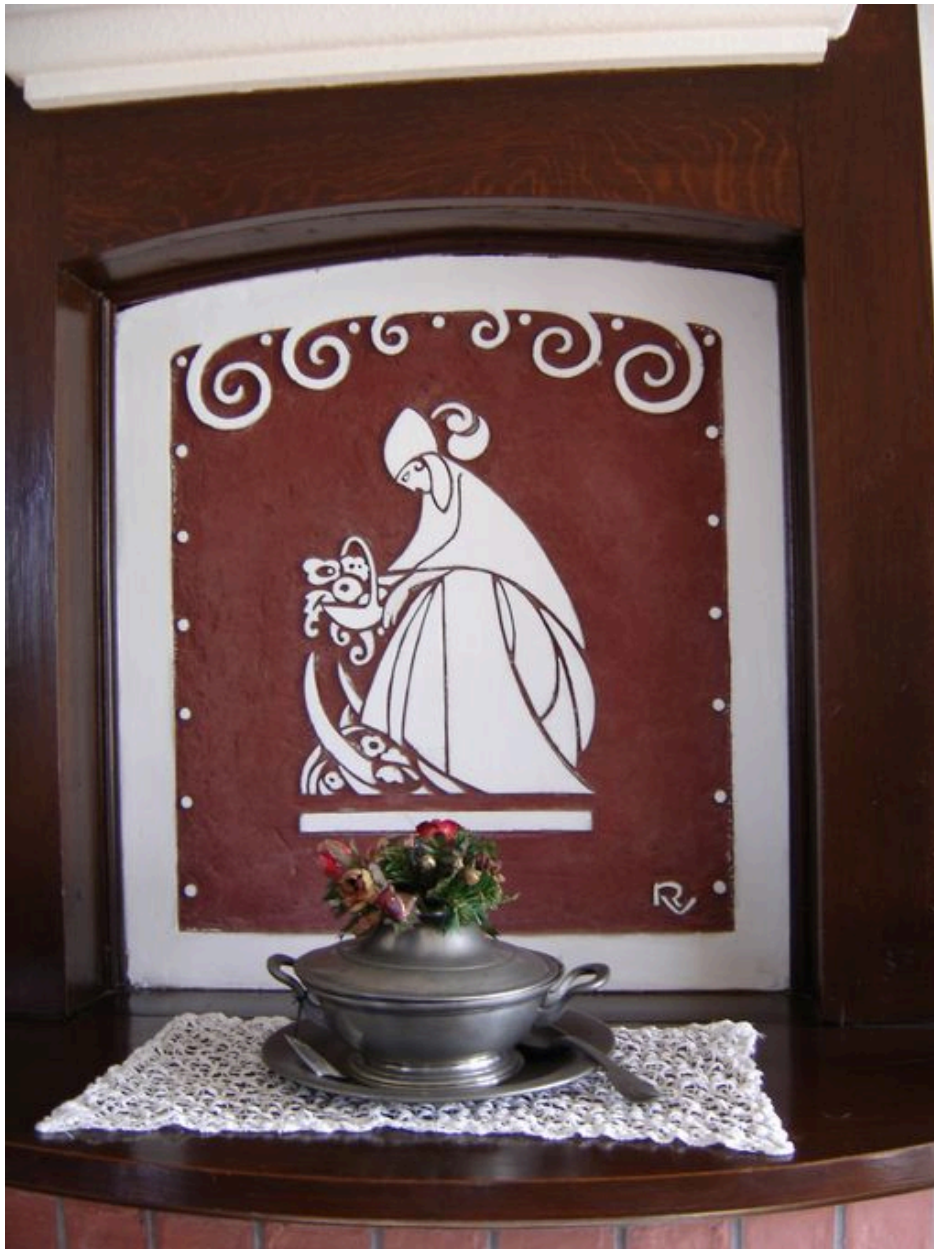
Vue d'un bas-relief dans la salle à manger.