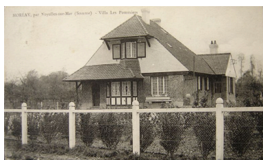
Carte postale présentant la résidence au début du 20e siècle.