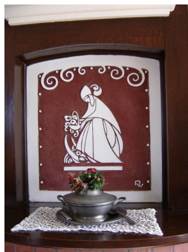
Vue d'un bas-relief dans la salle à manger.