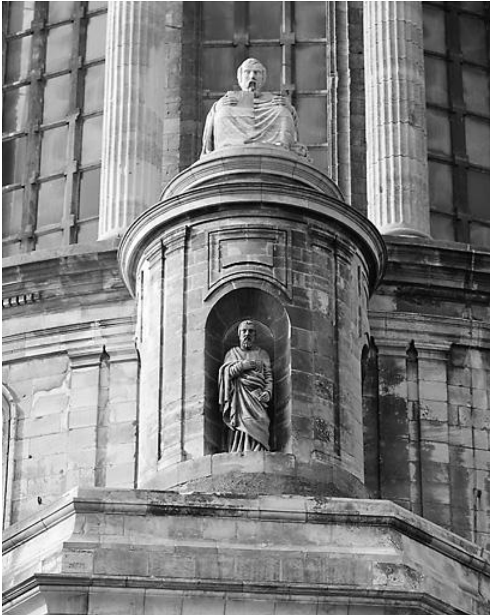
Saint Matthieu, évangéliste, vue montante, face.