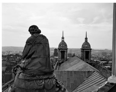
Saint Luc, évangéliste : trois quarts revers.

IVR31_19876201556X