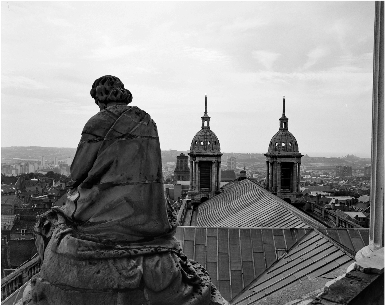
Saint Luc, évangéliste : trois quarts revers.