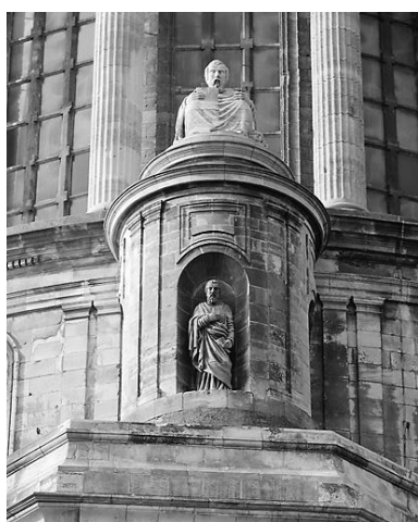
Saint Matthieu, évangéliste, vue montante, face.

Phot. Jean-Michel Périn IVR31_19876201550X