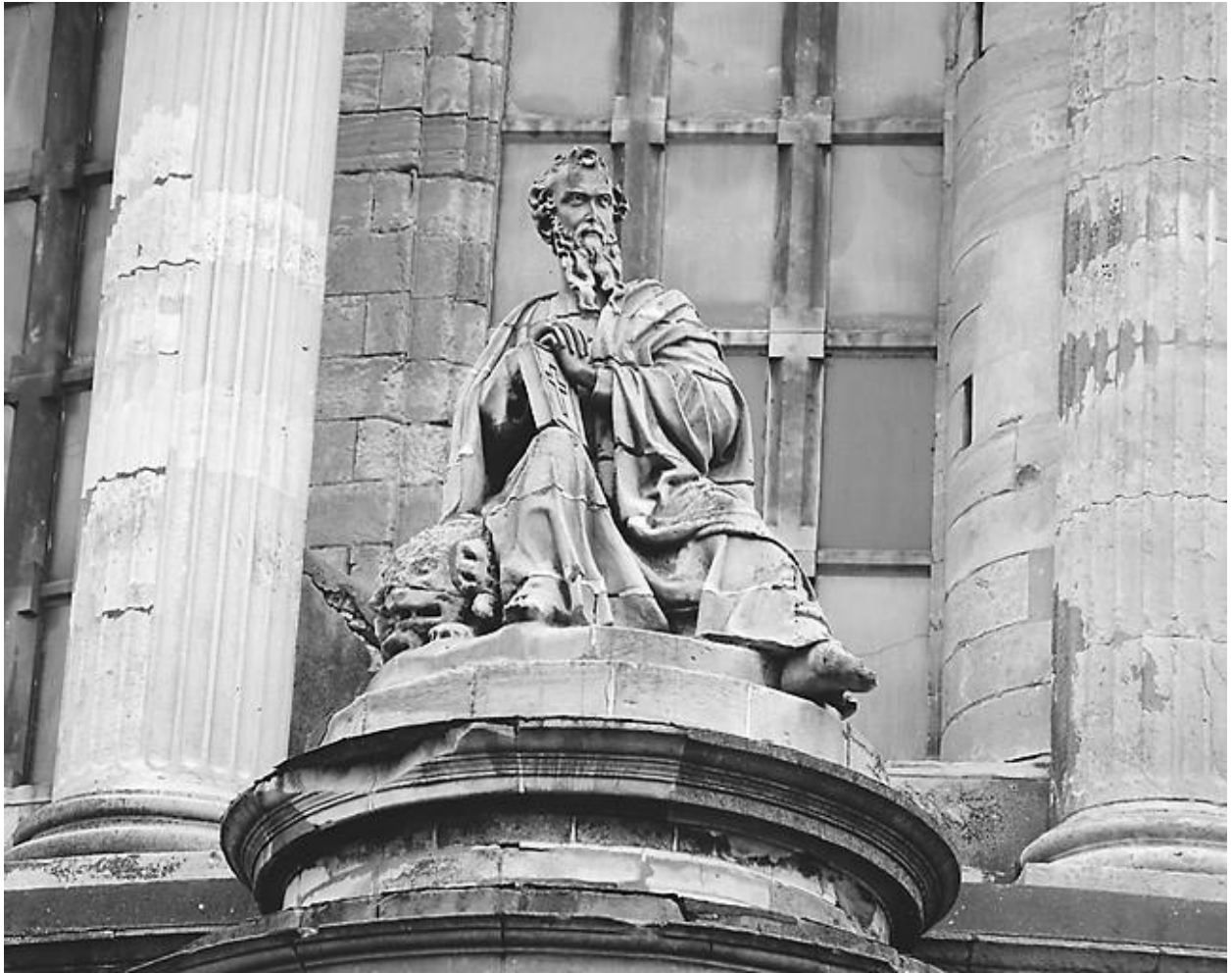
Saint Marc, évangéliste : face.