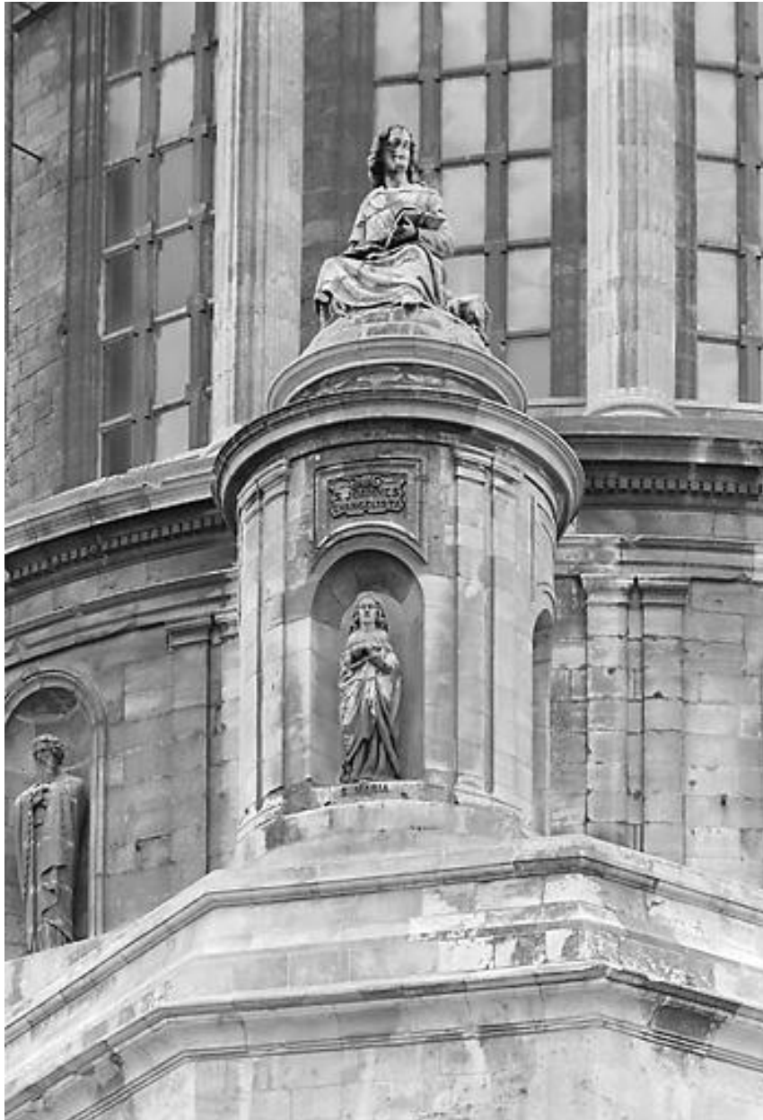
Saint Jean, évangéliste : vue montante, face.