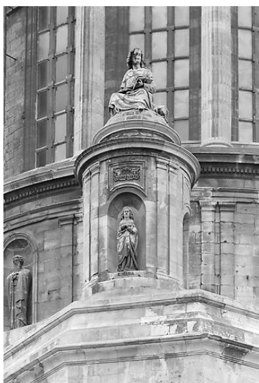
Saint Jean, évangéliste : vue montante, face.

IVR31_19876201536X