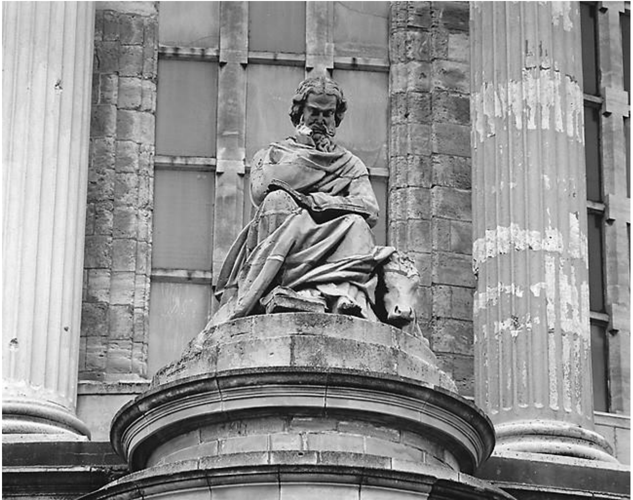
Saint Luc, évangéliste : face.