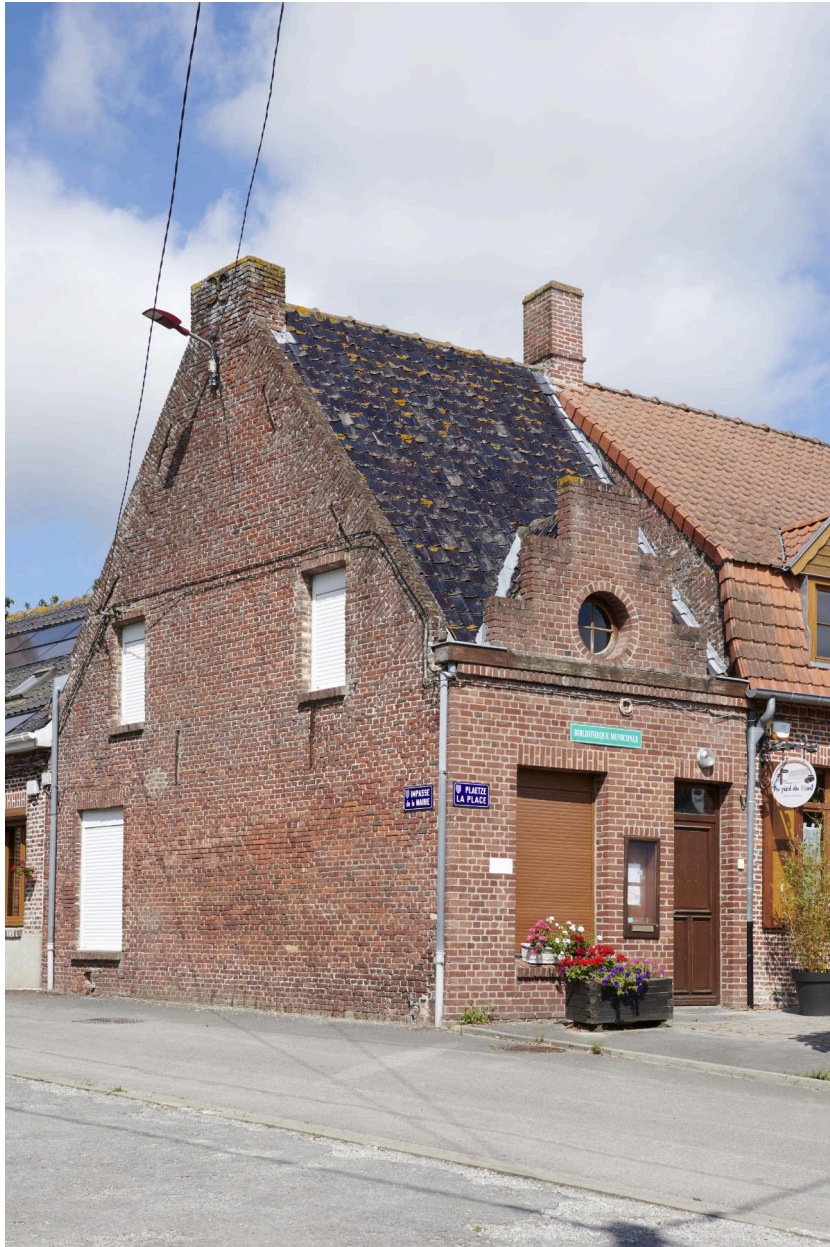
Façade et profil.