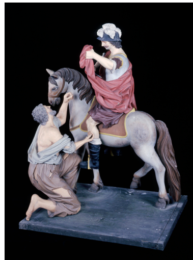
Vue de profil. IVR22_19950202901XA