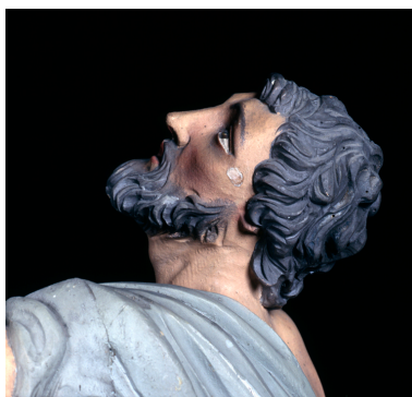
Détail du visage du pauvre. IVR22_19950202910XA