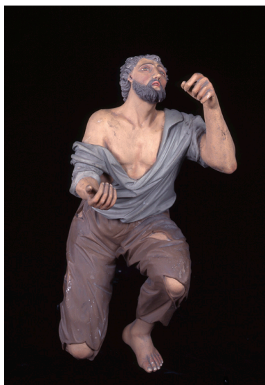
Le pauvre, vue de face.