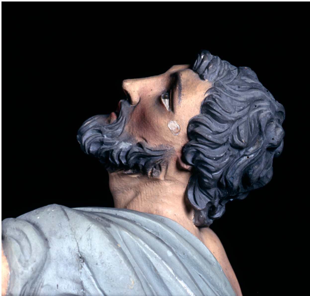
Détail du visage du pauvre.