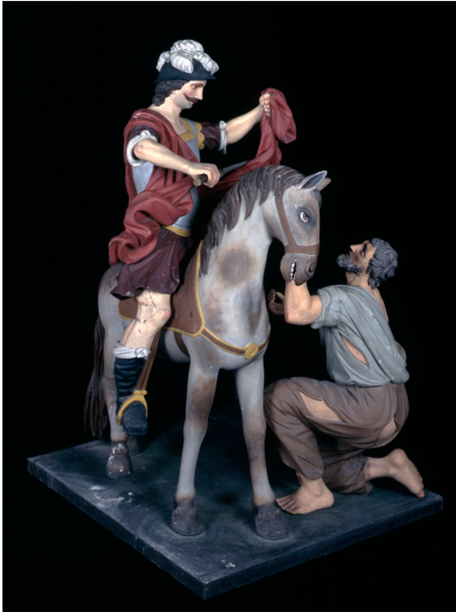
Vue de trois-quarts.