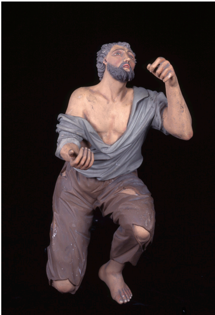
Le pauvre, vue de face.