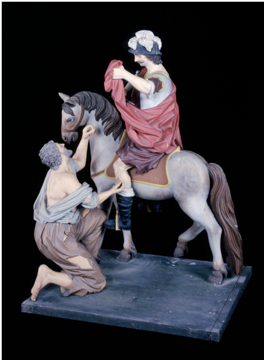
Vue de profil.