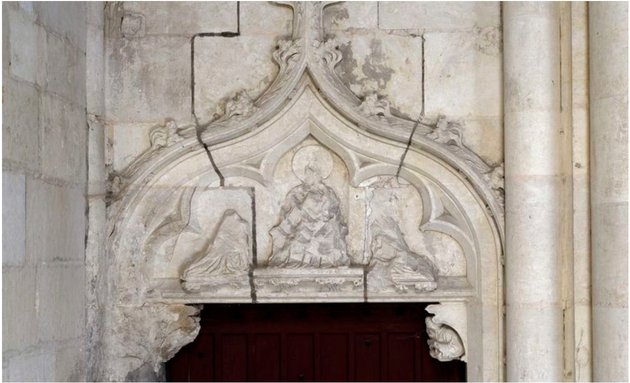
Vue du décor du tympan de la porte.