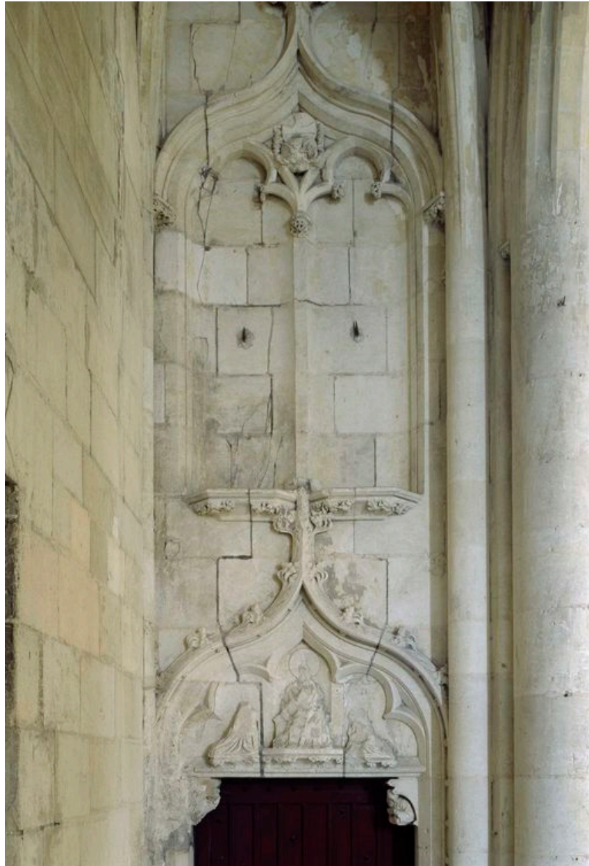
Vue du décor du mur.