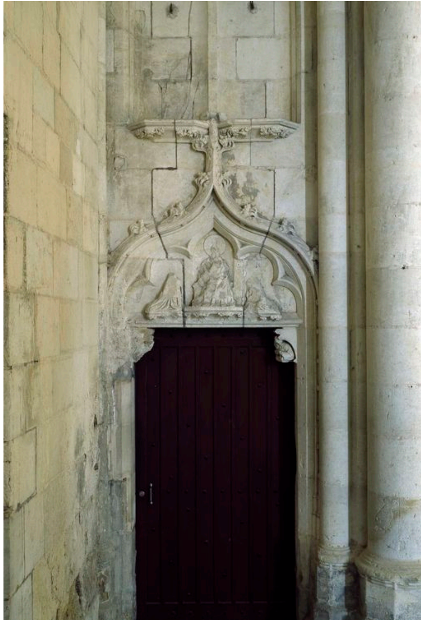
Vue du décor de la porte.