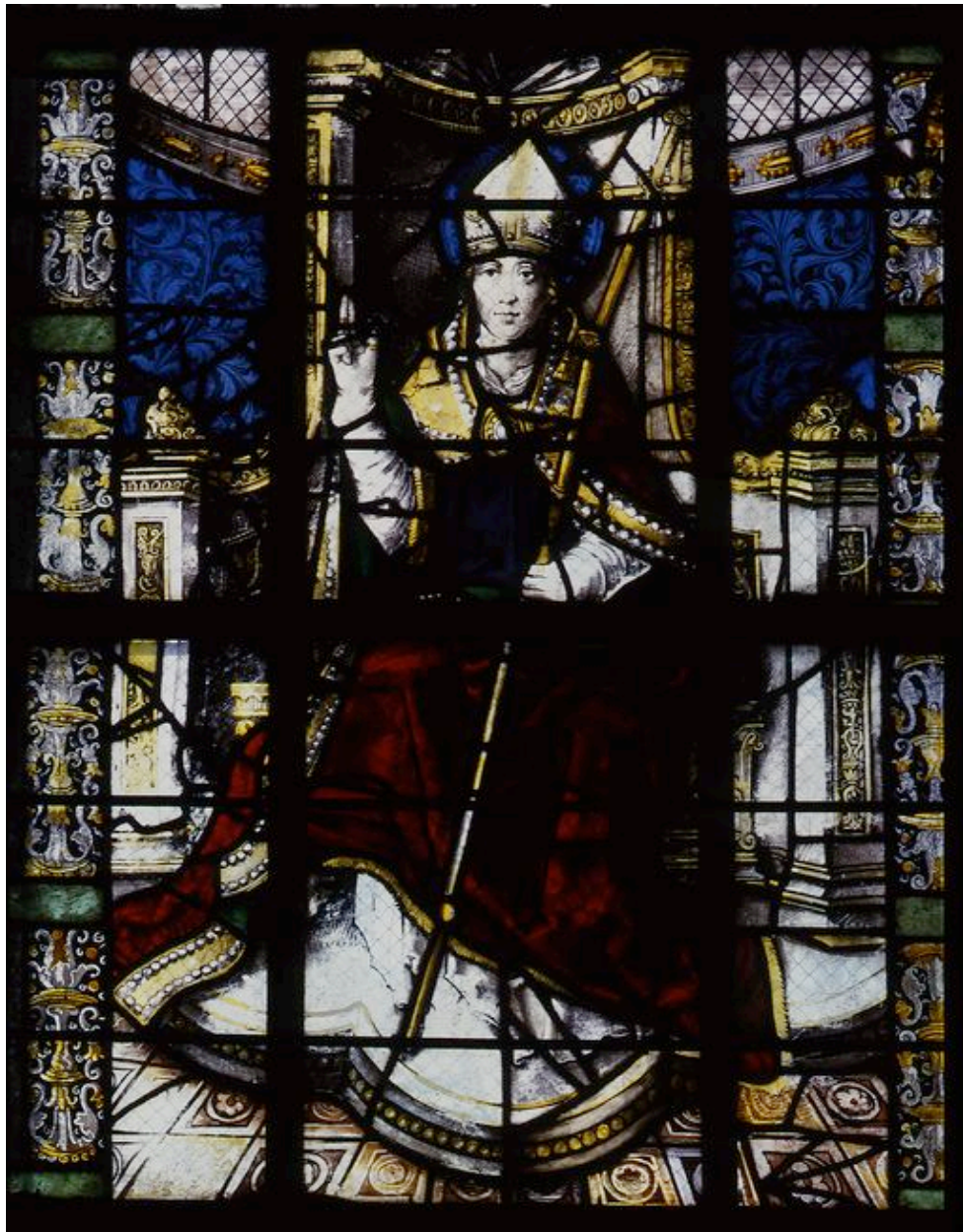
Vue générale de saint Claude.