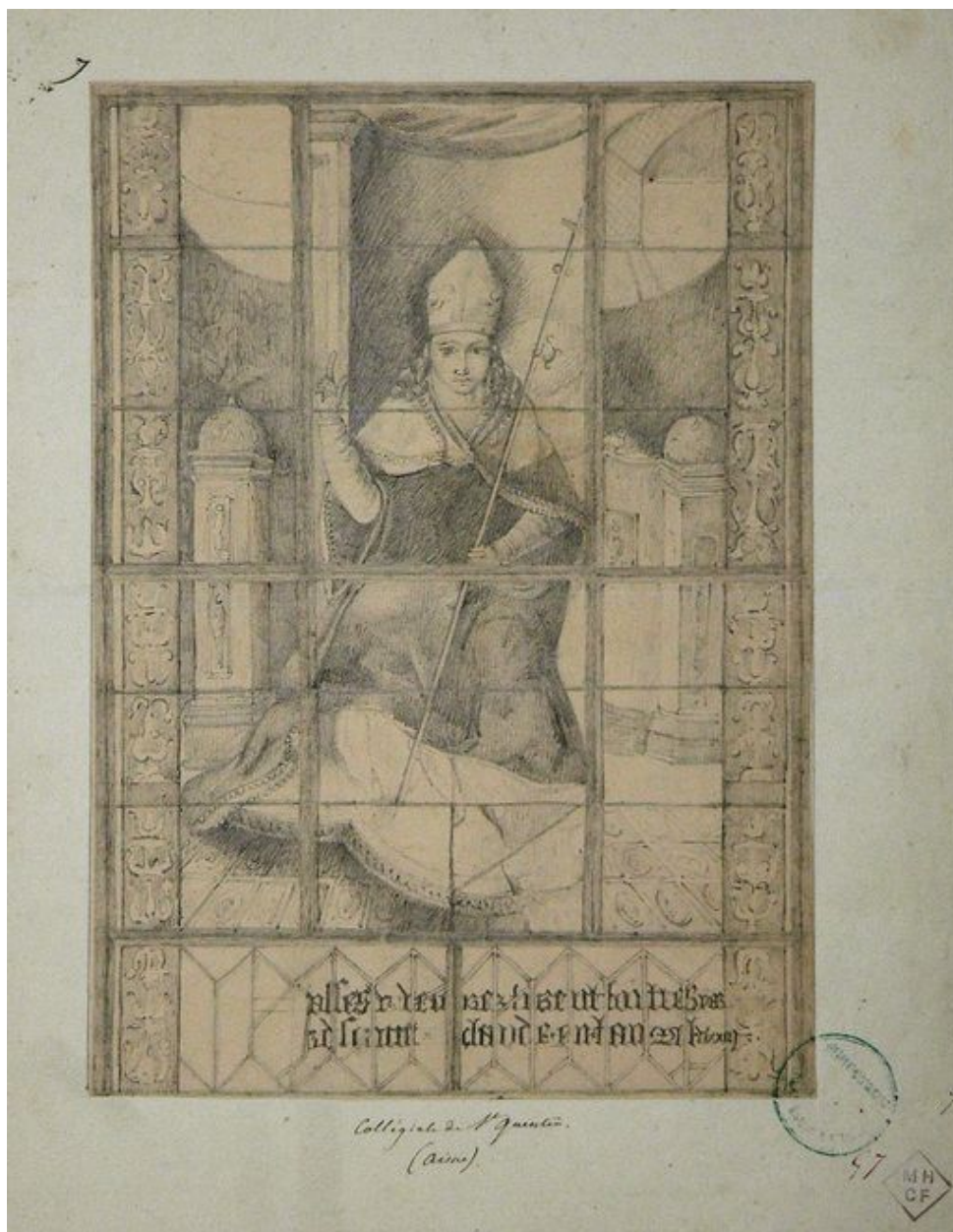
Dessin représentant le panneau, vers le milieu du 19e siècle (Médiathèque du Patrimoine : 82/02/2050, n° 57).