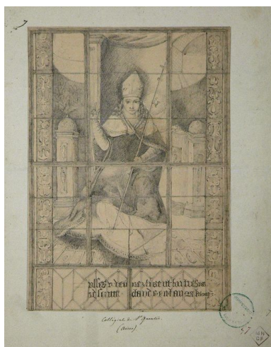
Dessin représentant le panneau, vers le milieu du 19e siècle (Médiathèque du Patrimoine : 82/02/2050, n° 57).