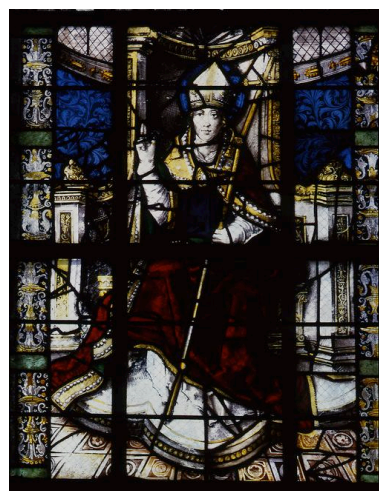
Vue générale de saint Claude.