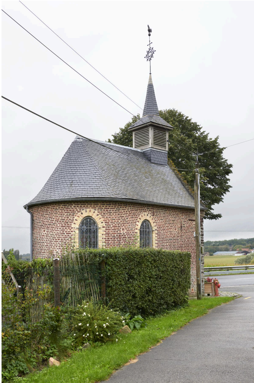
Vue depuis l'est.