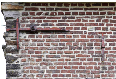
Détail des fers d'ancrage.