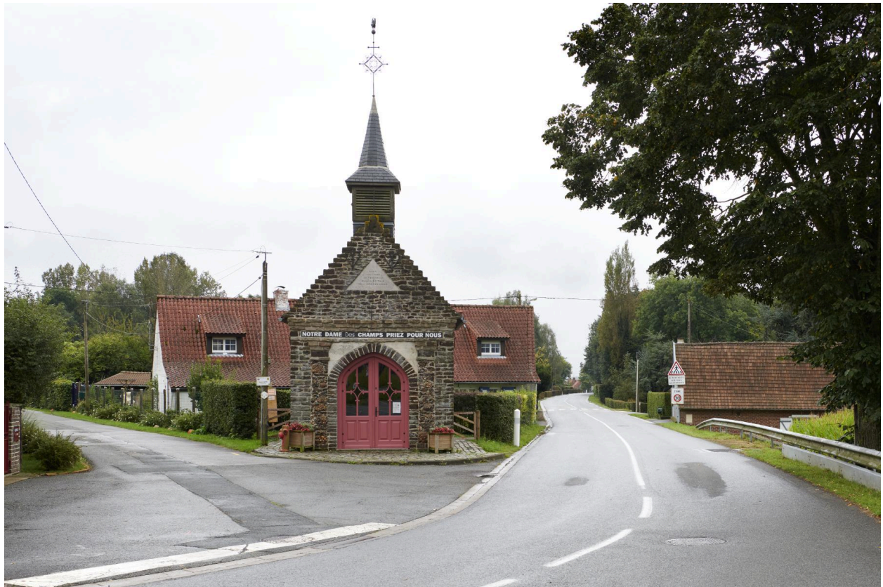
La chapelle dans son environnement direct.