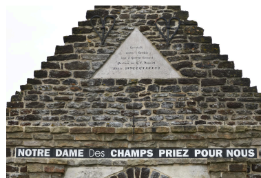
Détail du fronton et de la dédicace.