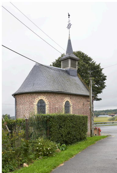
Vue depuis l'est. IVR32_20245903169NUCA