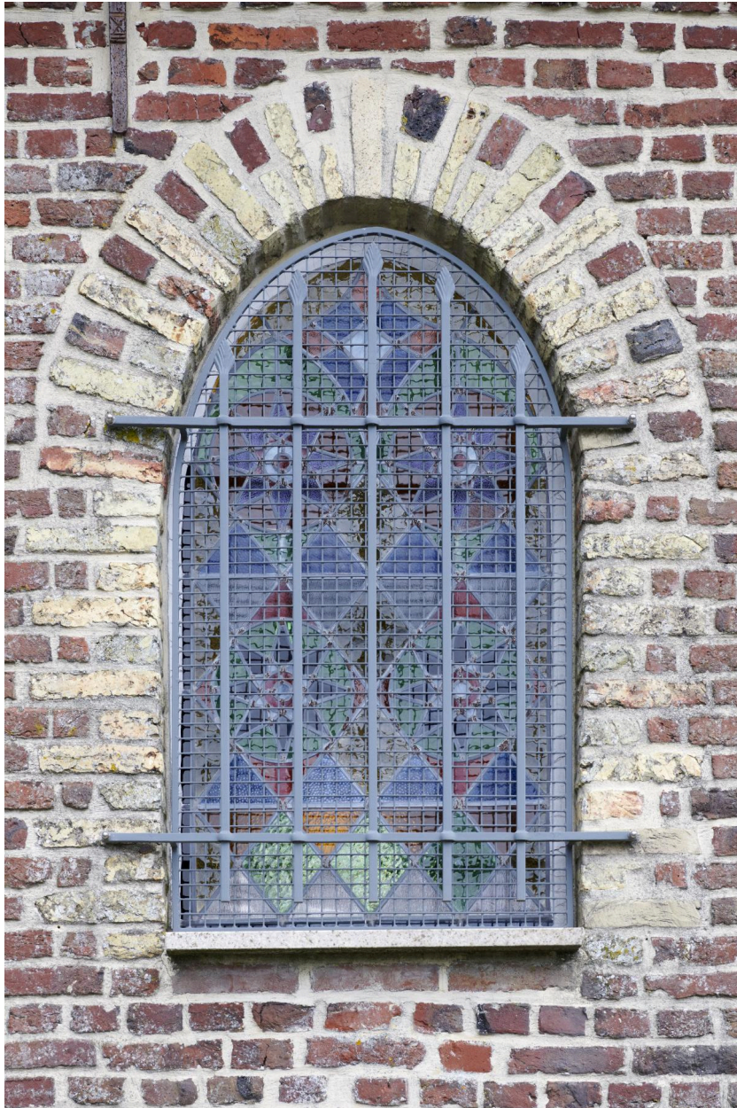
Détail de l'une des baies.