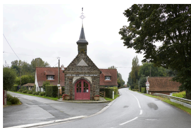
La chapelle dans son environnement direct. IVR32_20245903170NUCA