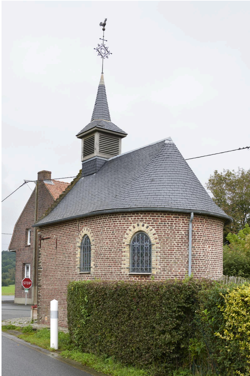
Détail depuis le sud-ouest.