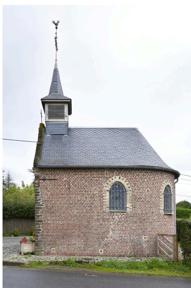
Flanc ouest de la chapelle.