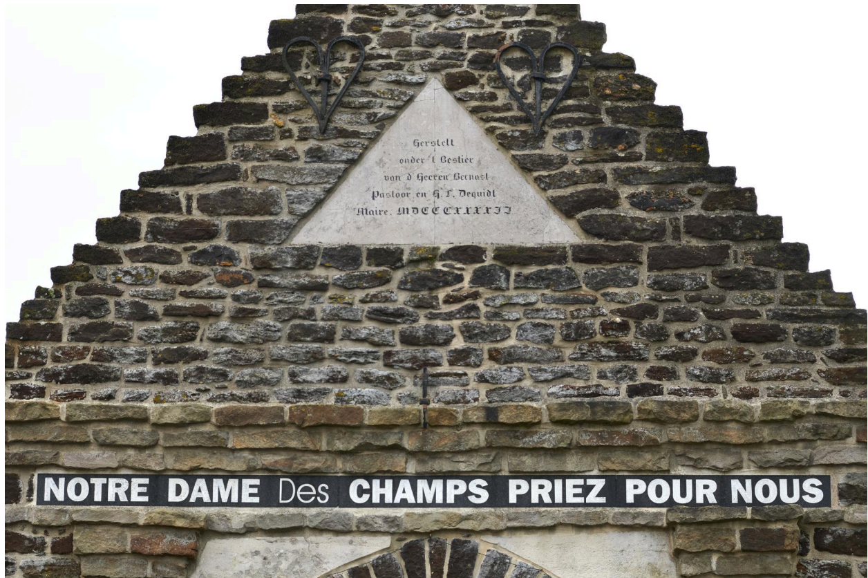
Détail du fronton et de la dédicace.