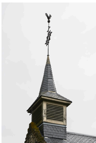
Détail du clocheton en bois. IVR32_20245903176NUCA