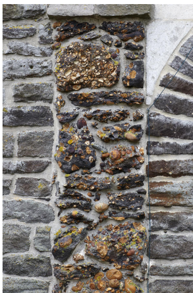
Détail des matériaux du pilastre et de la façade. IVR32_20245903172NUCA