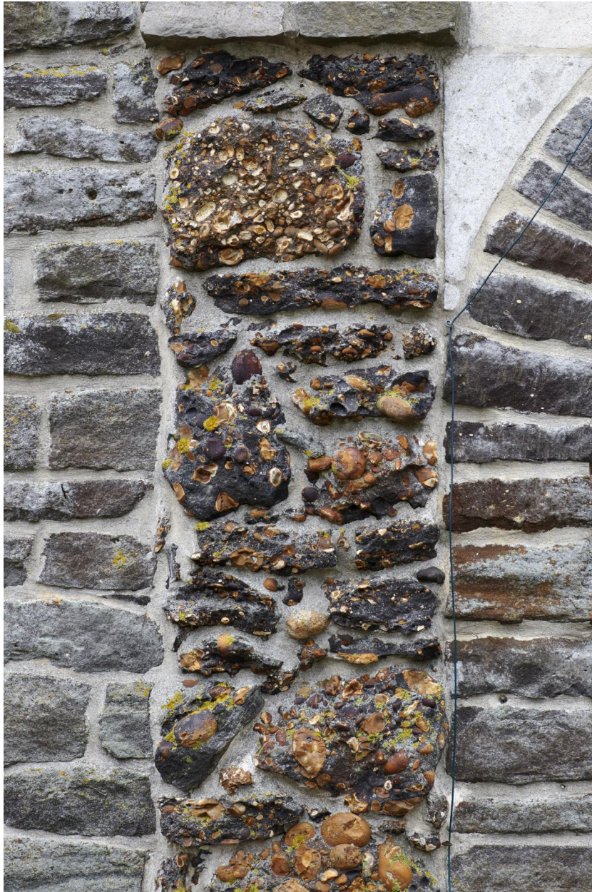
Détail des matériaux du pilastre et de la façade.