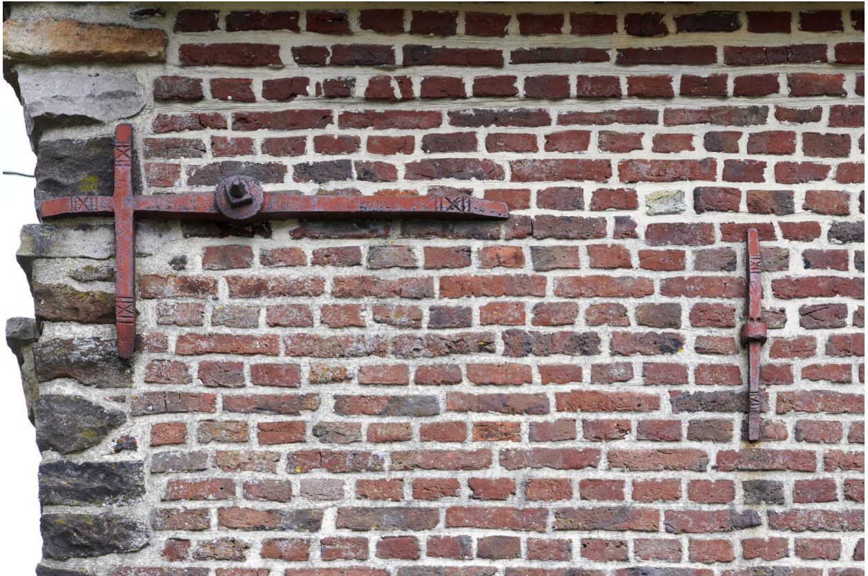
Détail des fers d'ancrage.