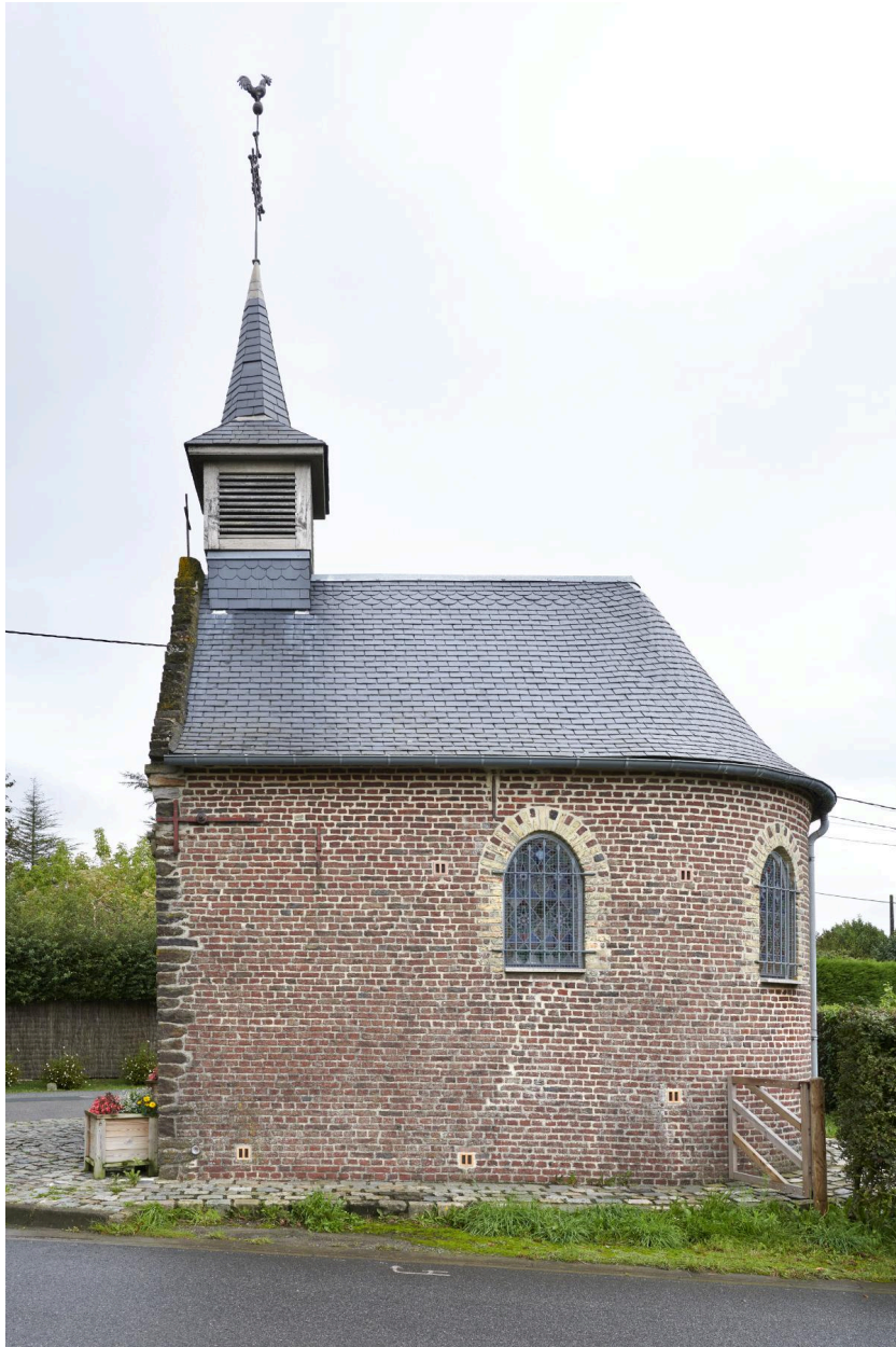
Flanc ouest de la chapelle.