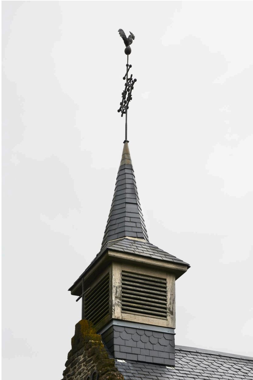
Détail du clocheton en bois.