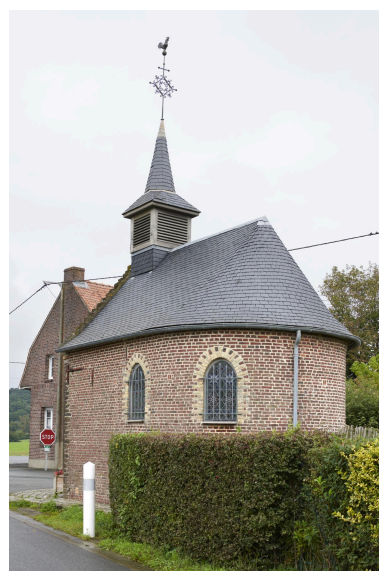
Détail depuis le sud-ouest. IVR32_20245903180NUCA