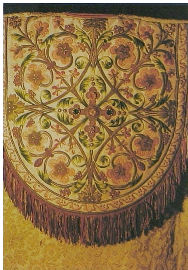
Vue de détail : chaperon (fonds AOA62 ; 11Fi). IVR31_20106204609NUCA