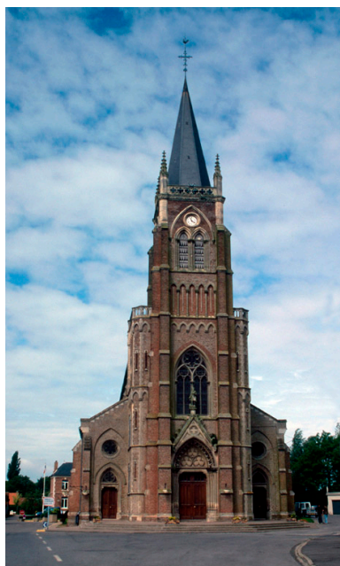
Façade occidentale. IVR22_20008000379ZA