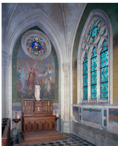
Chapelle sud. IVR22_19988000125VA