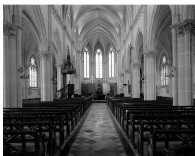
Vue intérieure, vers le chœur. IVR22_20008000429V