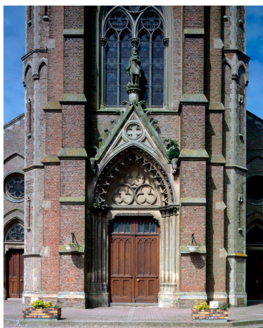
Détail du portail occidental.