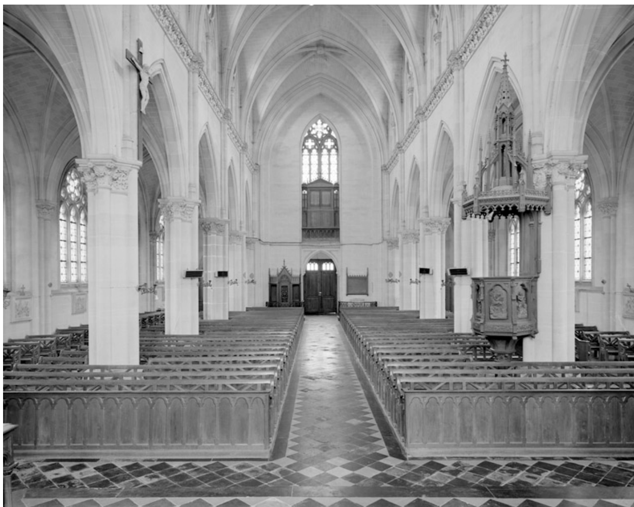
Vue intérieure, depuis le chœur.