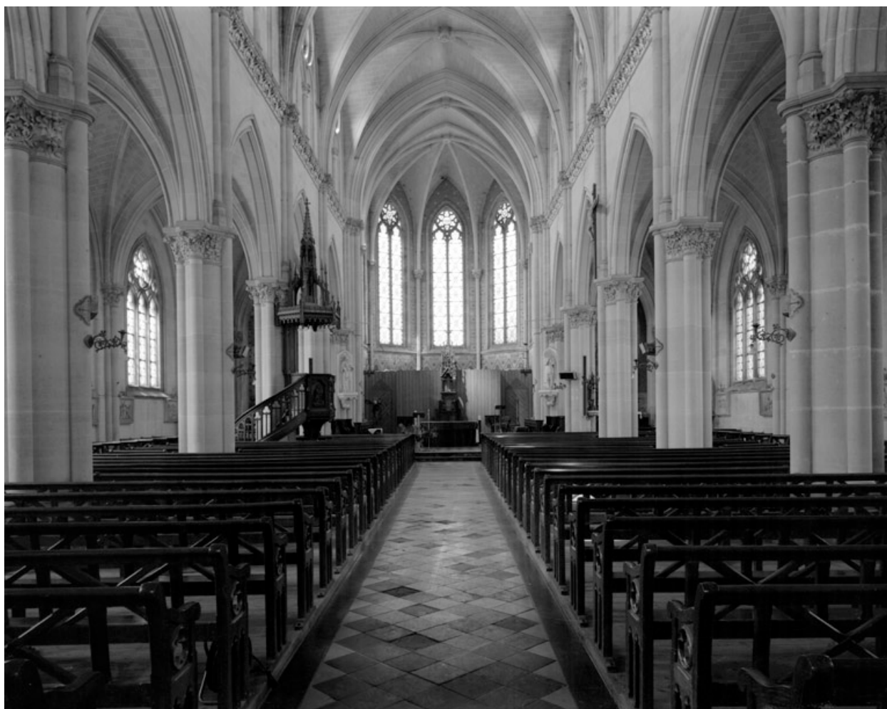
Vue intérieure, vers le chœur.