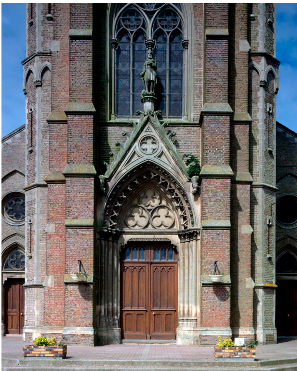
Détail du portail occidental.