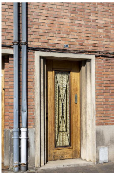
Détail du décor en fer forgé protégeant la porte du n°11 : croix de Saint-André brochant sur deux rectangles emboîtés.