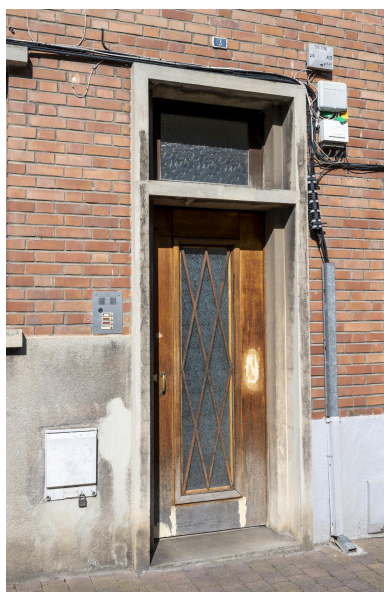
Détail du décor en fer forgé protégeant la porte du n °3 : quadrillage losangé. IVR32_20255900500NUCA