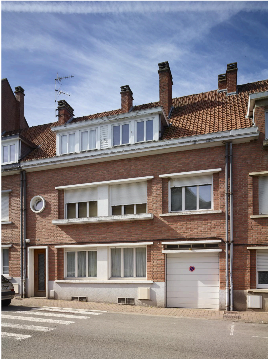
Détail du n°7, maison individuelle.