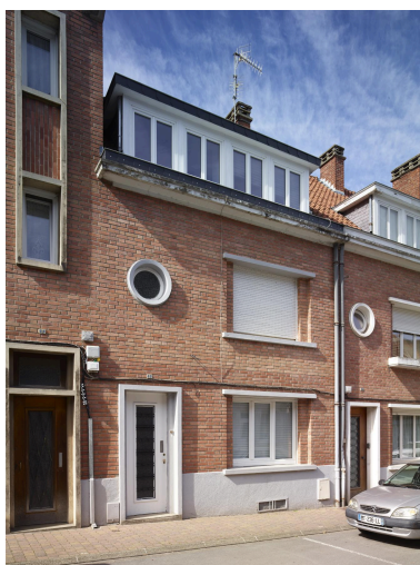
Détail du n°5, maison individuelle. IVR32_20245900874NUCA