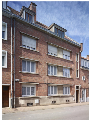
Détail de l'immeuble à logements, n°3. IVR32_20245900875NUCA