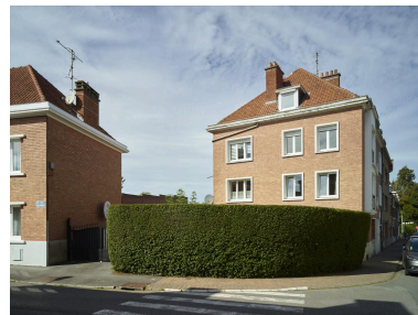
Façade pignon sur la rue Carlier. IVR32_20245900912NUCA