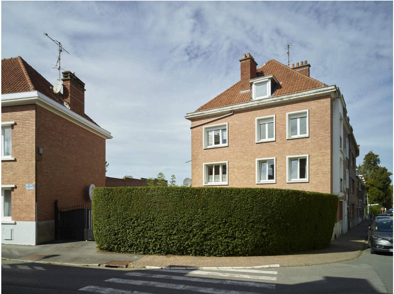
Façade pignon sur la rue Carlier.