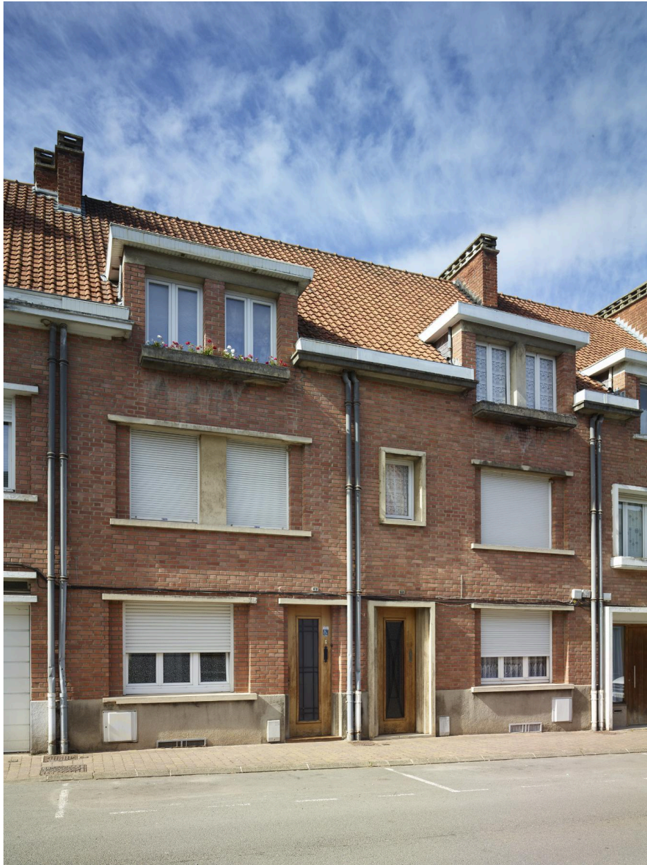
Détail des maisons individuelles n°9 et 11.