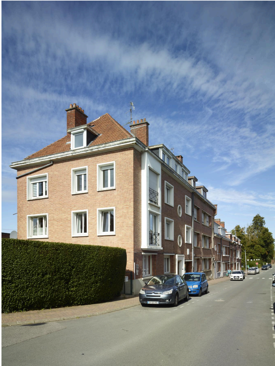
Vue générale du rang. Vue orientée sud/nord.