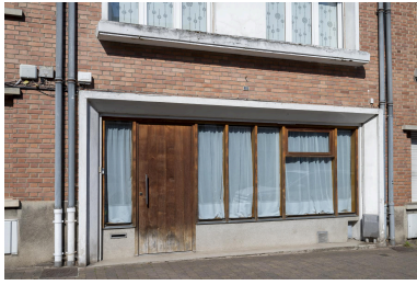
Détail de la vitrine occupant le rez-de-chaussée du n°13.