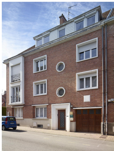
Détail du n°1, l'un des deux immeubles à logements du rang. Vue orientée nord/sud. IVR32_20245900879NUCA