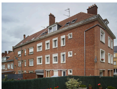
Façade arrière des n°1, 3 et 5, vue depuis la rue Carlier. Vue orientée sud-ouest/nord-est.