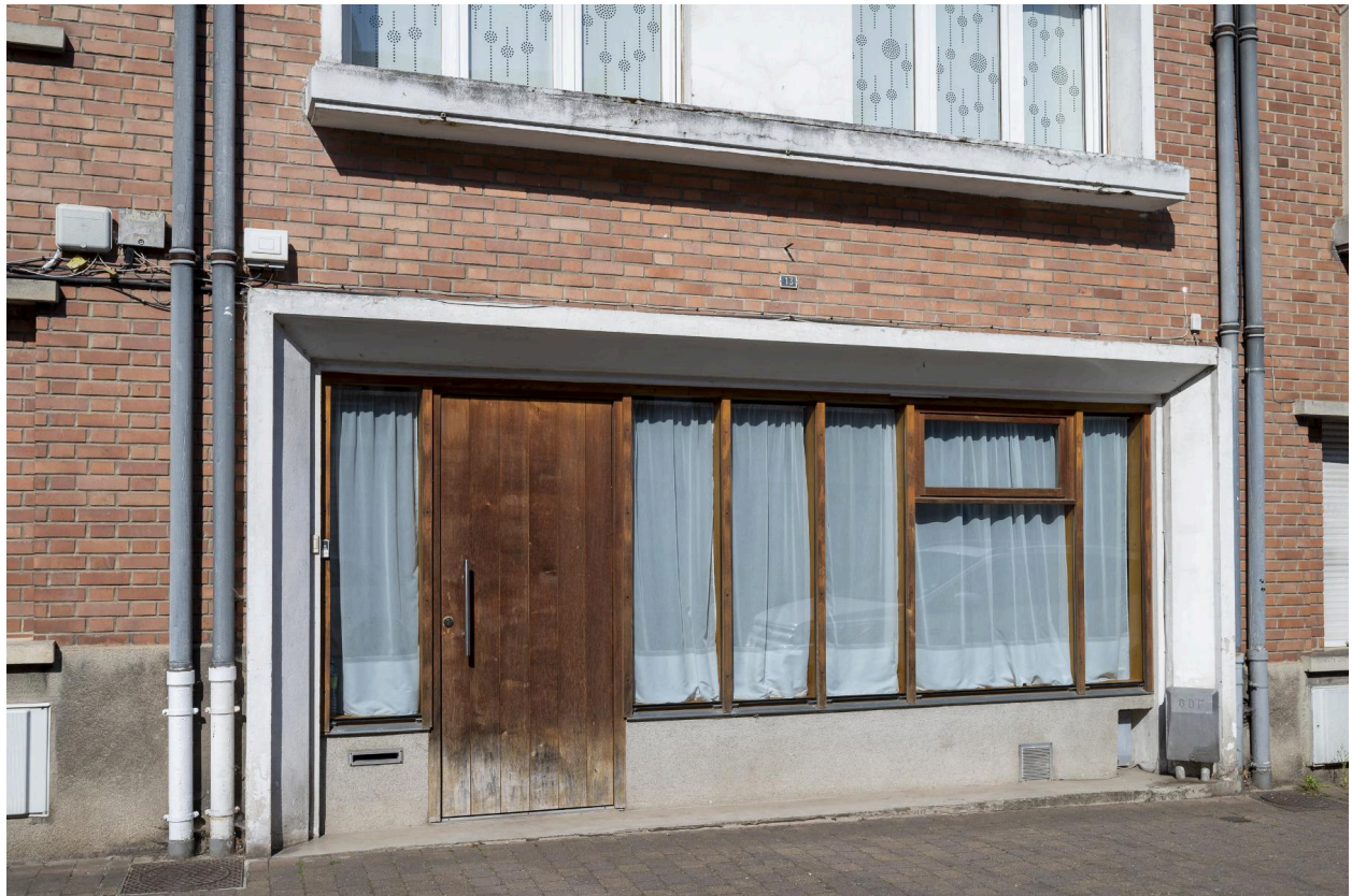
Détail de la vitrine occupant le rez-de-chaussée du n°13.