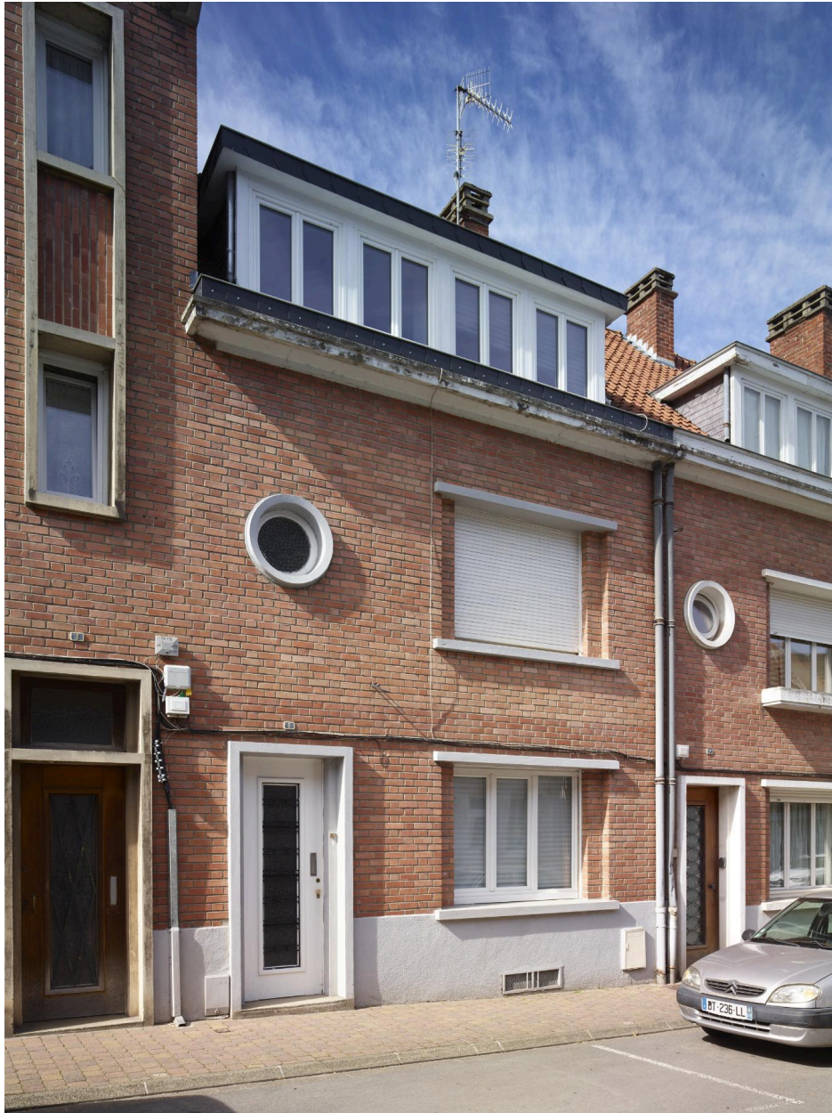
Détail du n°5, maison individuelle.