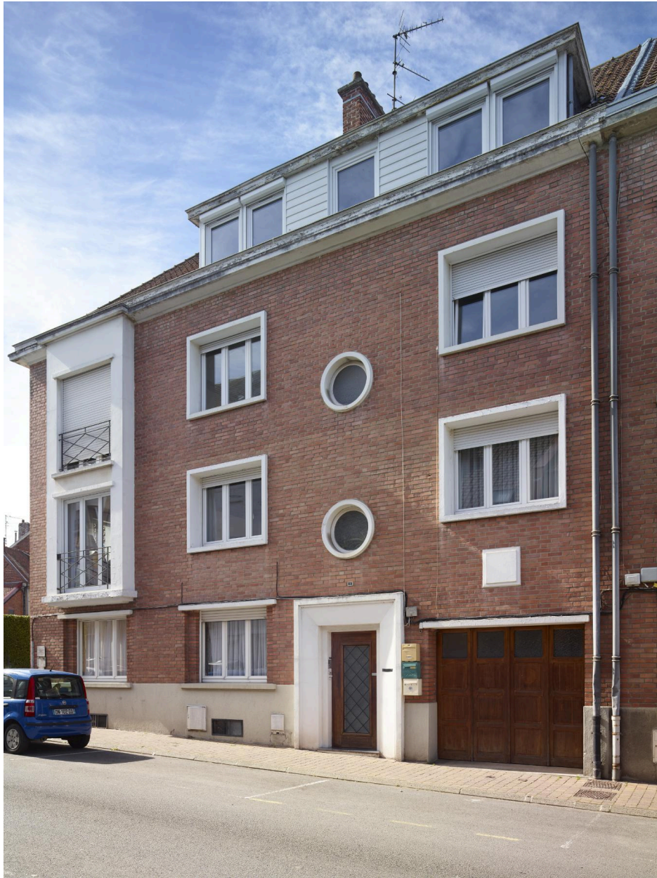
Détail du n°1, l'un des deux immeubles à logements du rang. Vue orientée nord/sud.