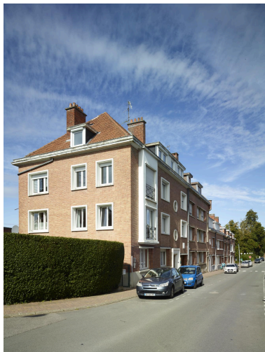
Vue générale du rang. Vue orientée sud/nord. IVR32_20245900878NUCA