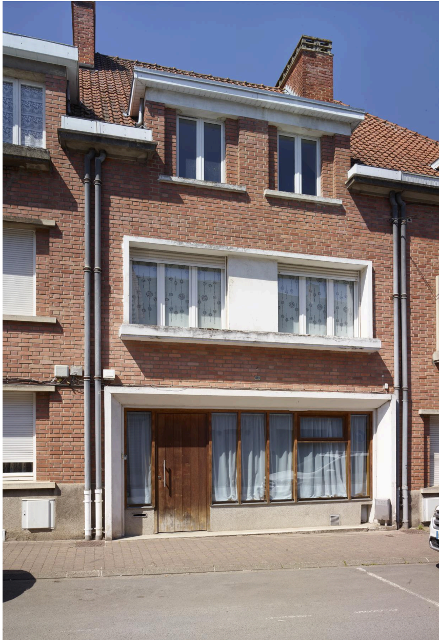
Détail du n°13, unique maison à boutique du rang.