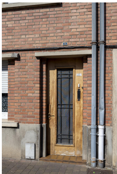
Détail du décor en fer forgé protégeant la porte du n°9 : quadrillage vertical.