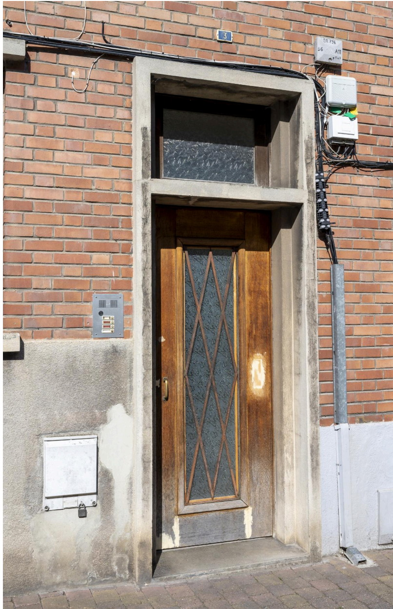
Détail du décor en fer forgé protégeant la porte du n°3 : quadrillage losangé.