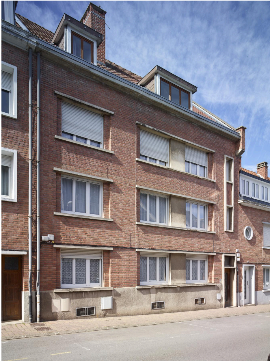
Détail de l'immeuble à logements, n°3.