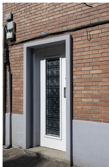
Détail du décor en fer forgé protégeant la porte du n °5 : quadrillage horizontal.