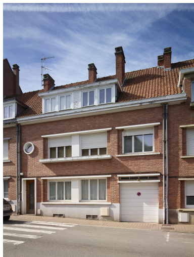
Détail du n°7, maison individuelle.