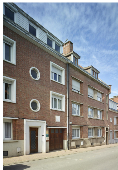
Détail des n°1, 3 et 5 montrant la différence de gabarit entre les immeubles à logements et la maison jointive, mais également la continuité formelle entre les deux bâtiments. Vue orientée sud/nord.