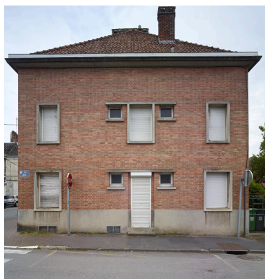
Façade pignon sur la rue Goa.