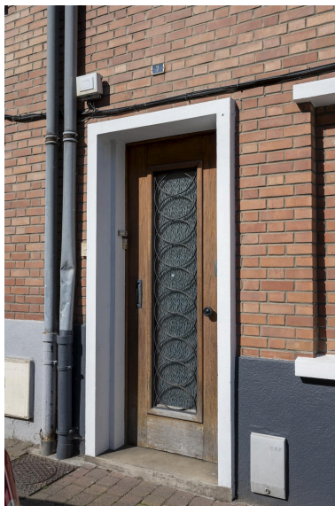
Détail du décor en fer forgé protégeant la porte du n°7 : spirales ovoïdes.