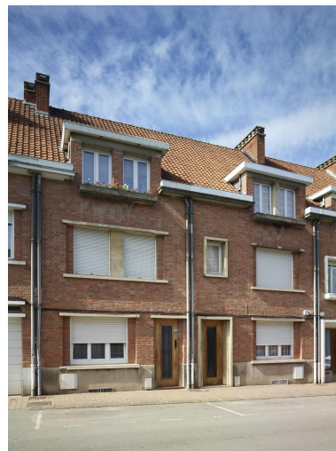
Détail des maisons individuelles n°9 et 11.