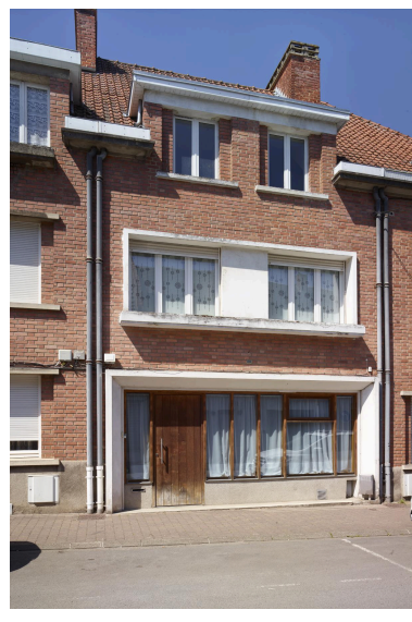
Détail du n°13, unique maison à boutique du rang.