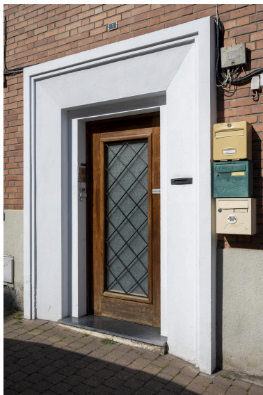
Détail de la porte du n°1 (immeuble collectif) : du décor en fer forgé en quadrillage de petits carrés et large entourage en béton avec chambranle à cru mouluré.