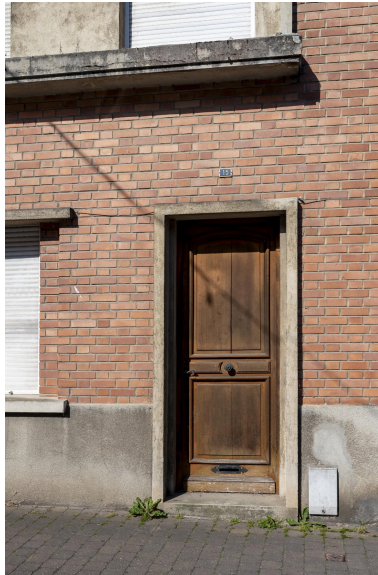
Détail du décor en fer forgé protégeant la porte du n°15 : porte modifiée. Remplacée par une porte en bois peint, elle a perdu son décor en fer forgé. IVR32_20255900507NUCA