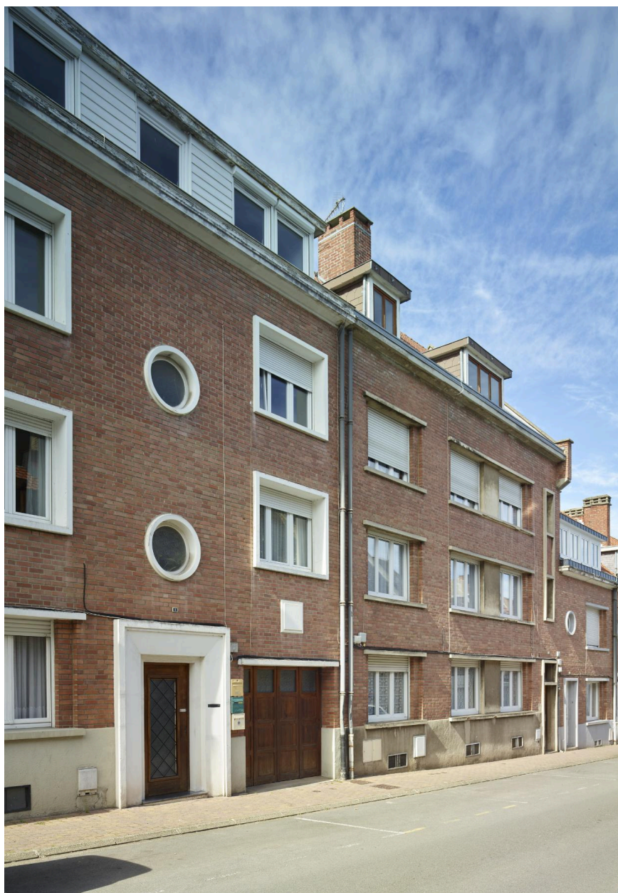
Détail des n°1, 3 et 5 montrant la différence de gabarit entre les immeubles à logements et la maison jointive, mais également la continuité formelle entre les deux bâtiments. Vue orientée sud/nord.