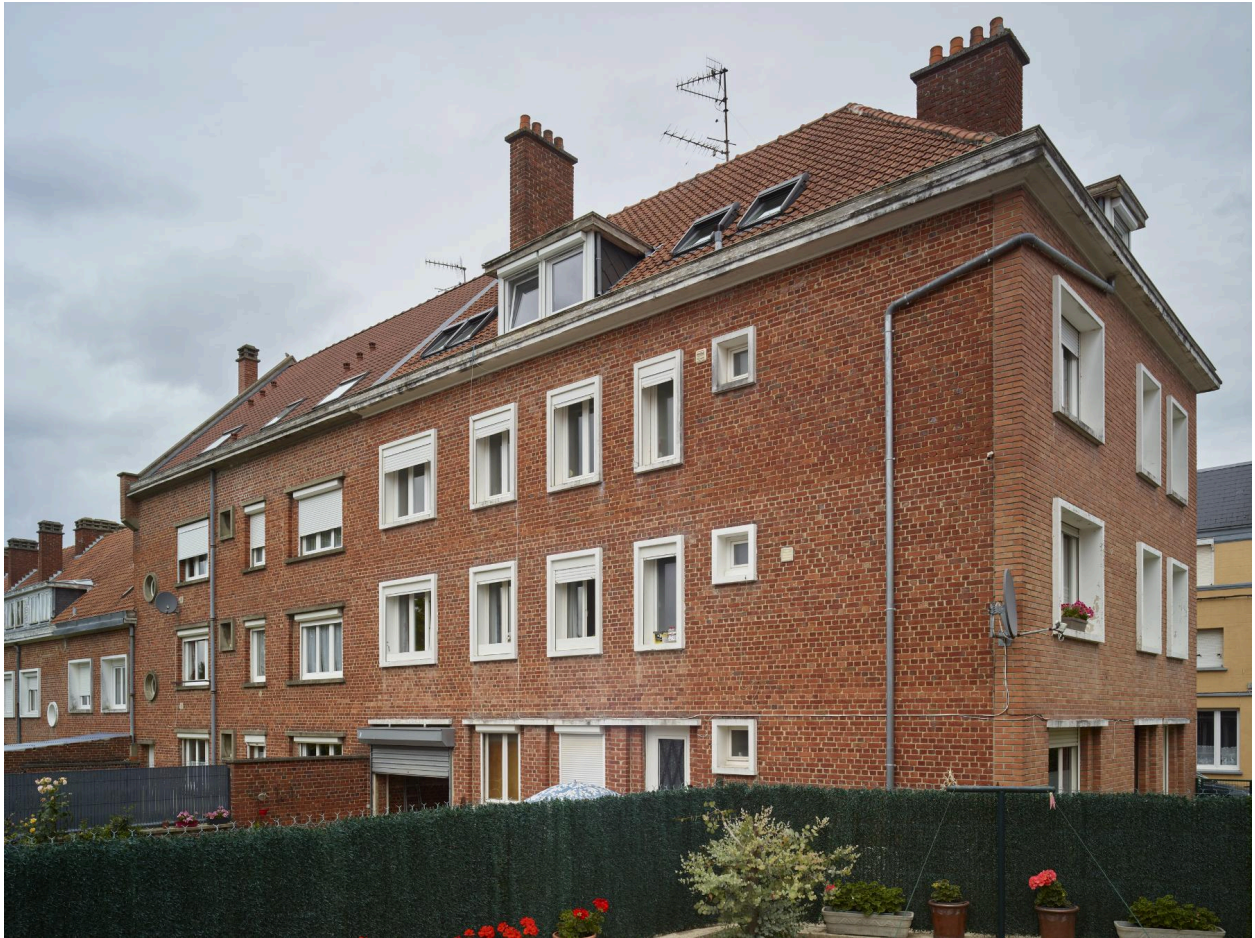
Façade arrière des n°1, 3 et 5, vue depuis la rue Carlier. Vue orientée sud-ouest/nord-est.