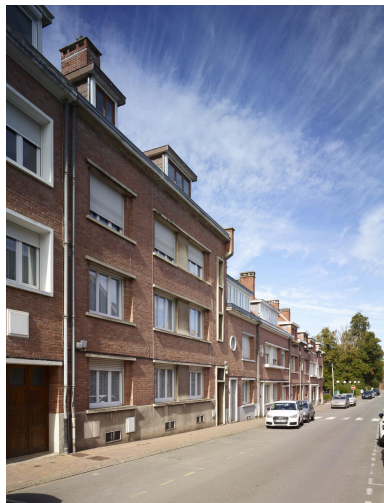
Vue générale du rang orientée sud/nord. IVR32_20245900876NUCA