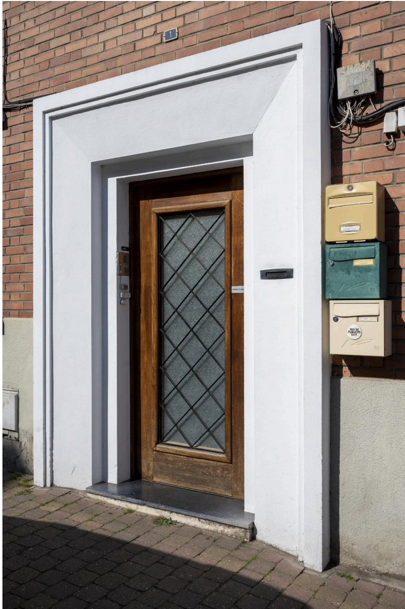
Détail de la porte du n°1 (immeuble collectif) : du décor en fer forgé en quadrillage de petits carrés et large entourage en béton avec chambranle à cru mouluré.