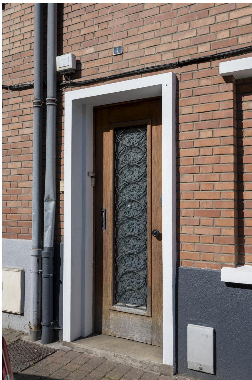
Détail du décor en fer forgé protégeant la porte du n°7 : spirales ovoïdes.