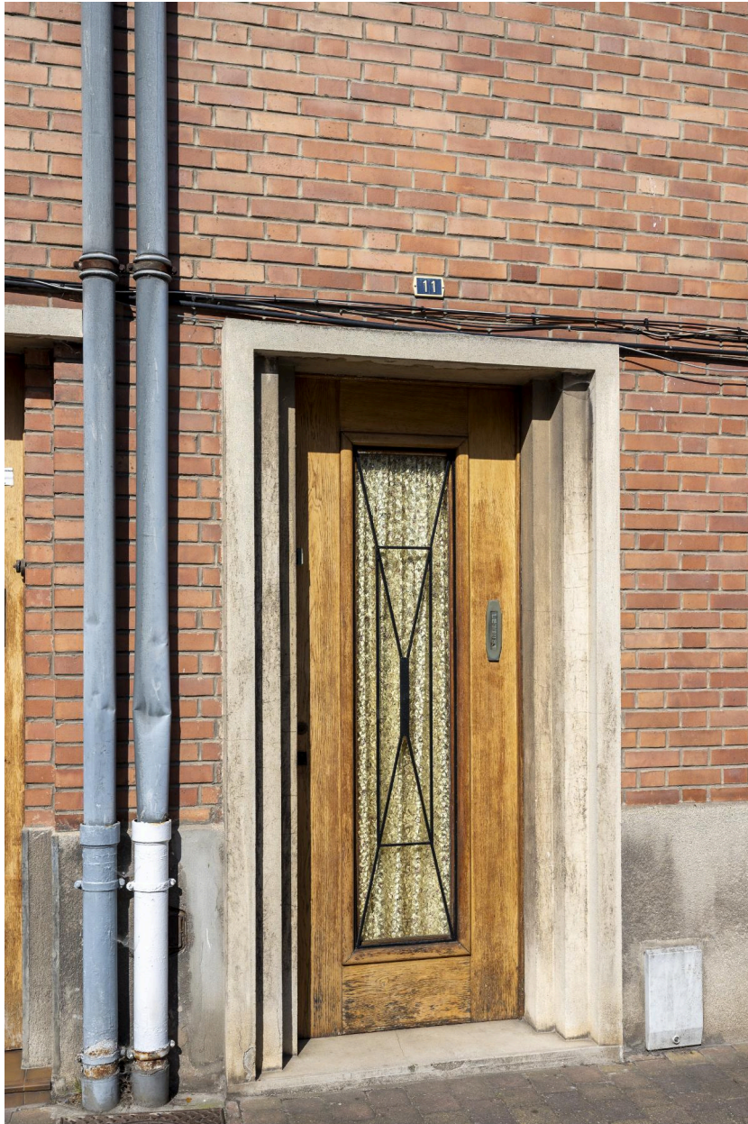
Détail du décor en fer forgé protégeant la porte du n°11 : croix de Saint-André brochant sur deux rectangles emboîtés.