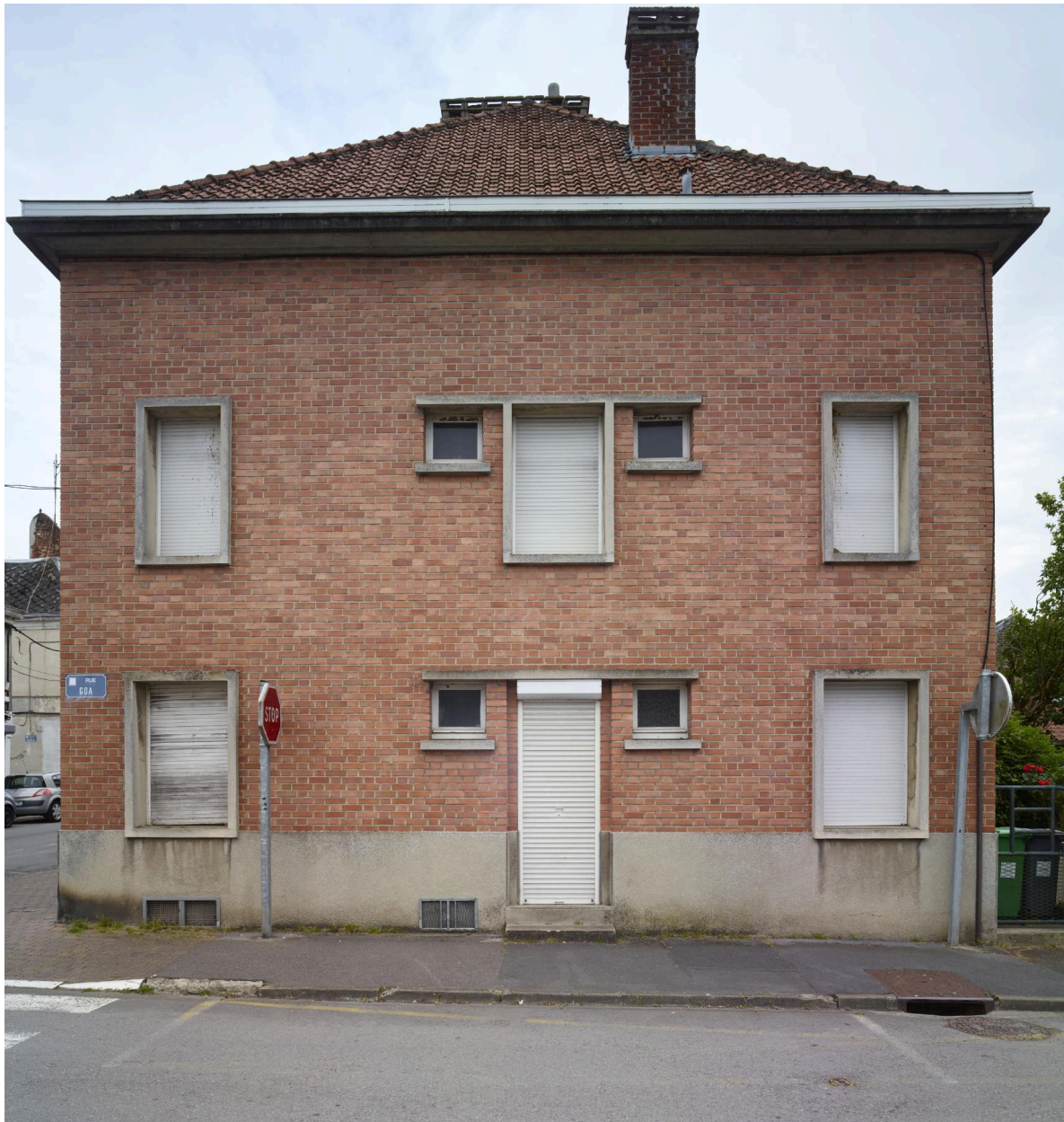
Façade pignon sur la rue Goa.