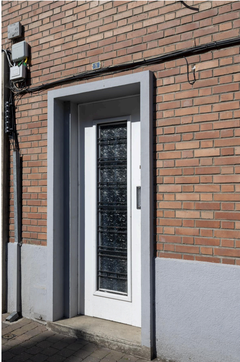
Détail du décor en fer forgé protégeant la porte du n°5 : quadrillage horizontal.