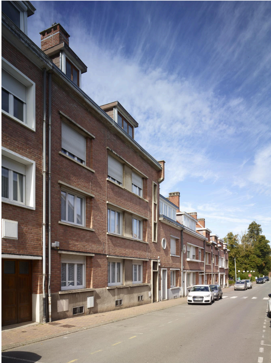
Vue générale du rang orientée sud/nord.