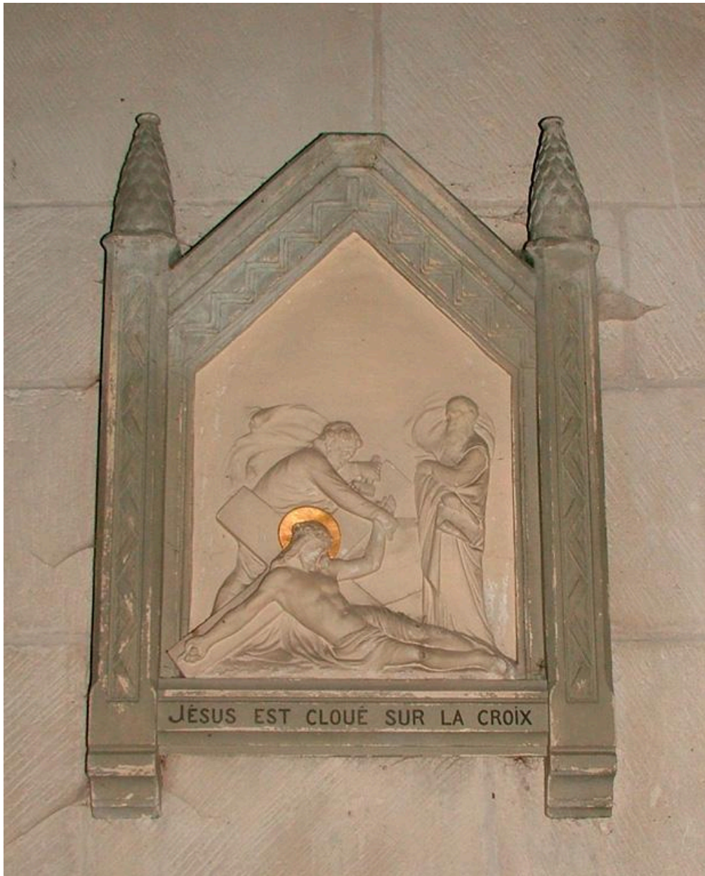
Détail de la 11e station du chemin de croix : Jésus est cloué sur la croix.