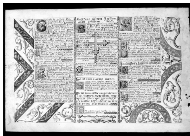
Vue des canons d'autel sous verre, imprimerie et chromolithographie sur papier (limite 19e-20e siècle).