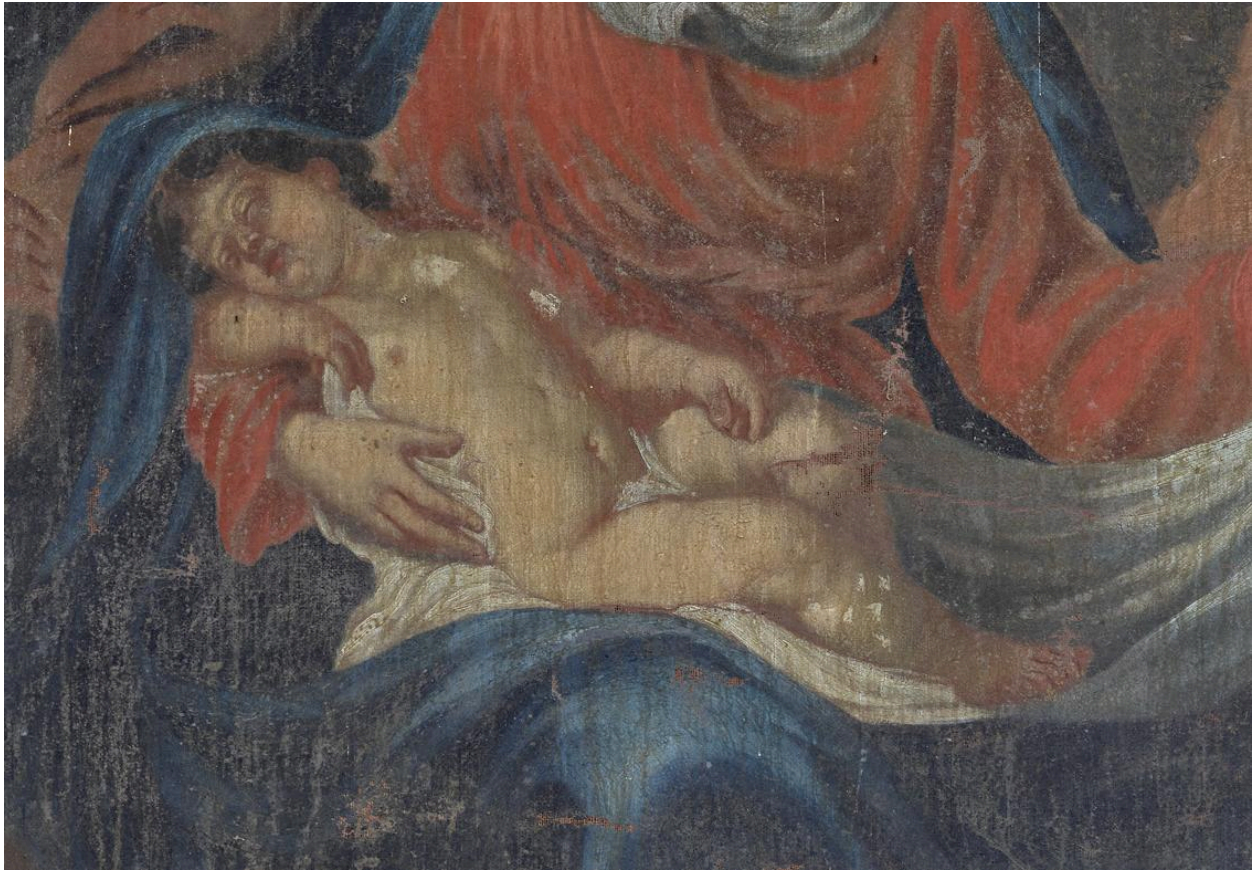
Détail du personnage de l'Enfant Jésus endormi.