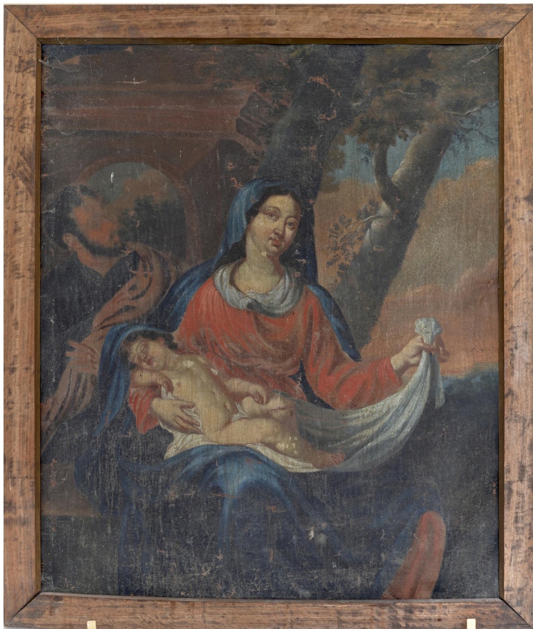
Vue générale du tableau de la Vierge à l'Enfant.