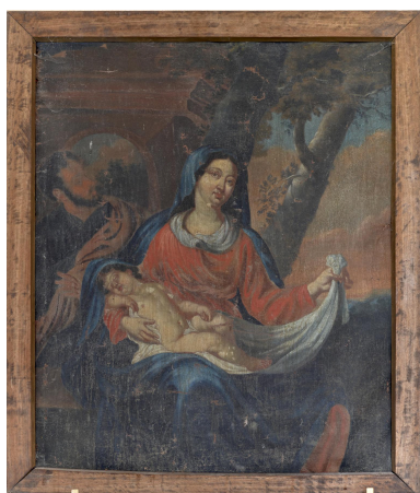
Vue générale du tableau de la Vierge à l'Enfant. IVR32_20238000369NUCA