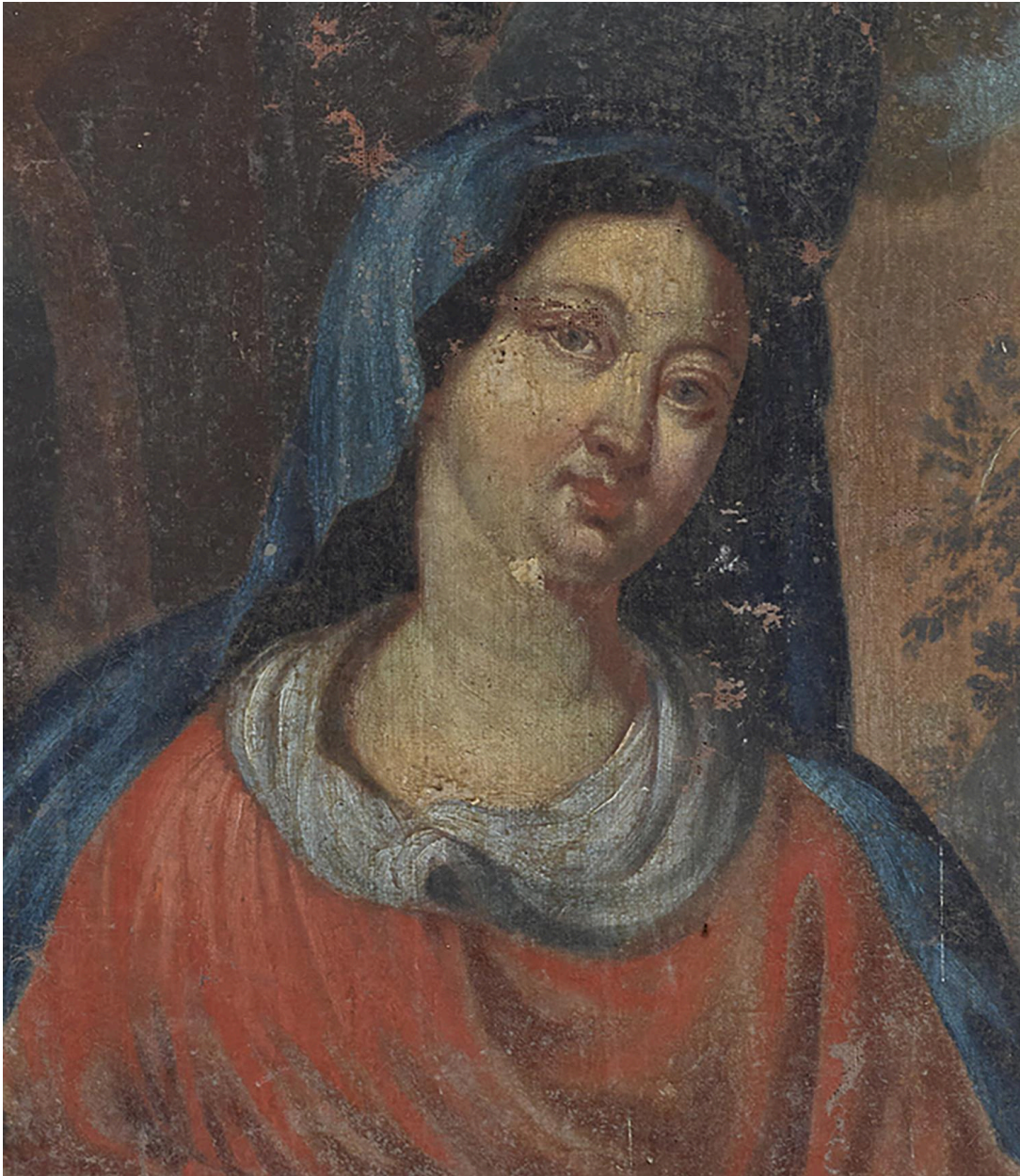
Détail du visage de la Vierge.