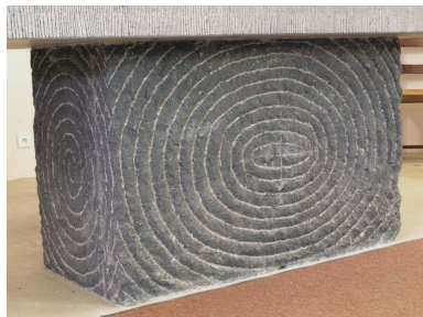
Vue partielle, partie inférieure IVR31_20106203147NUCA