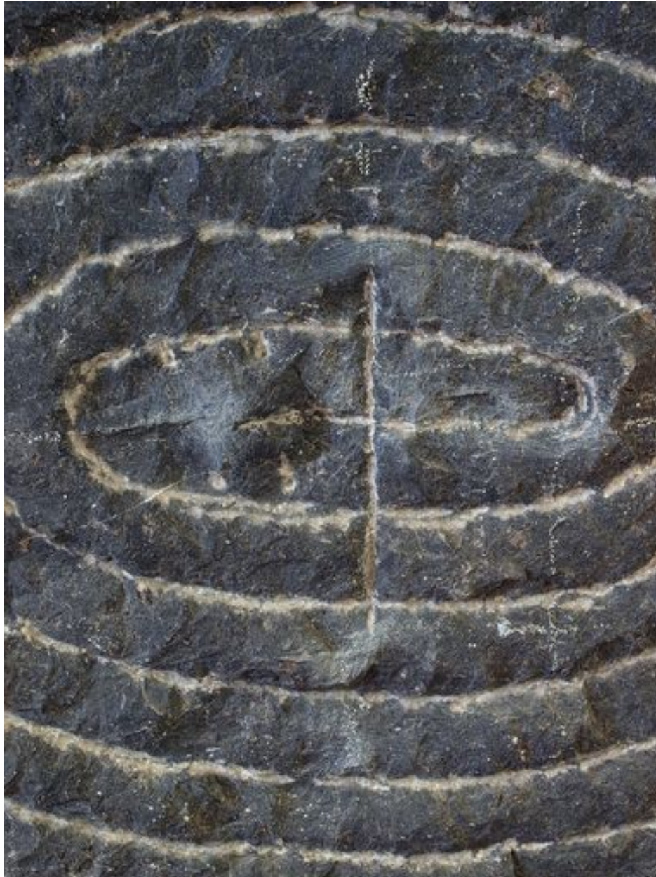
Vue de détail, décor