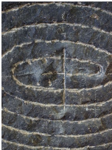
Vue de détail, décor IVR31_20106203148NUCA