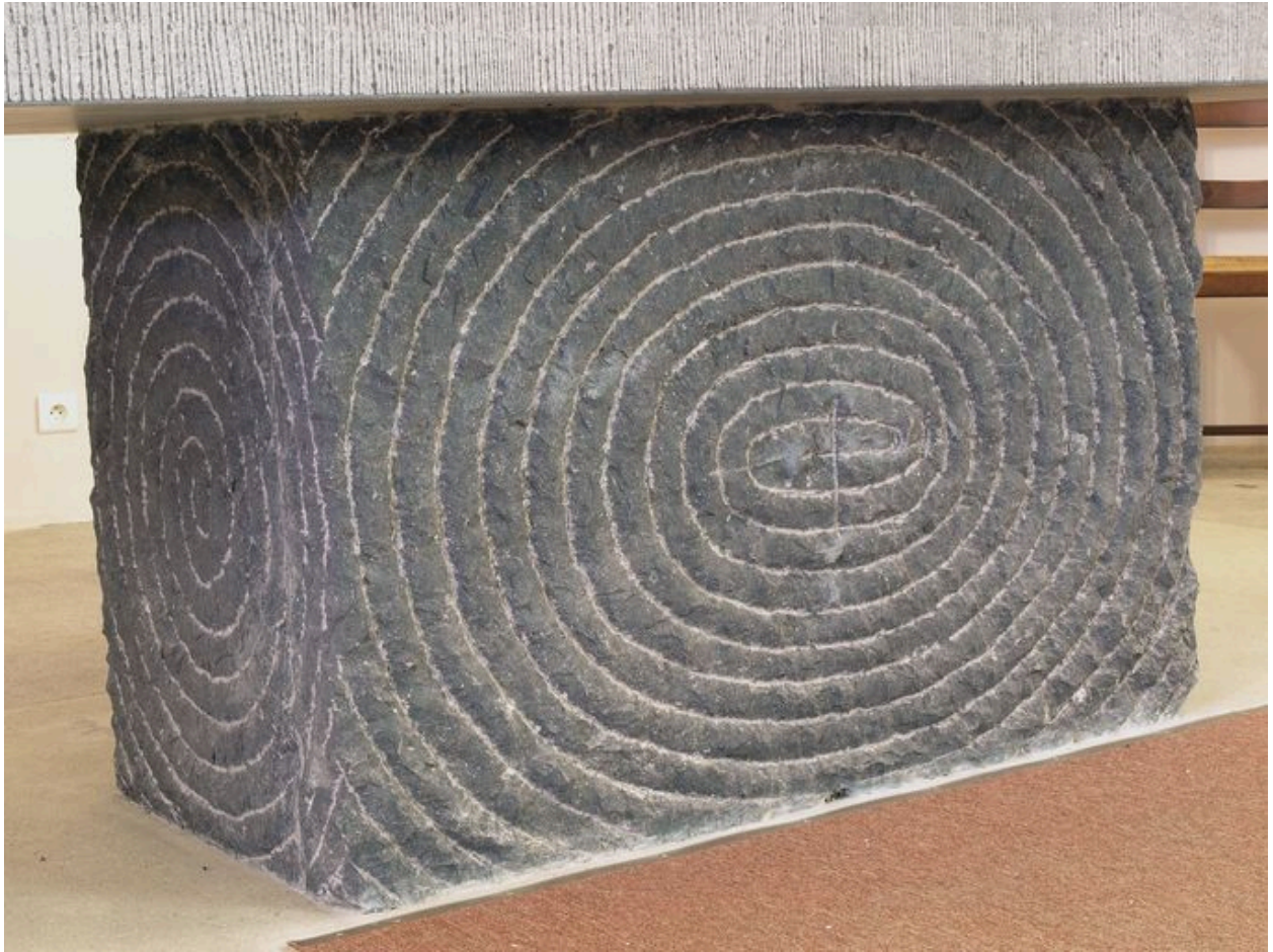
Vue partielle, partie inférieure