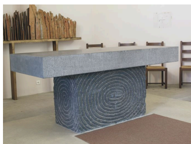
Vue générale IVR31_20106203145NUCA