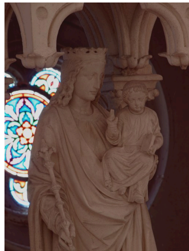
Vue partielle