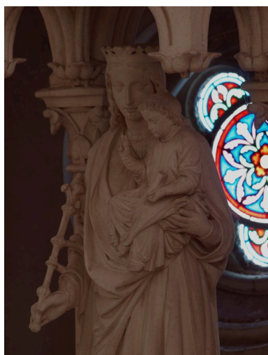
Vue partielle