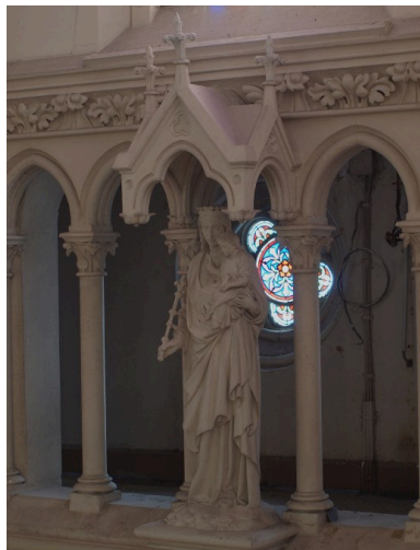
Vue générale IVR31_20106204384NUCA