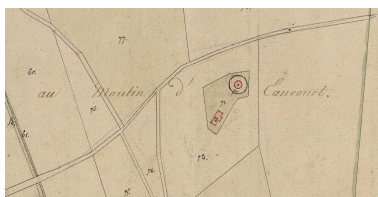
Plan masse du moulin, extrait du plan parcellaire de la commune d'Eaucourt-sur-Somme, dit cadastre napoléonien Section A, [s.d.]