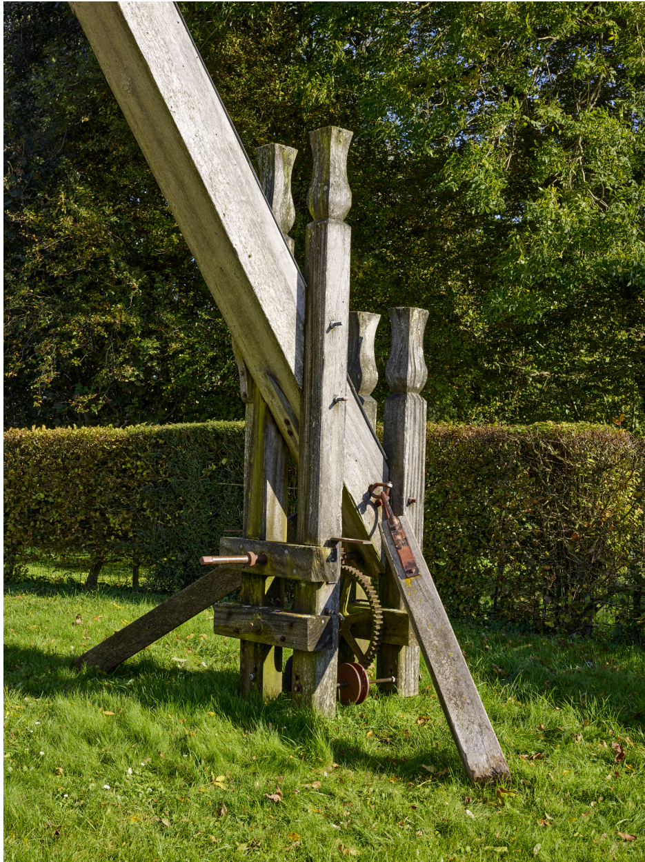
Guivre (queue) du moulin.