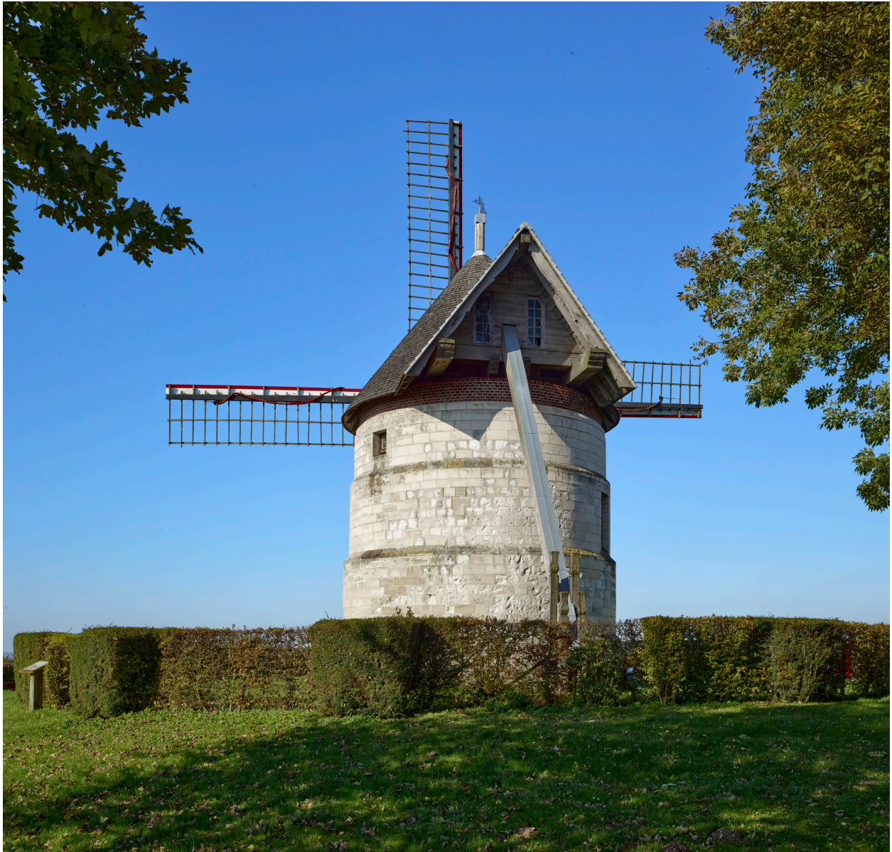
Vue du moulin, depuis l'est.