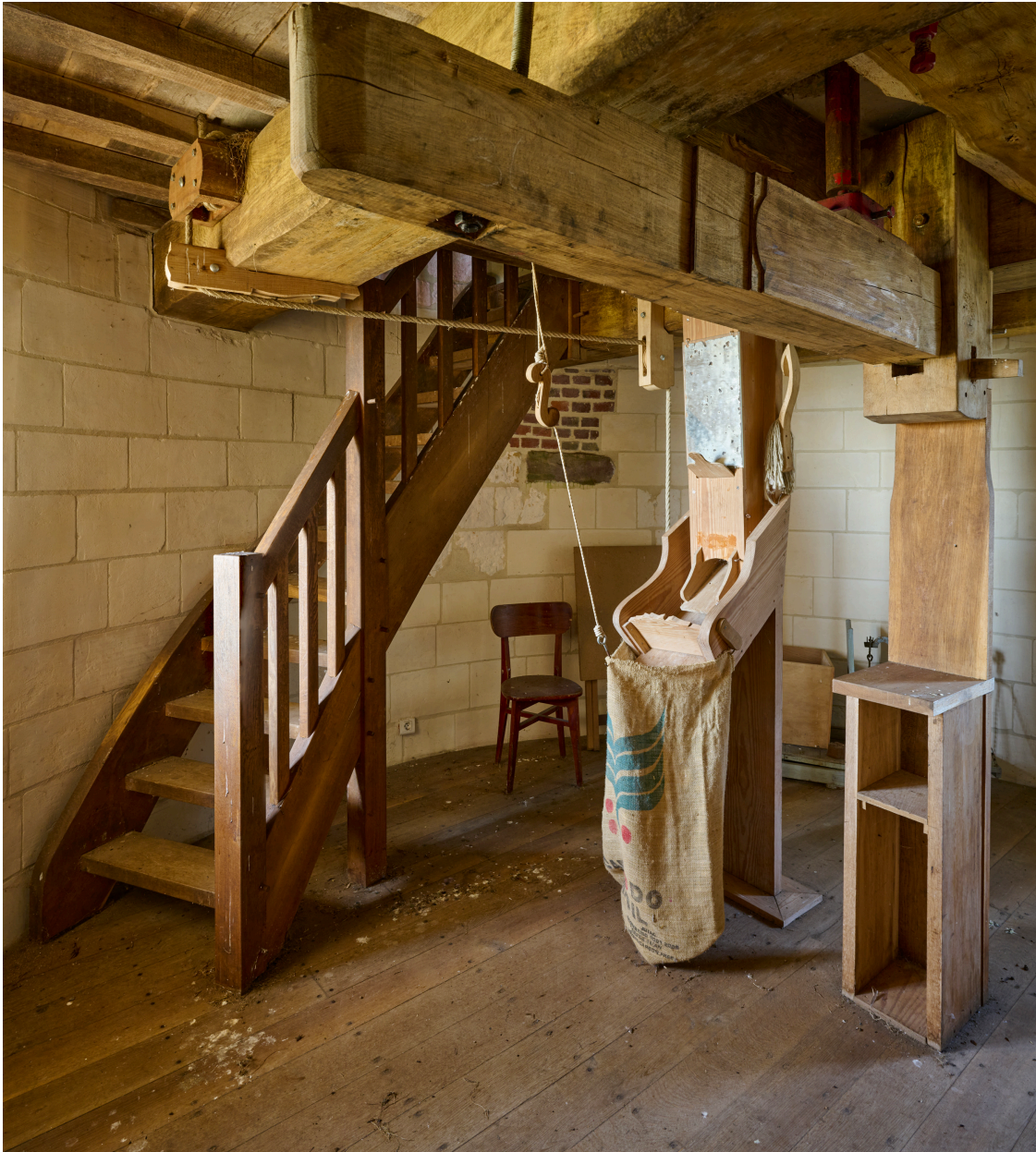
Intérieur, premier étage du moulin.