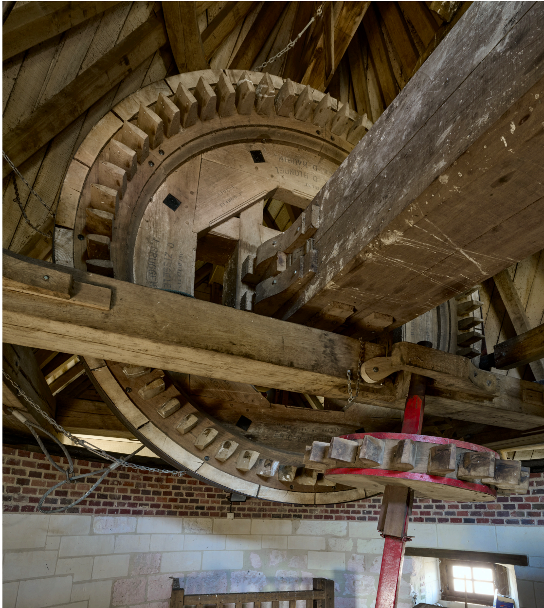
Intérieur, mécanisme du moulin, deuxième étage.