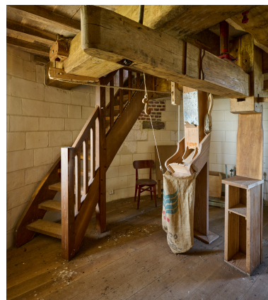
Intérieur, premier étage du moulin. IVR32_20248001751NUCA