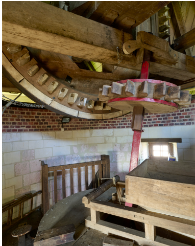
Intérieur, deuxième étage du moulin.