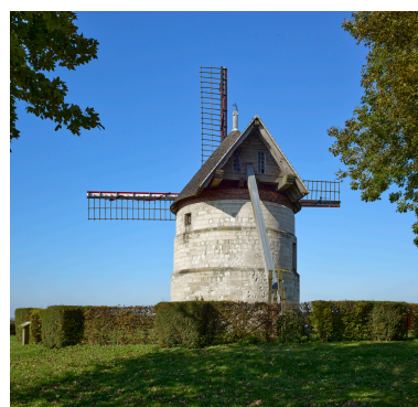
Vue du moulin, depuis l'est.