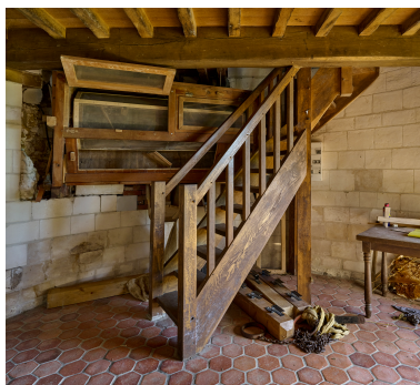
Intérieur, rez-de-chaussée du moulin.