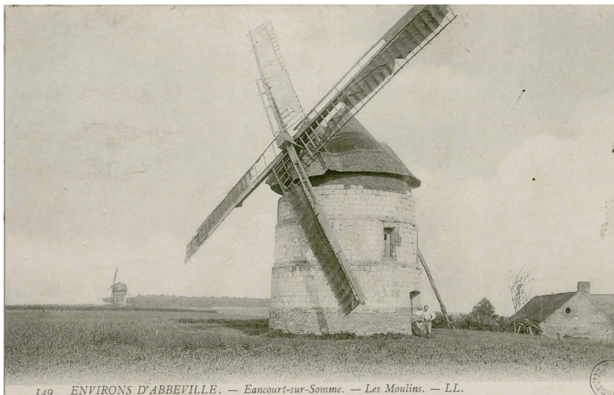
Les moulins à vents d'Eaucourt-sur-Somme, carte postale LL., [s.d.] (Archives et Bibliothèque patrimoniale d'Abbeville ; Ab.M26).