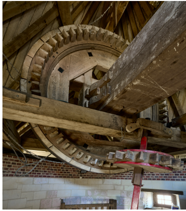
Intérieur, mécanisme du moulin, deuxième étage. IVR32_20248001743NUCA