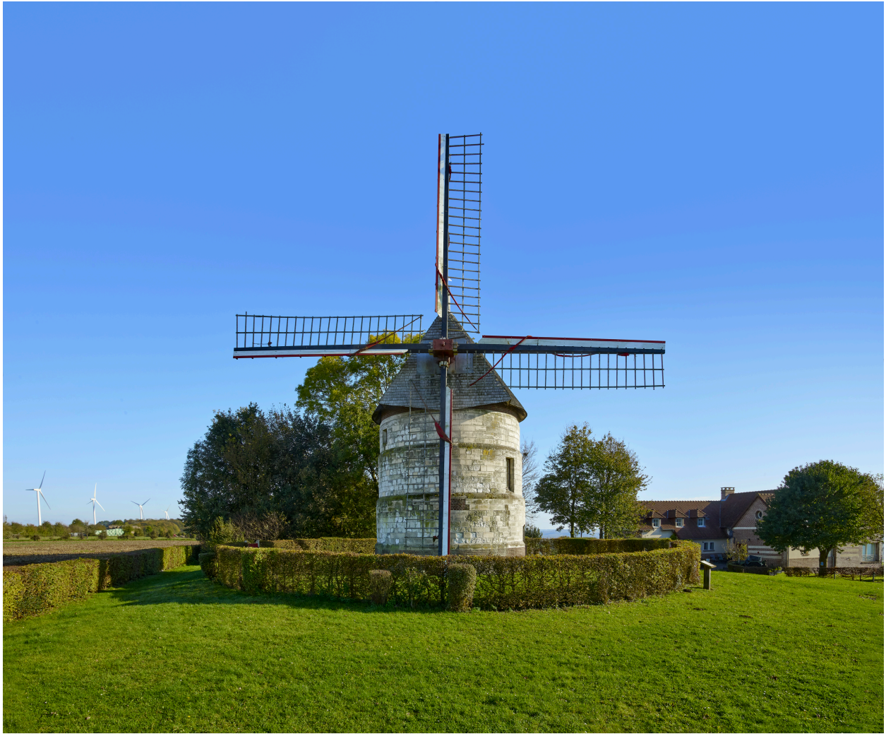
Vue du moulin, depuis l'ouest.