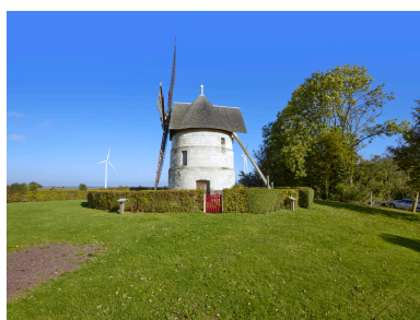
Vue du moulin, depuis le sud. IVR32_20248001730NUCA