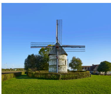
Vue du moulin, depuis l'ouest.