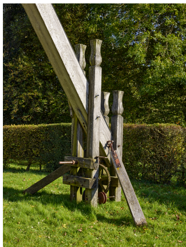
Guvire (queue) du moulin. IVR32_20248001737NUCA