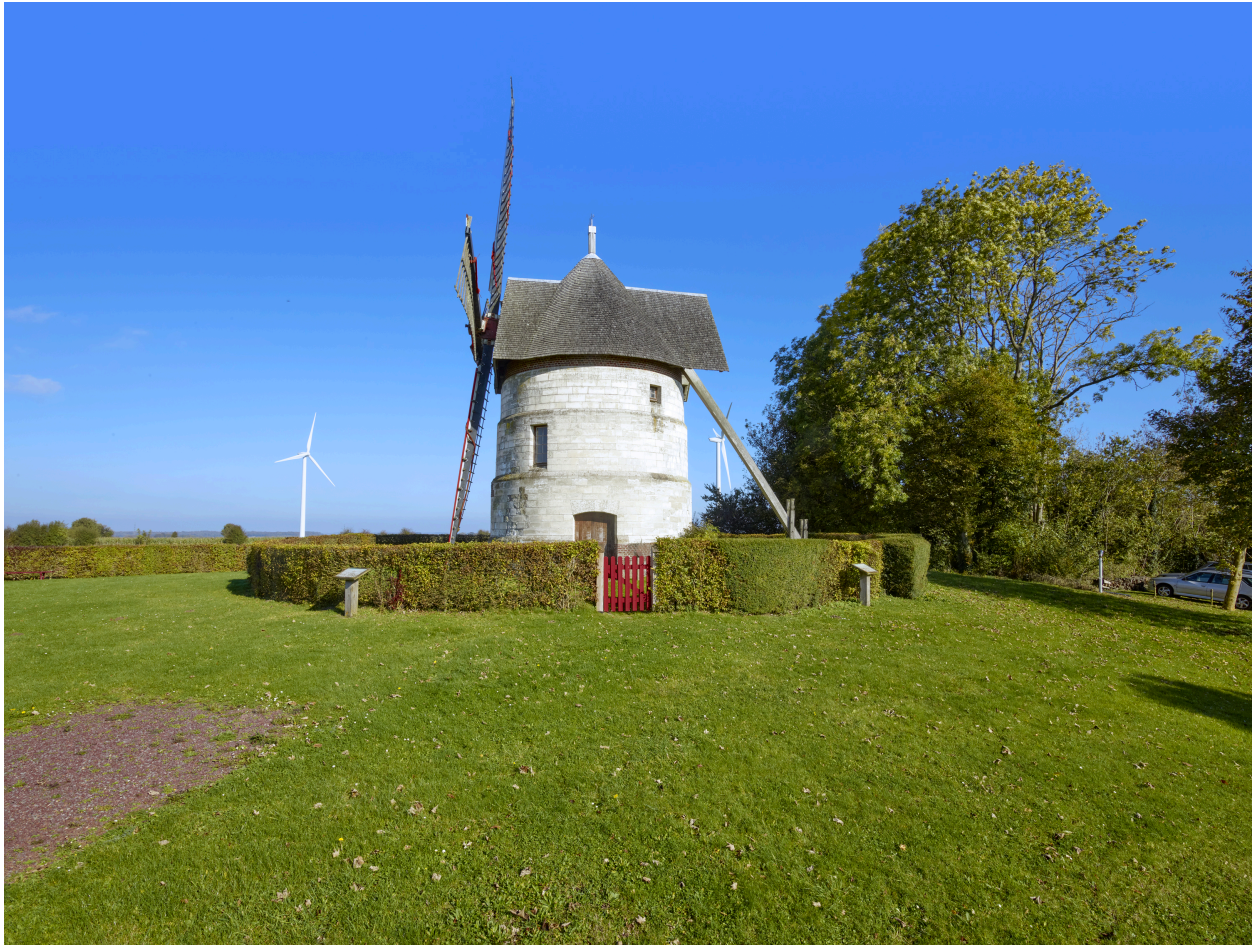
Vue du moulin, depuis le sud.