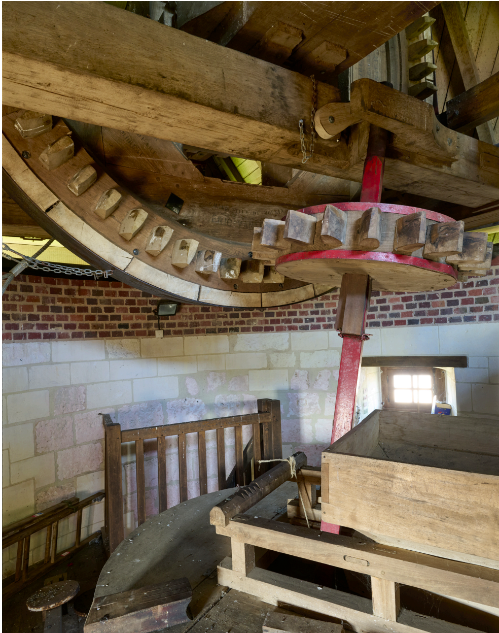
Intérieur, deuxième étage du moulin.