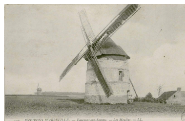
Les moulins à vents d'Eaucourt-sur-Somme, carte postale LL., [s.d.].