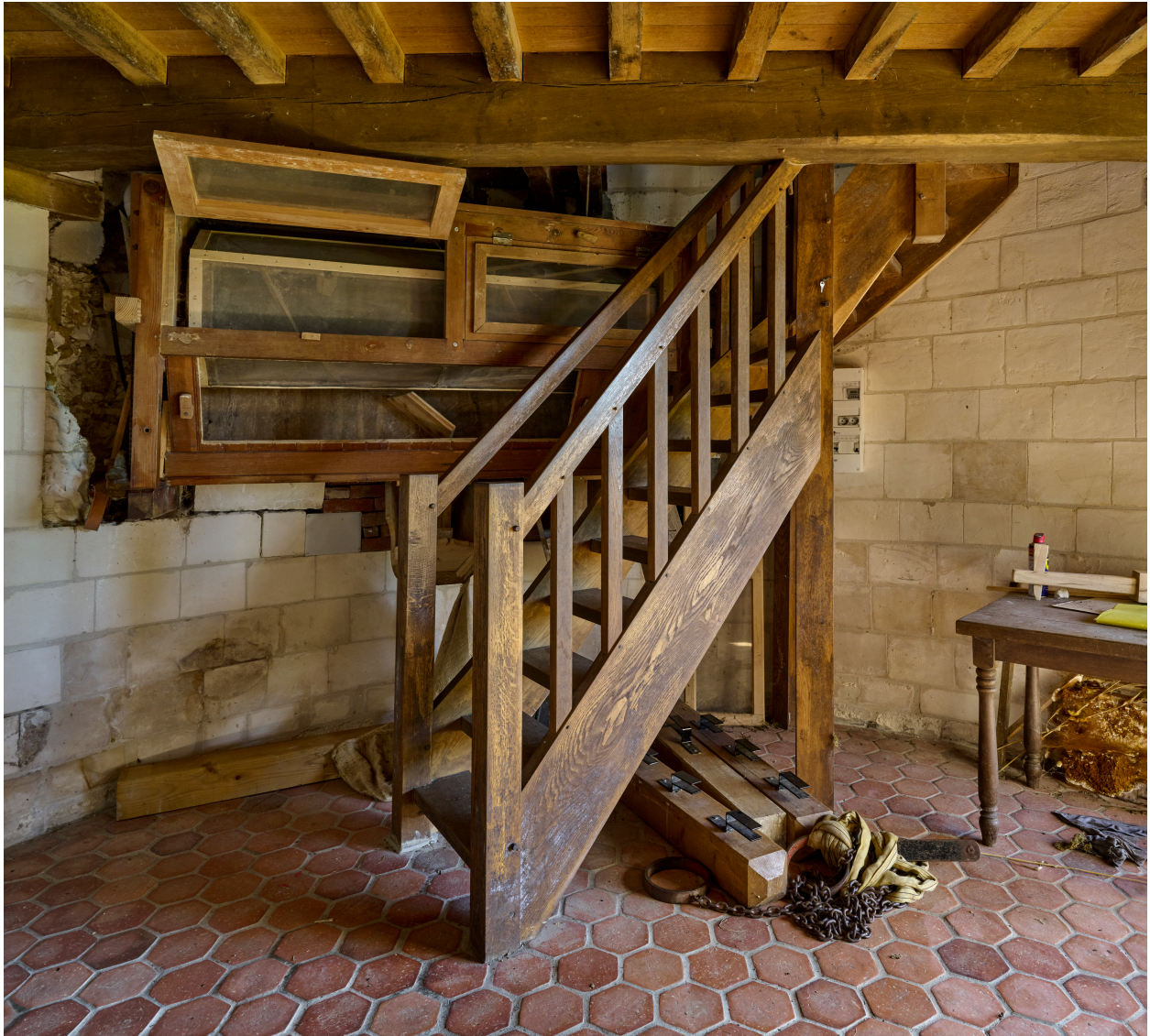
Intérieur, rez-de-chaussée du moulin.